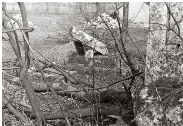
11-18. Zdewastowana północna część cmentarza. Fot. K. Garbacz, 1980