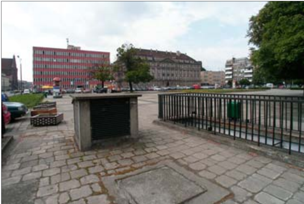
13. Perspektywa placu w stronę południową, na pierwszym planie urządzenie wentylacyjne i zejście do schronu. Fot. R. Eysymontt, 2006 r. 13. Perspective of the square towards the south, in the foreground: ventilation facility and shelter exit. Photo: R. Eysymontt, 2006.

obszaru wielkomięjskiego. Funkcje ograniczają się jedynie do mieszkalnych, urzędowych i podrzędnych funkcji handlowych. Aktywność w części pd.-zach. skupia się wokół biur Urzędu Miejskiego, a towarzyszący jej parking pokrywa już ok. 1/3 powierzchni placu. Część pn.-wsch. placu to jedynie przystanek tramwajowy i prowadzący doń chodnik, łączący dwa miejsca aktywności handlowej – Galerię Dominikańską i Halę Targową. Obszar ten nie może być w związku z tym traktowany na równi z innymi częściami staromiejskiego centrum miejskiego, z jego bogatą ofertą usługową i gastronomiczną. Nie ma również na Nowym Targu jakiegokolwiek elementu funkcji związanej z wyższymi uczelniami, tak ważnej dla północnej części obszaru staromiejskiego. Zadać więc należy pytanie, na ile owa „ułamność” funkcjonalna Nowego Targu uwarunkowana jest jego ukształtowaniem, zgodnie ze wskazaniem Jałowieckiego, oddziałującym na grupy społeczne i warunkującym ich zachowania.