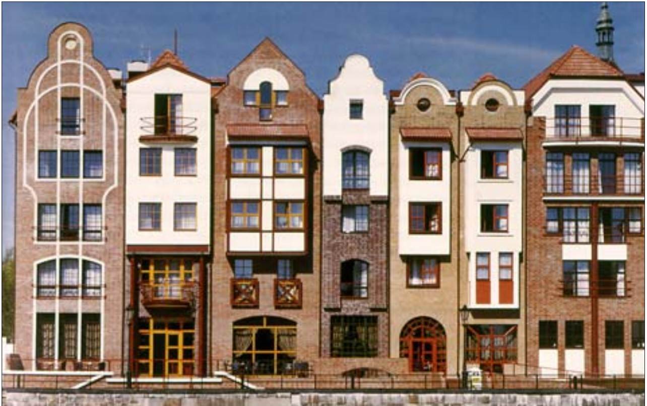
21. Gdańsk, zabudowa nad Motławą w sąsiedztwie gdańskiego Żurawia. Za zróżnicowanymi szczytowymi elewacjami kryje się wspólna struktura konstrukcyjna hotelu. Architekci: Szczepan Baum i Andrzej Kwieciński. Fot. Ł. Krzywka, 2006 r.

21. Gdańsk, buildings on the Motława in the vicinity of the Gdańsk wharf crane. The differentiated gable elevations, conceal a joint construction structure of the hotel. Architects: Szczepan Baum and Andrzej Kwieciński. Photo: Ł. Krzywka, 2006.