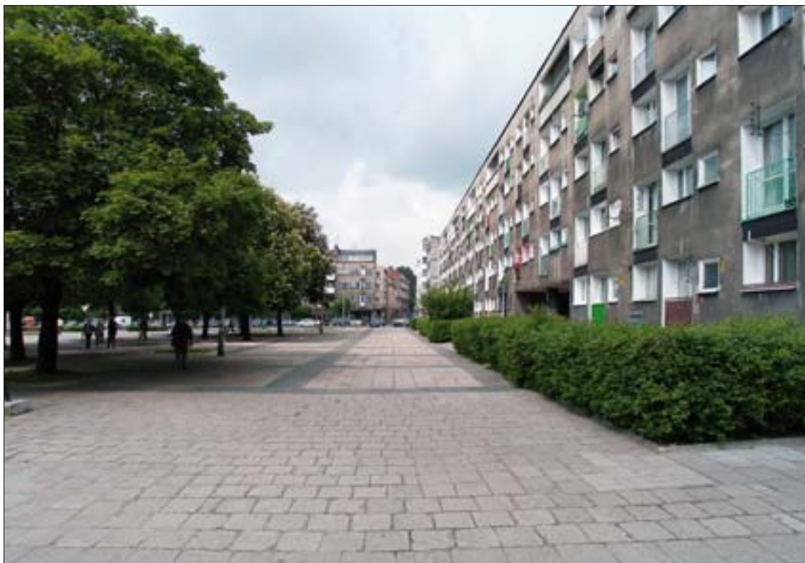
16. Widok wzdłuż pierzei północnej.

Jednym z bardziej charakterystycznych elementów zabudowy Nowego Targu były indywidualne cechy poszczególnych budynków, podkreślone dodatkowo przez nadane im nazwy: Fliegende Adler (Lecący Orzeł), Steinerne Bank (Kamienna Ławka), Kleine Christoph (Mały Krzysztof), Lange Holz (Długie Drewno), Schwarze Kraehe (Czarna Wrona), Der Wilde Mann und Mohr (Dziki Mąż i Murzyn) itp. 20 Posiadanie nazwy łączyło się z godłem; dwa z nich – figury św. Jana Chrzciciela i św. Jana Ewangelisty z ok. 1380 r., przechowywane są obecnie w Muzeum Narodowym we Wrocławiu, natomiast niemal wszystkie pozostałe znane są z ikonografii.