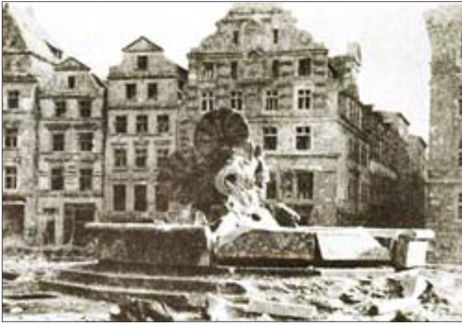
8. Zniszczona fontanna Neptuna. Fot. po 1945 r., za: http://wroclaw.hydral.com.pl .