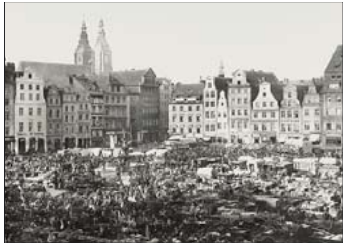
6. Widok na narożnik pd.-zach. pl. Nowy Targ z wylotem ul. Kotlarskiej. Fot. sprzed 1900 r., BUWr.

Mimo takiego stanowiska początkowo próbowano jednak w formach nowej architektury nawiązywać do dawnej zabudowy szczytowej, paradoksalnie nawet tam, gdzie tej zabudowy nie było. Wrocławskim przykładem tego typu myślenia była zabudowa placu Młodzieżowego (powstałe przez wyburzenia rozszerzenie północnej części ulicy Świdnickiej), zrealizowana w latach 1955-1956. „Antyhistoryczne” poglądy doprowadziły jednak wkrótce do całkowitego wycofania się z dotychczasowej praktyki rekonstrukcji obszarów staromiejskich i do wypełniania ich zupełnie nową architekturą, niebudującą żadnych skojarzeń historycznych. We Wrocławiu zwiastunem tego typu działań były bloki przy ul. Piotra Skargi i ul. Wierzbowej, powstałe w latach 1956-1958 (proj. Jadwiga Hawrylak-Grabowska) 3 . Wkrótce jeszcze bardziej „nowoczesna” architektura (galeriowce, punktowce, budynki z balkonami) zaczęła powstawać również na obszarach bliższych rynku wrocławskiego. W latach