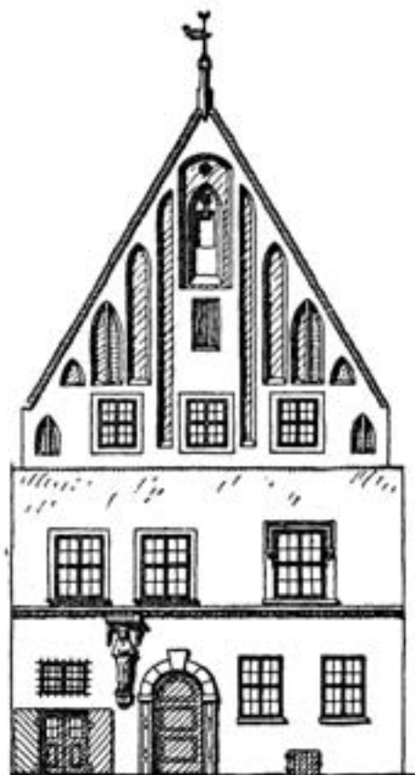
3. Dom pod Polskim Panem Bogiem, widok fasady, za: R. Stein, Das Breslauer Bürgerhaus , Breslau 1939. 3. House under the Polish Lord God, view of the facade, after: R. Stein, Das Breslauer Bürgerhaus , Breslau 1939.