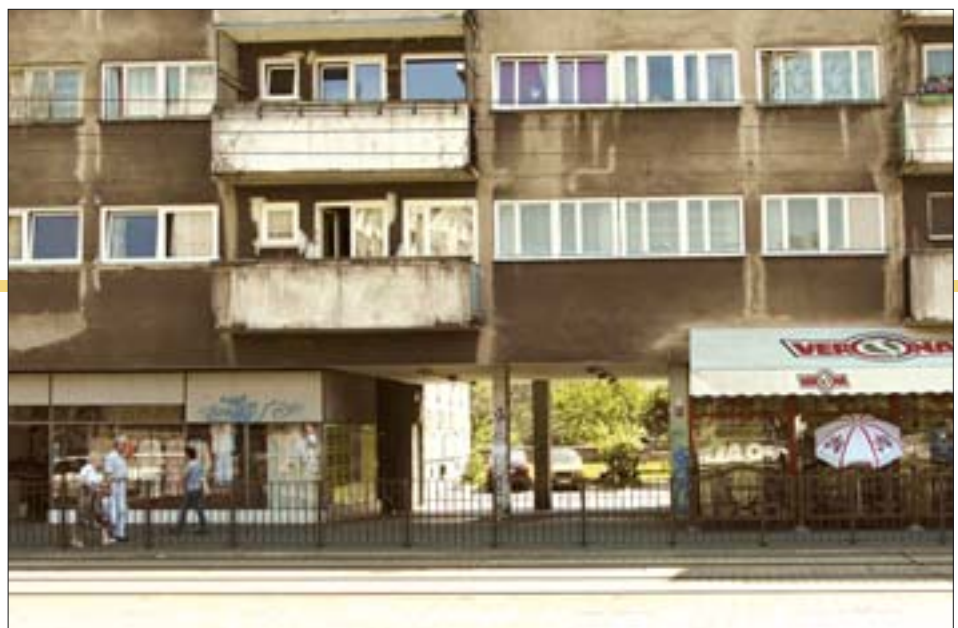
20. Fragment ul. św. Jadwigi. 20. Fragment of Św. Jadwiga Street.