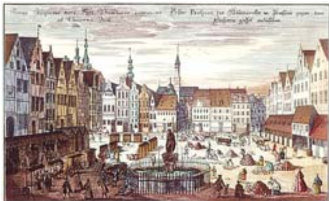
2. Widok na plac Nowy Targ od południa, akwaforta K. Remsharta wg. rys. F.B. Wernera, 1736 r., BUWr. 2. View of the Nowy Targ Square from the south, aquafort by K. Remshart, acc. to drawing by F.B. Werner, 1736, BUWr.

Ochrona miast zabytkowych to z jednej strony zachowywanie elementów stanowiących o ich wartościach historycznych, z drugiej zaś przyzwolenie na wprowadzanie nieuchronnych zmian. Jest to jednak przede wszystkim obrona praw harmonijnego rozwoju, określanego ostatnio mianem „zrównoważonego”. Troska o „rozwój zrównoważony” to zarówno utrwalanie ważnych etapów dziejów ośrodków miejskich, jak i stałe podkreślanie ich zmienności. Bogactwo kulturowej stratyfikacji miasta stanowi wartość samoistną, a jego ewolucja nie jest procesem jednokierunkowym.