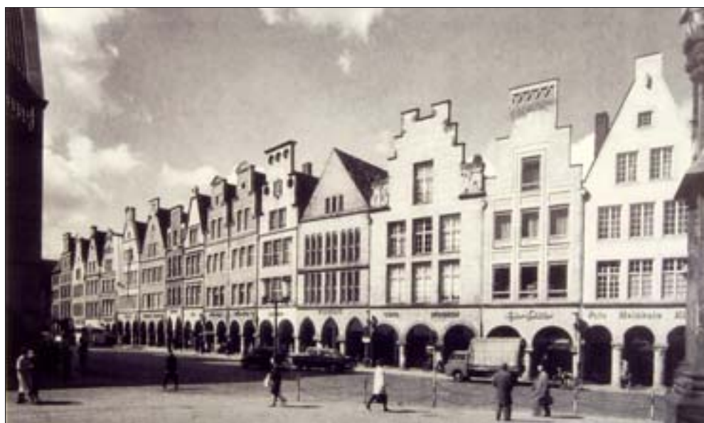
22. Uproszczona zabudowa szczytowa głównego rynku w Münster w Dolnej Saksonii powstała w dwóch etapach – w 1880 i 1962 r. Fot. archiwum R. Eysymontta.

Bardzo długie pierzeje budynków o uderzającej monotonii w pierzejach wschodniej i zachodniej przedłużają optycznie plac w stronę obszaru Wyspy Piaskowej. Dodatkowo horyzontalność ta wzmocniona jest przebiegiem linii tramwajowej. Sytuacja ta mogłaby się poprawić poprzez wprowadzenie mocniejszych podziałów akcentujących poszczególne parcele.