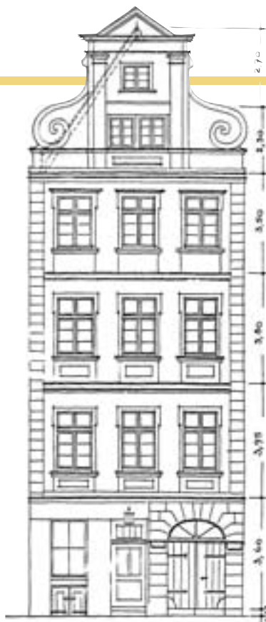
4. Pomiar barokowej elewacji budynku, pl. Nowy Targ nr 32, 1940 r., Archiwum Budowlane Miasta Wrocławia (dalej ABMWr). 4. Measurement of a Baroque elevation of 32 Nowy Targ Square, 1940, Construction Archive of the City of Wrocław (further as: ABMWr).

Niektóre etapy rozwoju miast nie tworzą wartości dających się obronić w dłuższym czasie. Czasami któryś z nich poddany jest regułom uwarunkowanym zewnętrznymi prawidłami, niedostosowanymi do danego obszaru, wyalienowanymi z ciągu rozwojowego, a czasem wręcz szkodliwymi (na pewnych etapach można mówić wręcz o regresie), przy czym ocena możliwa jest niekiedy dopiero po wielu latach. Często, aby odzyskać wartość zasadniczą, powinno się „cofnąć” jakiś etap rozwoju, usuwając któreś z nawarstwień. Działanie takie określić można mianem „sanacji z przywróceniem dawnych wartości”.