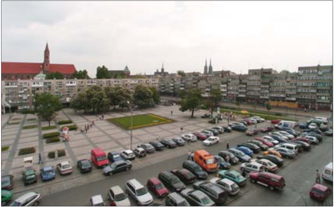
11. Perspektywa placu Nowy Targ w stronę pn.-wsch. Fot. R. Eysymontt, 2006 r. 11. Perspective of Nowy Targ Square towards the north-east. Photo: R. Eysymontt, 2006.

konieczne jest dokonywanie trudnych wyborów. Nie jest bowiem możliwe przyjęcie z góry założenia, że każdy z dawnych etapów rozwoju godny jest zachowania lub wręcz przywrócenia. Dotyczy to szczególnie tych części miasta, których formy i funkcje wybrane zostały w sposób arbitralny, często błędny, z pominięciem zasadniczych, funkcjonujących w danym miejscu jego cech konstytutywnych, określanych czasem mianem „semioforów” – nośników znaczeń. Jedynie obiektywna ocena owych elementów, stanowiących o wartościach funkcjonalnych i estetycznych danego obszaru, pozwala w całej pełni ujrzeć zasadnicze, ukształtowane w toku rozwoju historycznego wartości danego rozwiązania urbanistycznego.