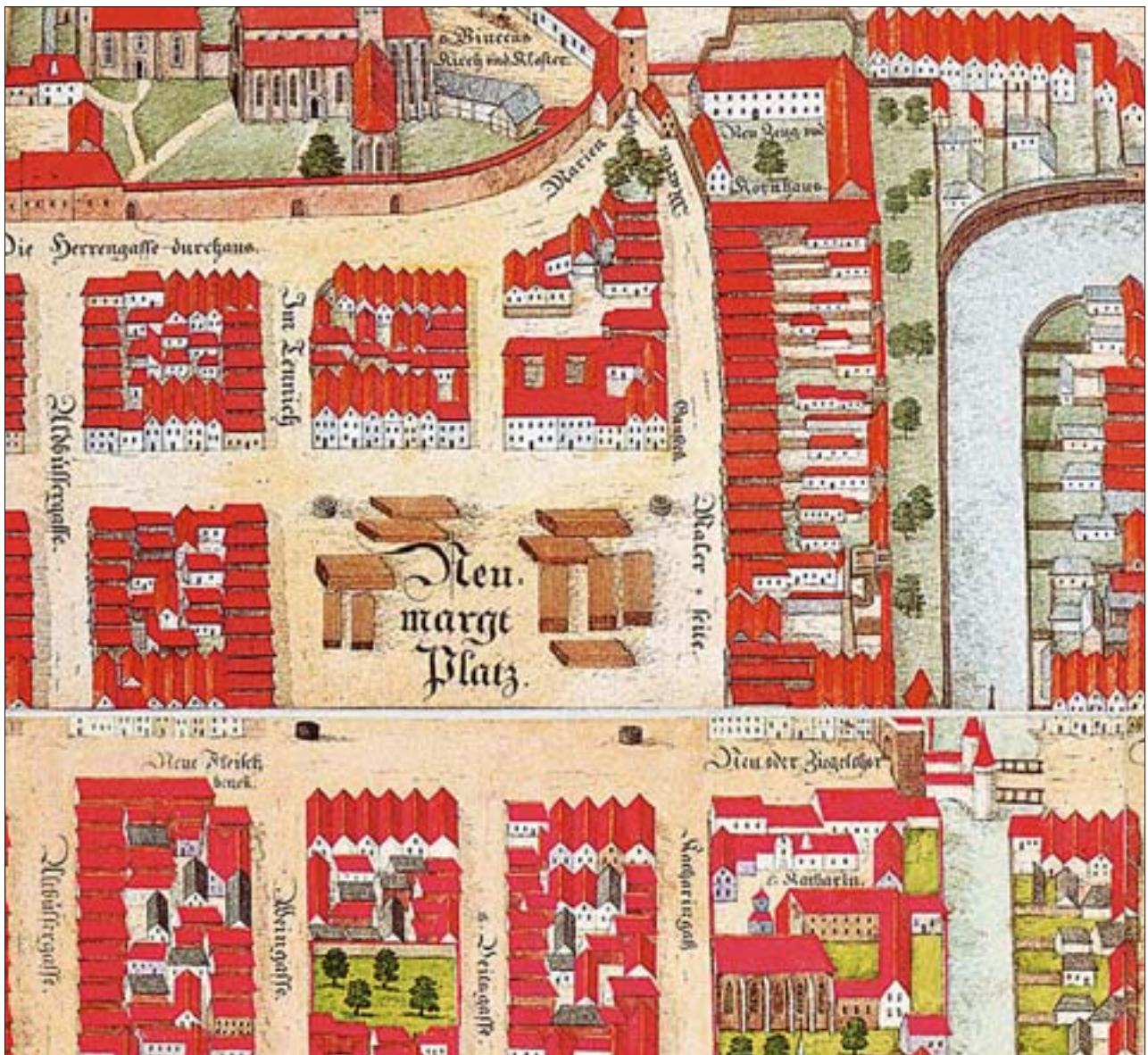
1. Fragment planu widokowego B. Weinerja z 1562 r. Na płaszczyźnie placu przedstawiono stopy desek, a w czterech narożnikach stągwie z wodą, niezbędne ze względu na bezpieczeństwo pożarowe.

kłóskach, uzupełniano w nich straty wynikające ze zniszczeń wojennych i konfliktów, dostosowywano budynki do nowych potrzeb, modernizowano infrastrukturę. W rezultacie forma poszczególnych części miasta jest odzwierciedleniem etapów jego rozwoju.