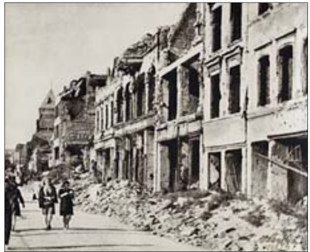
10. Pierzeja wschodnia pl. Nowy Targ, po 1945, za: I. Rutkiewicz, Wrocław wczoraj i dziś , Warszawa 1973.

Trzeba jednak przypomnieć, że działania takie od początku spotykały się z poważną krytyką, której przejawem była m.in. dyskusja na łamach pisma „Architektura” (1966-1967) na temat „odbudowy” centrum Legnicy, która w istocie rzeczy polegała na rozbiórce budowli zabytkowych i przekształceniu tej części miasta w standardowe osiedle mieszkaniowe. Na początku lat 80. XX w. zespoły zabudowy wielkopłytywowej w obszarach staromiejskich przestały satysfakcjonować środowiska opiniotwórcze. Wystarczy zacytować memoriał Stowarzyszenia Historyków Sztuki z 1986 r. o stanie zabytków na Dolnym Śląsku: „Część z nich [zespołów staromiejskich], choć stosunkowo nieznaczna, uległa zniszczeniom wojennym. Zasięg szkód nie upoważniał jednak do masowego wyburzania obiektów zabytkowych i zastępowania ich niestosowną i bezzwzględną zabudową