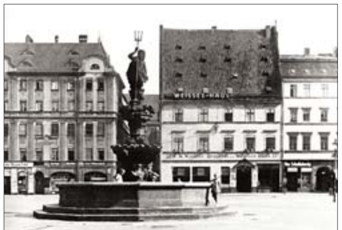
7. Fontanna Neptuna na tle pierzei północnej pl. Nowy Targ. Fot. z lat 20. XX w., za: H. Trierenberg, Heimat Breslau , Mannheim 1980.

Zwieńczeniem tych działań była zabudowa obszaru wokół Nowego Targu (od 1961 r.). Cechą charakterystyczną wznoszonych budowli, poza formą odbiegającą od historycznej, było zastosowanie nowoczesnych na owe czasy technik (wielki blok i wielka płyta) i materiałów wykończeniowych (betonowe tynki, wykładziny z kamienia polnego i ceramicznej mozaiki, eternitowe dachy). Niektóre z wprowadzonych elementów były sprzeczne z obowiązującym we Wrocławiu od kilkuset lat prawem budowlanym – pojawiły się zakazane wcześniej balkony, wykusze