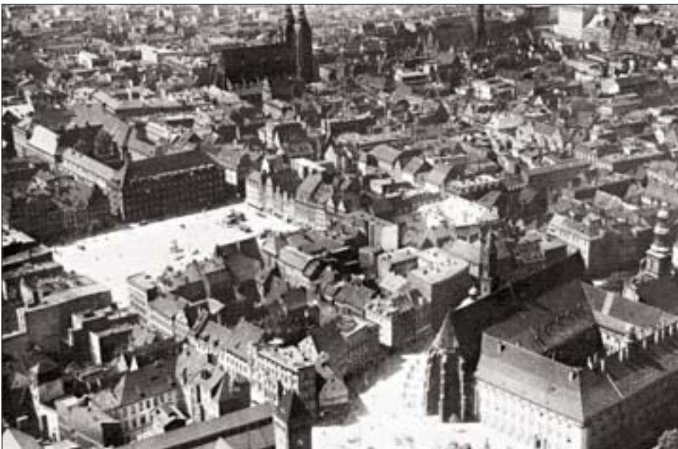
12. Zdjęcie lotnicze z lat 30. ub.w. 12. Aerial photograph from the 1930s.

Warto zastanowić się, jaką nową wartość społeczną wytworzył w powojennym Wrocławiu plac Nowy Targ? Jakie zachowania społeczne przestrzeń ta wykreowała? Według naszej obserwacji nie są to obecnie wartości i zachowania charakterystyczne dla