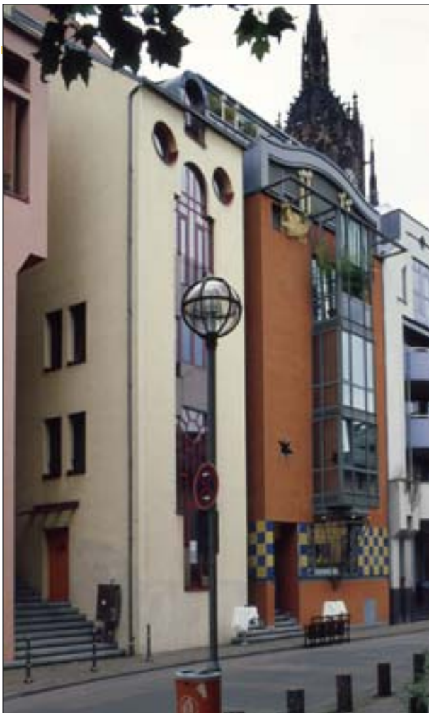
19. Postmodernistyczna zabudowa nawiązująca do historycznej zabudowy szczytowej. Frankfurt nad Menem, Saalgasse, między katedrą i ratuszem. Architekci: Bangert, Jansen, Scholz, Schultes. 19. Postmodernist housing referring to historical gable construction. Frankfurt on the Main, Saalgasse, between the cathedral and the town hall. Architects: Bangert, Jansen, Scholz, Schultes.

Zagospodarowania Wrocławia, którego pierwsza koncepcja została zaprezentowana w 1949 r. 25 Po likwidacji biura studia do planów szczegółowych wykonywał w latach 1950-1953 zespół kierowany przez Emila Kaliskiego. Dla placu Nowy Targ przewidziano