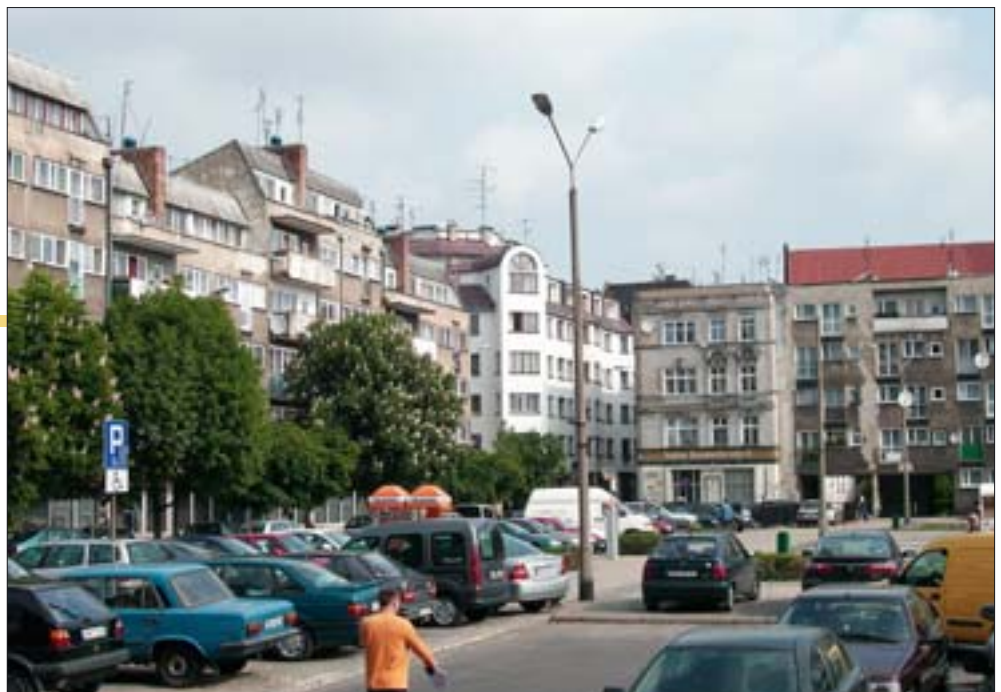
14. Narożnik pn.-zach. placu. Fot. R. Eysymontt, 2006 r. 14. North-western corner of the square. Photo: R. Eysymontt, 2006.

Jedną z najważniejszych wad obecnej formy Nowego Targu jest jego monotonia, wynikająca z jednolitości czasu powstania. Jeden z najważniejszych powojennych teoretyków i praktyków urbanistyki, Wacław Ostrowski, o tym zjawisku pisał następująco: „Od odległej przeszłości aż po nasze czasy, niezliczeni autorzy krytykowali miasta wybudowane nadmiernie regularnie i sprawiające w związku z tym wrażenie nudnej monotonii”. Autor powoływał się tu na Marca-Antoine’a Laugiera (1713-1769), który z kolei pisał o „mdeł dokładności i zimnej jednostajności, które powodują, że żałujemy nieporządku dawnych miast” 9 . Wacław Ostrowski sądził, że „łączenie symetrii z różnorodnością, operowanie kontrastem, nawet nieporządkiem ma jeszcze i to ogromne znaczenie dla formowania krajobrazu miejskiego, że pozwala uwypuklić budynki lub wnętrza szczególnie ważne, których regularność przeciwstawiana jest otaczającemu je nieładowi” 10 .