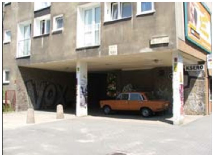
18. „Podcienie” w narożniku pn.-wsch. Fot. Ł. Krzywka, 2006 r. 18. “Arcades” in the south-eastern corner. Photo: Ł. Krzywka, 2006.

W marcu 1946 r. powstało Biuro Planu Wrocławia, kierowane przez Tadeusza Ptaszyckiego, którego zadaniem było opracowanie koncepcji rozwoju i zagospodarowania przestrzennego miasta. W biurze tym od jesieni 1948 r. opracowywano Generalny Plan