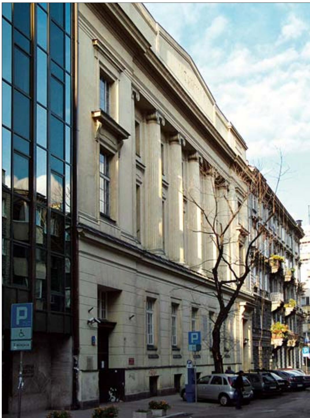
14. Fasada gmachu głównego biblioteki, 2005 r. 14. Facade of the main Library building, 2005.

ograniczona jest powierzchnią niewystarczającą dla tak dużej instytucji publicznej. Dlatego, mimo licznych niepowodzeń, na które wskazuje dotychczasowa historia, do dziś nie zrezygnowano ze starań o możliwość jej rozbudowy i modernizacji.