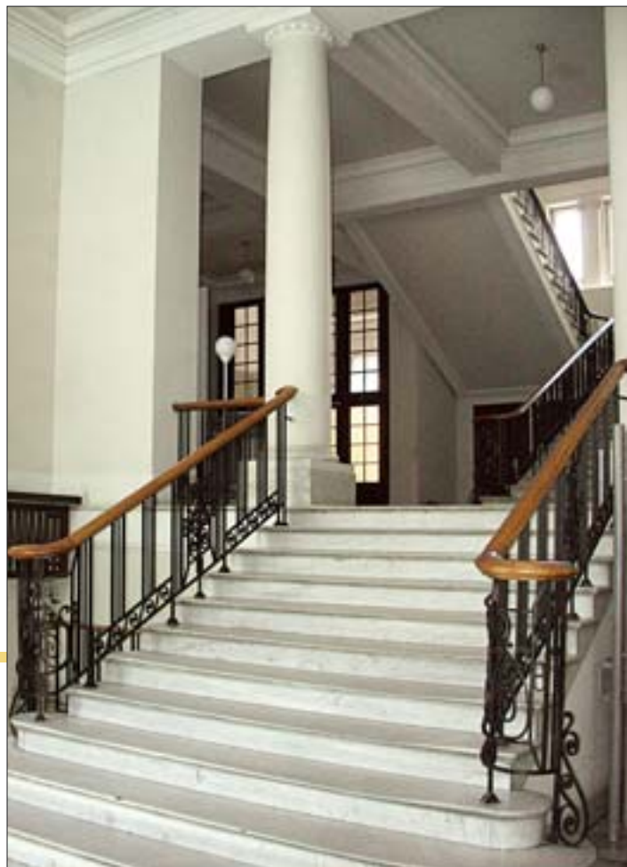
13. Fragment holu parteru i galerii I piętra gmachu głównego, 2005 r. 13. Fragment of the ground-floor hall and the first-floor gallery in the main building, 2005.