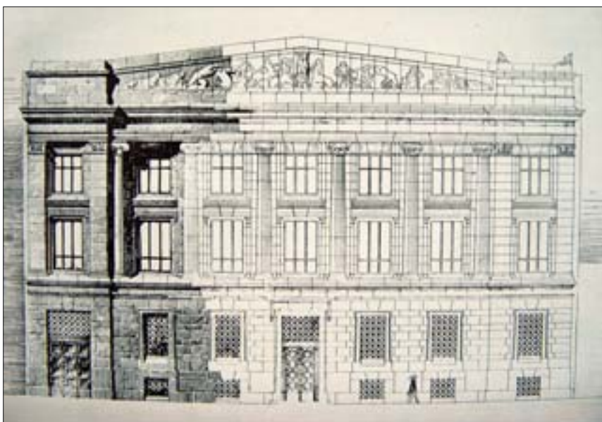
3. Pierwotny projekt fasady biblioteki, Jan Heurich junior, ok. 1912 r. Repr. za: S. Noakowski, Jan Heurich jako architekt-artysta „Architektura i Budownictwo”, 1926, nr 12, s. 17.

mieszkania tego prowadziło oddzielne wejście z przejazdu bramnego, usytuowanego w zachodnim narożniku gmachu. Składało się ono z niewielkiego salonu, kuchni, pomieszczenia dla służącej, jadalni, sypialni, łazienki, gabinetu oraz kancelarii. Część pomieszczeń znajdowała się w trakcie tylnym i łączniku. Gabinet dyrektora miał bezpośrednie połączenie jedynie z kancelarią biblioteki, a od części magazynów oddzielał je drugi z przejazdów, prowadzący na podwórze-studnię.