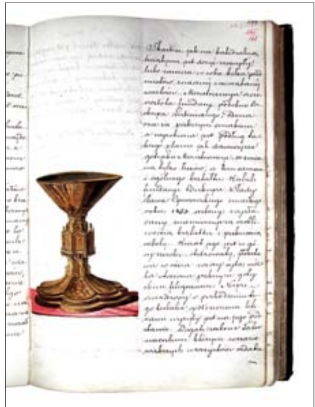
6. Karta z Opisów Zabytków Starożytności w Gubernii Warszawskiej , rysunek na marginesie – kielich fundacji biskupa Władysława Oporowskiego w katedrze we Włocławku. Gab. Ryc. BUW.

5. Title page of Opisy Zabytków Starożytności w Gubernii Warszawskiej (Descriptions of Antiquities in the Warsaw Gubernia), 1851. Gab. Ryc. BUW.