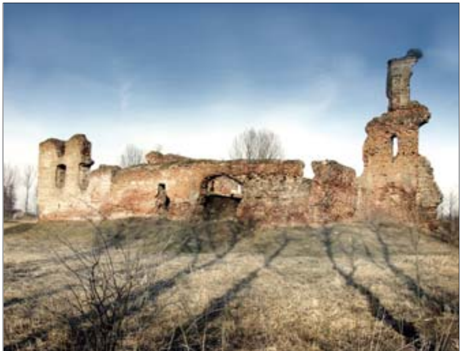
17. Besiekiery, zamek. Fot. W. Stepień, 2003 r.