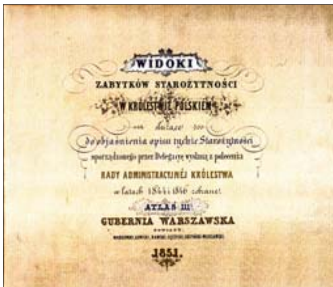
7. Karta tytułowa Widoków Zabytków Starożytności w Królestwie Polskim. Atlas III. Gubernia Warszawska, 1851 r.