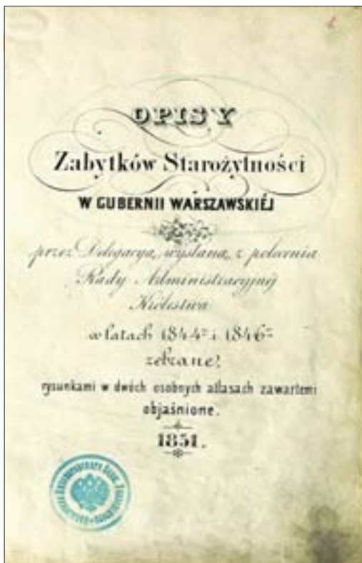
5. Karta tytułowa Opisów Zabytków Starożytności w Gubernii Warszawskiej , 1851 r. Gab. Ryc. BUW.

5. Title page of Opisy Zabytków Starożytności w Gubernii Warszawskiej (Descriptions of Antiquities in the Warsaw Gubernia), 1851. Gab. Ryc. BUW.