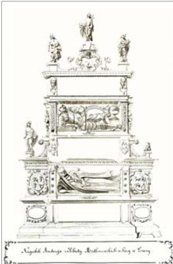
26. Łomża, nagrobek Andrzeja i Elżbiety Modliszewskich w farze (ob. katedrze), rys. D. Jastrzębowski, 1851, Atlas VII. Gubernia Augustowska , tabl. 50. Gab. Ryc. BUW.

26. Łomża, gravestone of Andrzej and Elżbieta Modliszewski in the parish church (today: cathedral), drawing: D. Jastrzębowski, 1851, Atlas VII. Gubernia Augustowska (Atlas VII. Augustów Gubernia), table 50. Gab. Ryc. BUW.