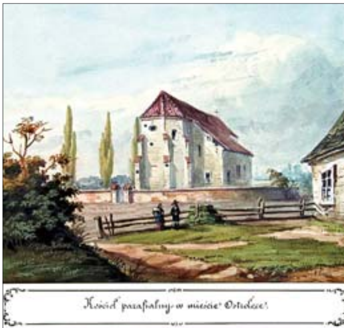
Кościół parafialny w mieście Ostrołęce.

18. Ostrołęka, kościół parafialny, rys. A. Lerue, 1851, Atlas IV. Gubernia Płocka , tabl. 71. Gab. Ryc. BUW.