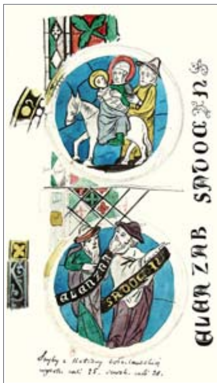
3. Rysunek witraży w katedrze we Włocławku w Pamiętniku Kazimierza Stronczyńskiego, s. 55.

W okresie powojennym, dzięki zbiorowemu wysiłkowi historyków sztuki, a przede wszystkim Instytutowi Sztuki Polskiej Akademii Nauk, inwentaryzacja zabytków w Polsce była kontynuowana. Obecnie zbliża się ku końcowi. Zaistniały więc warunki do pełnej oceny dzieła, dokonania