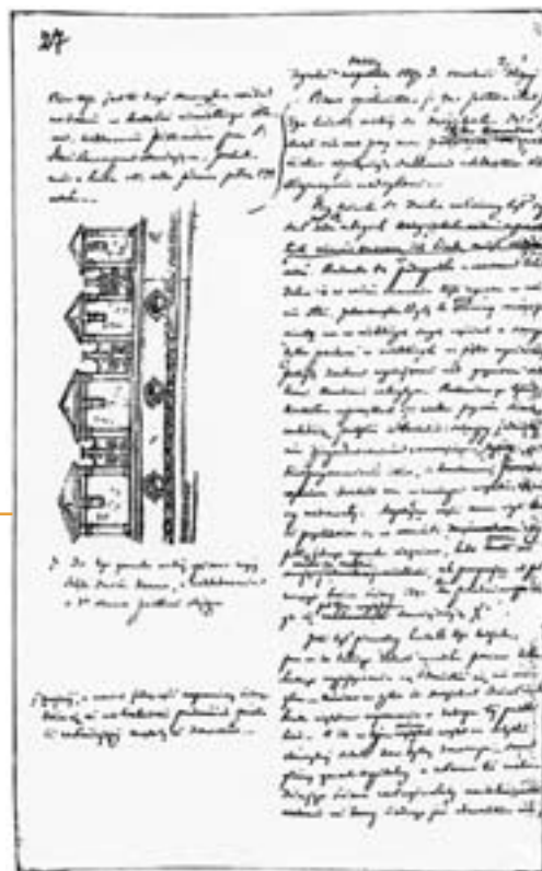
4. Brulion Lubelski , drawing of an attic in the Holy Ghost Hospital in Lublin, p. 27. Archive in Piotrków.