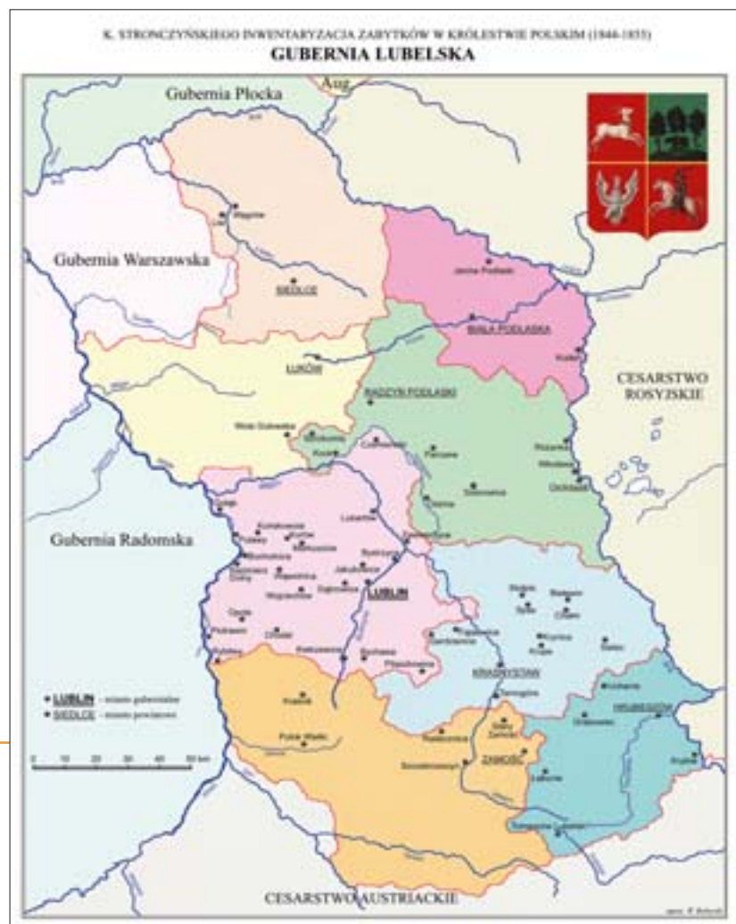
28. Mapa Guberni Lubelskiej z rozmieszczeniem zabytków. Oprac. W. Boberski. 28. Map of historical monuments in the Lublin gubernia. Prep. by W. Boberski.

20. S. Michalczuk Brulion Lubelski Kazimierza Stronczyńskiego , (w:) W kręgu badań nad sztuką polską. Studia z historii sztuki i kultury , red. K. Majewski, Lublin 1983, s. 113-119, il. 98-110.