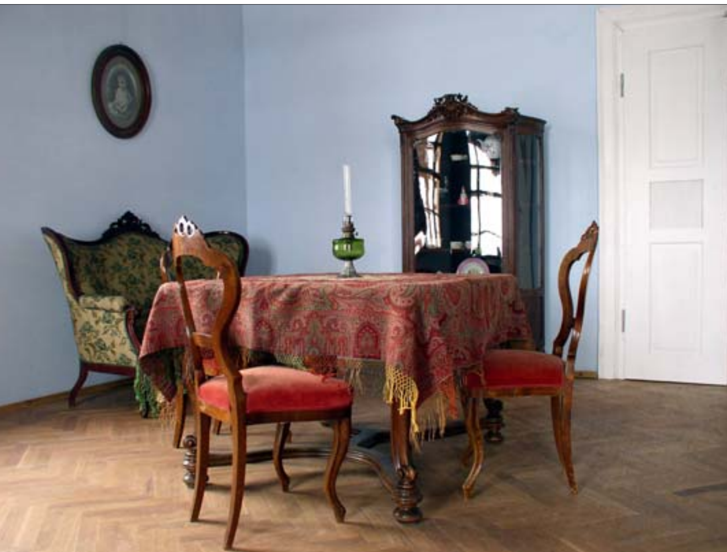
7. Dwór z Drogini, ekspozycja wnętrz, pokój pani urządzonej w stylu Ludwika Filipa.

7. Manor house from Droginia, exposition of the interiors, room of the lady of the house arranged in the Louis Philippe style.