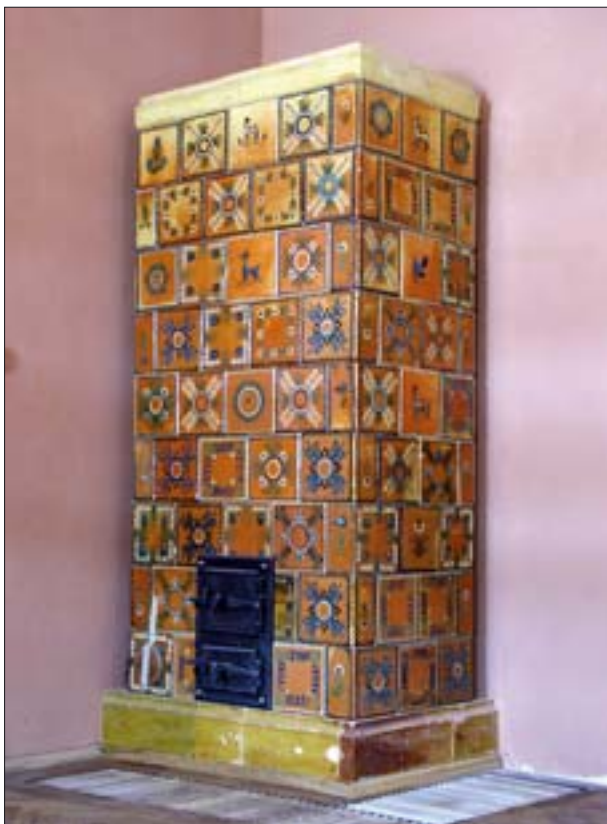
8. Dwór z Drogini, ekspozycja wewnątrz, malowany piec w gabinecie pana.

Ekspozycja muzealna ogranicza się do ukazania najważniejszych funkcji dworu jako domu mieszkalnego wielopokoleniowej rodziny i centrum zarządzania majątkiem. Zaprezentowano salon, gabinet pana, pokój pani, pokój ciotki rezydentki