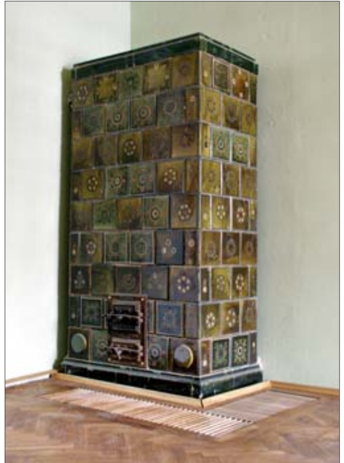
9. Dwór z Drogini, ekspozycja wewnątrz, malowany piec w sypialni.

8. Manor house from Drogini, exposition of the interiors, painted stove in the room of the lord of the manor.