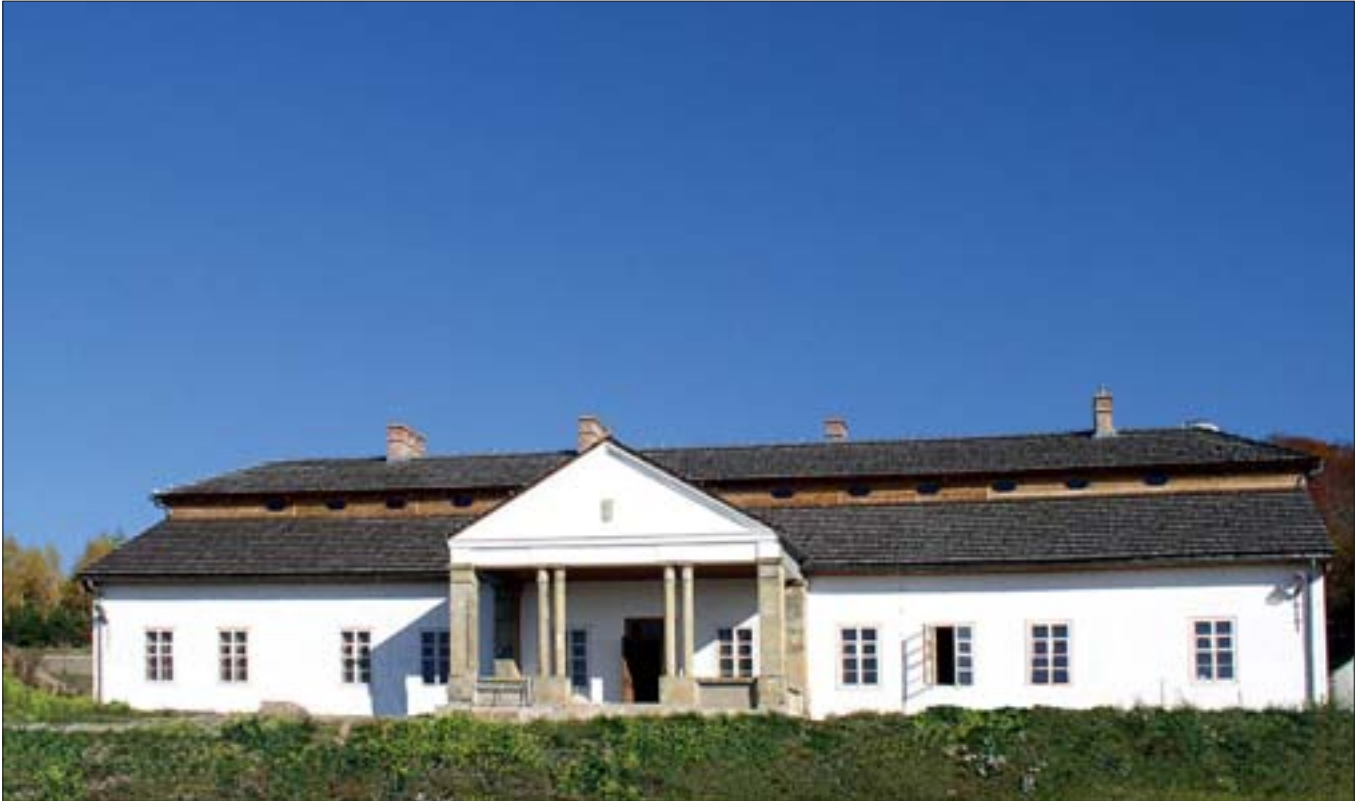
11. Dwór z Drogini w Nadwiślańskim Parku Etnograficznym w Wygielzowie, stan po bieleniu elewacji. 11. Manor house from Droginia in the Vistula Ethnographic Park in Wygielzow, state after whitewashing the elevationi.

po wyczerpaniu rezerw pod zabudowę kubaturową, wokół dworu możliwa jest jedynie rekonstrukcja obiektów małej architektury: kapliczki, altany ogrodowej, studni dworskiej. W planach zakłada się powiększenie terenu o przylegające do NPE grunty, co umożliwiłoby rozbudowę założenia dworskiego o zespół budynków folwarcznych.