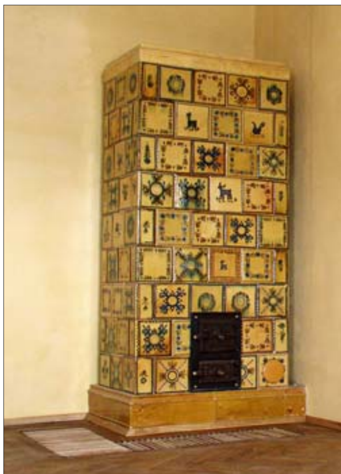
10. Dwór z Drogini, ekspozycja wewnątrz, malowany piec z kafla drogińskich w salonie.