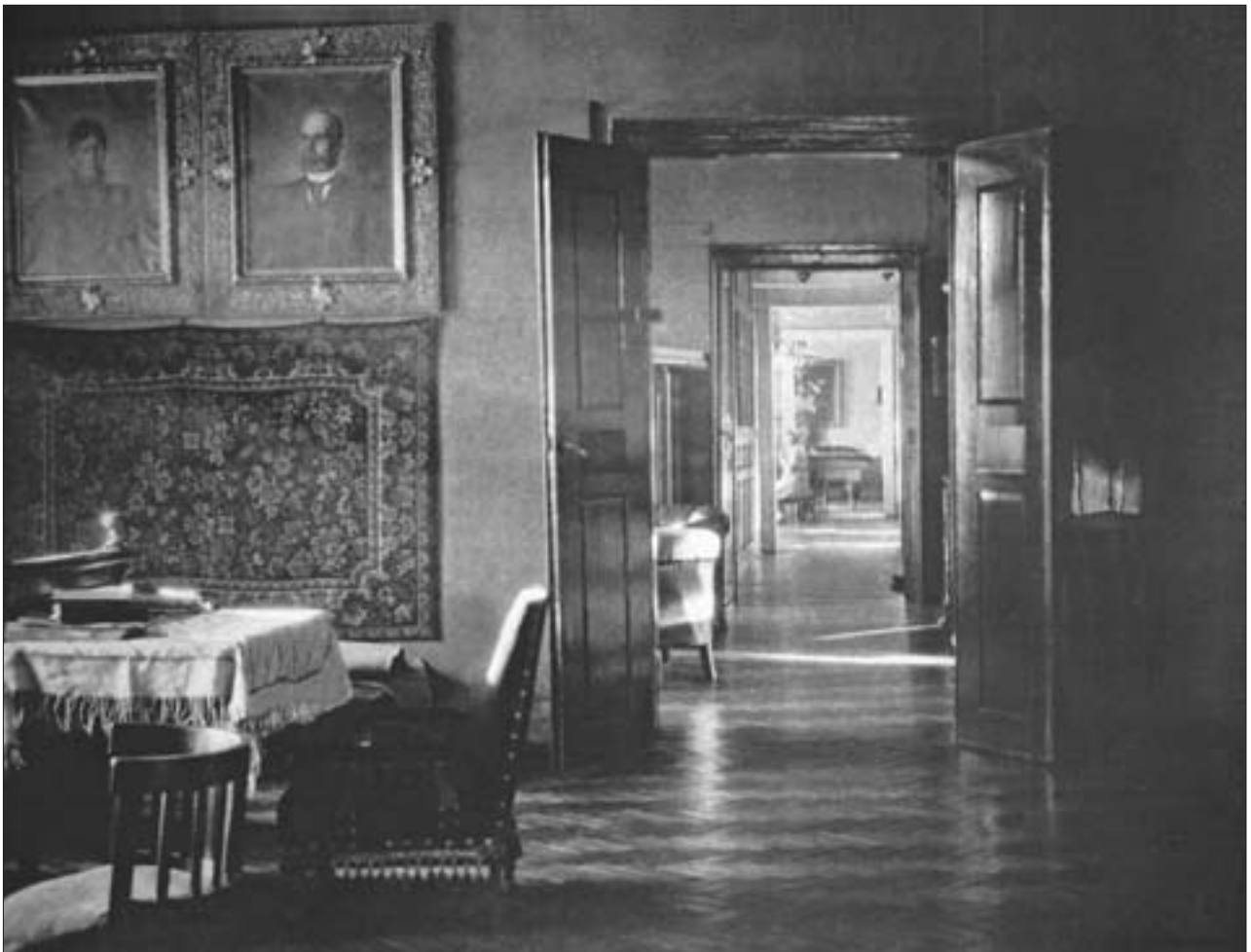
5. Dwór w Drogini, amfilada pokoi, stan przed 1939 r.

poziome szlaki, oddzielające ścianę od partii sufitowej. Bogactwem dekoracji wyróżniał się salon, w którym dostrzegamy lamperię podkreśloną ciemniejszą linią oraz znajdujący się powyżej poziomy fryz z motywem meandra. Nad drzwiami widoczne są zarysy malowanych supraport – płycin dekoracyjnych. Utrwalone na zdjęciach fragmenty wyposażenia salonu to jeden z portretów w bogatej ramie zdobionej plastycznym ornamentem kwiatowym, niewielki okrągły intarsjowany stolik biedermeierowski oraz fotel z kanapą obite wzorzystą tapicerką. Wnętrze oświetlał wiszący świecznik. W pokoju białardowym większość miejsca zajmował masywny stół białardowy wsparty na czterech tralkowych nogach. Na ścianach wisiały portrety o różnych formatach. Wyposażenie dopełniały ładne krzesła w stylu biedermeier, także kanapka i stolik prostokątny. W narożniku znajdował się trudny do identyfikacji stylowej kątowny kredensik. Pokój oświetlały lampy naftowe – wisząca i stojąca,