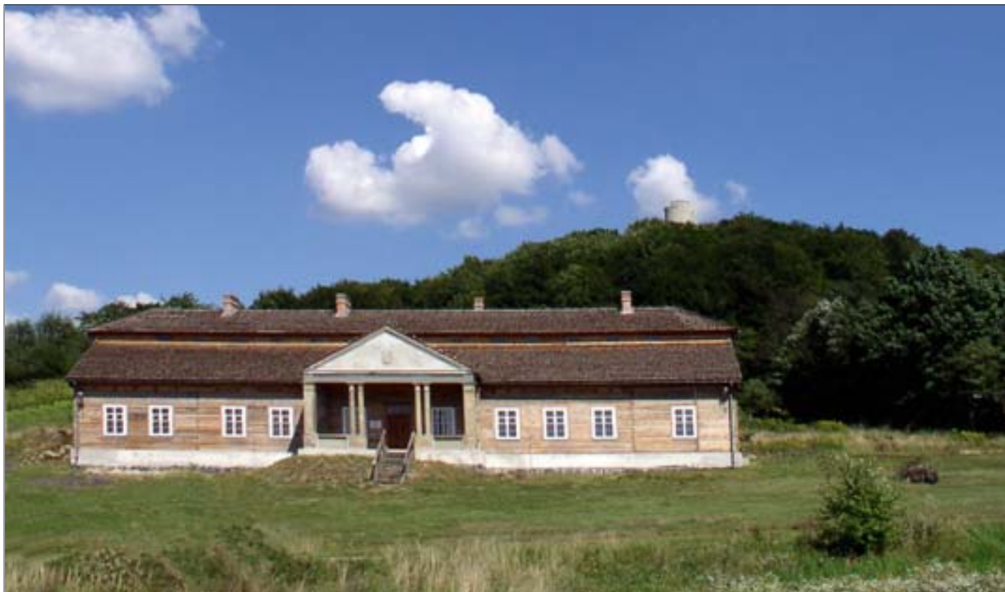
1. Dwór z Drogini w Nadwiślańskim Parku Etnograficznym w Wygieźlowie, stan z 2006 r., podczas prac rekonstrukcyjnych. W tle zamkowe wzgórze z widoczną wieżą zamku Lipowiec.