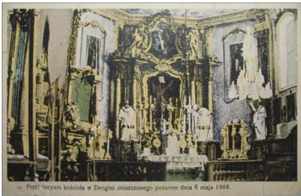
2. Wnętrze drewnianego kościoła w Drogini, rokokowy wystrój ścian, zapewne analogia do dworskich boazerii. Pocztaówka z ok. 1910 r. 2. Interior of a wooden church in Drogini, with Rococo walls probably designed as an analogy to the manorial paneling. Postcard from about 1910.

Brzechwów z 2. poł. XVII w. udokumentowany jest w stanie częściowej dewastacji, w jakiej znalazł się w początkach XVIII w. 8 Drewniany, barokowy dwór Adama Jordana, wzniesiony w 1730 r., przetrwał w zrębie ścian do XX w. Wiek XIX i XX, okres władania drogińskimi dobrami przez Dąbskich (po 1760-ok. 1866) i Bzowskich (ok. 1866-1945), to czas etapowej rozbudowy i modernizacji rezydencji (il. 3). Lata powojenne przyniosły bezzmyślną eksploatację i doraźne próby adaptacji budynku na potrzeby różnych użytkowników. Stan ten dobrze oddaje zdanie z protokołu komisji konserwatorskiej z 1954 r.: „stwierdza się, że dotychczasowy użytkownik (Gminna Spółdzielnia Samopomoc Chłopska – przyp. aut.) nie uczynił najbardziej elementarnej konserwacji dla zabezpieczenia majątku” 9 . Kres istnienia dworu nastąpił w roku 1985. W związku z budową dobczyckiego zbiornika wodnego budynek uległ rozbiórce. Elementy konstrukcyjne i detale wyposażenia zostały doraźnie zabezpieczone i złożone w pobliskich Osieczanach, gdzie na terenie miejscowego zakładu produkcyjnego „Unitra”, dwór miał być odtworzony i adaptowany na ośrodek recepcyjny 10 . Krach gospodarczy końca lat 80. ub.w. plany te uczynił nierealnymi. W roku 1996 Muzeum w Chrzanowie dokonało zakupu dworu z Drogini z zamiarem jego odbudowy w Nadwiślańskim Parku Etnograficznym w Wygielzowie. Pod pojęciem dworu skrywały się wówczas luźne, drewniane elementy konstrukcyjne ścian i stropów, stolarka okienna i drzwiowa oraz kamienny portyk filarowo-kolumnowy