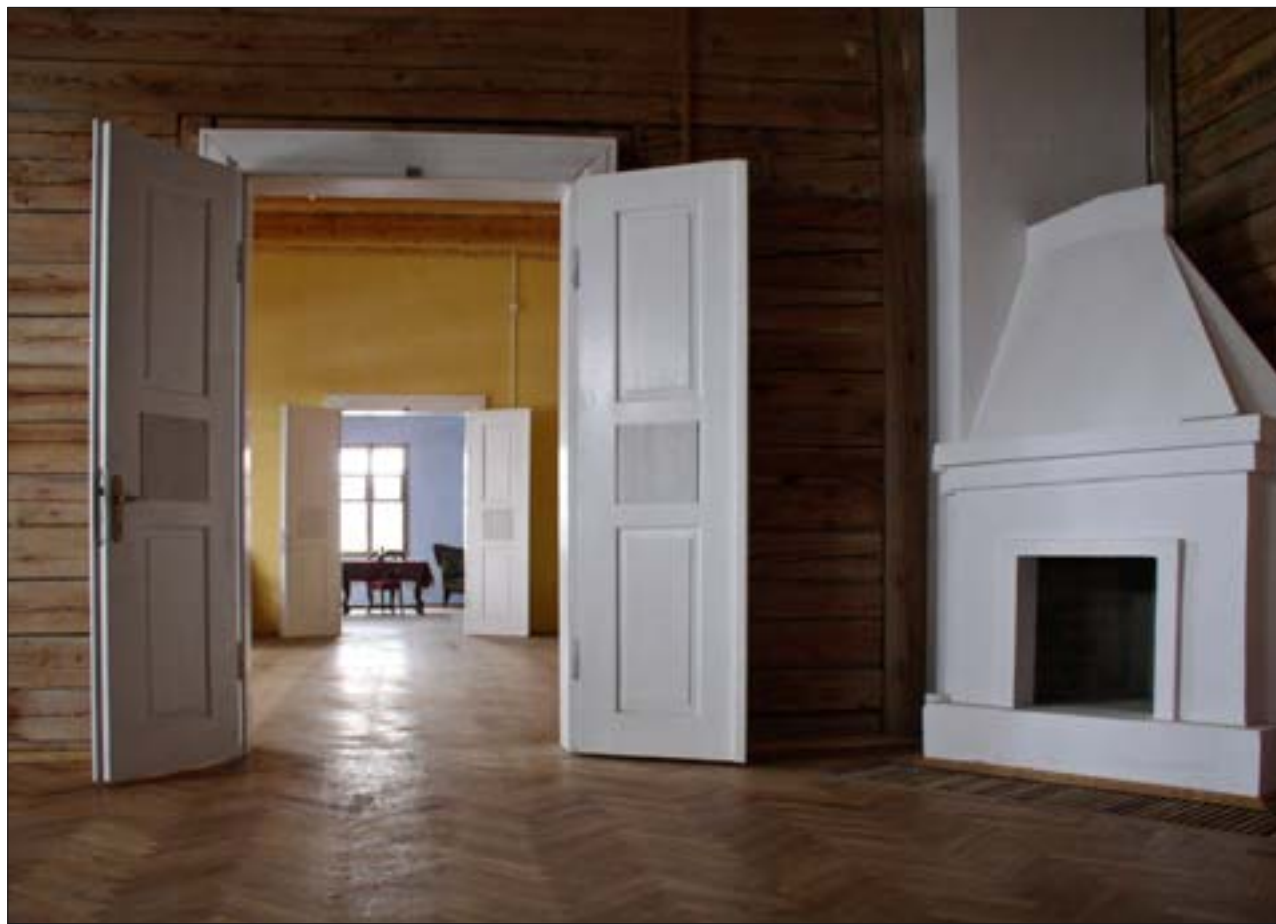
6. Dwór z Droginia, ekspozycja wewnątrz, widok z sieni na muzealną część we frontowym traktie dworu.

6. Manor house from Droginia, exposition of the interiors, view from the hallway of the museum part in the front.