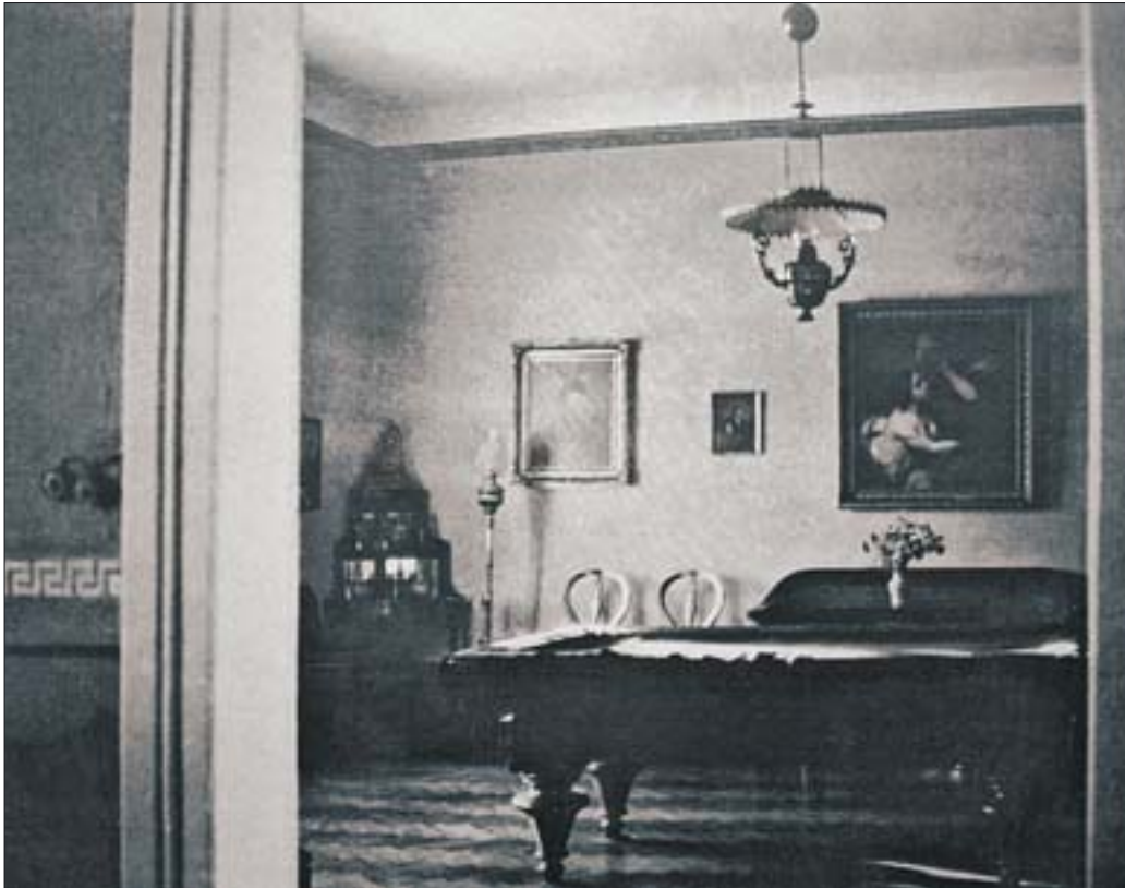
4. Dwór w Drogini, pokój bilardowy, stan przed 1939 r. 4. Manor house in Drogini, snooker room, state prior to 1939.

Wspomniano drzwi „taflowane” czarne i czerwone oraz „drzwi drewniane”. Z cennych elementów wyposażenia dostrzeżono dziewięć obrazów umieszczonych na ścianach trzech pomieszczeń. Wszystkie o tematyce religijnej, w ozdobnych ramach. W dyspozycji wnętrz wyróżniono sień, „Wielką Izbę Stołową”, około siedmiu pokoi, bibliotekę, apteczkę, spiżarnię oraz dwie komory bez okien. Piwnica pod częścią dworu oraz poddasze z izdebką w szczycie ganku dopełniały funkcjonalny układ pomieszczeń 12 . Można przypuszczać, że dwór powstały w 1730 r., rezydencja Adama Jordana, przewyższała okazałością i jakością artystyczną starszą budowlę z czasu Brzechwów. Z Adamem Jordanem należy łączyć rokokowe detale wystroju dworu, wspomniane w Katalogu zabytków sztuki – boazerię w jednym z pomieszczeń i troje drzwi oraz znany z fotografii rokokowy piec kaflowy 13 . Są to jedyne odnalezione dotąd dane odnoszące się do wyposażenia dworu z tego okresu. Można przypuszczać, że wnętrza były utrzymane w jednolitym stylu i mogły przedstawiać się dość bogato. Tezę tę mogą potwierdzać dwie ilustracje przedstawiające wnętrze spalonego w 1908 r. drewnianego kościoła w Drogini, fundowanego przez Adama Jordana 14 . Na fotografii publikowanej przez A. Mysińskiego 15 oraz na niepublikowanej