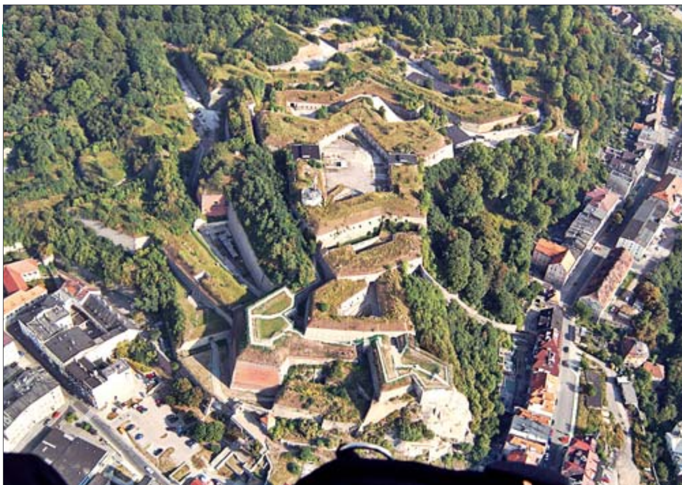
7. Twierdza Główna. Część sąsiadująca z miastem udostępniona turystycznie. Skazamatowany, wieloboczny Donżon, częściowo przebudowany przez zakład przemysłowy – stropodachy w miejscu pierwotnych sklepień i wałów ziemnych. 7. Main Fort. Part adjoining the town open to tourists. Multi-sided donjon with casemates, partially rebuilt by an industrial plant – flat roofs in place of the original ceilings and earth mounds.

konferencja naukowa pt. „Nowożytny fortyfikacje Śląska: Kłodzko, Srebrna Góra”. Na wniosek Gminy Miejskiej wpisano fort Owcza Góra do rejestru zabytków. Gmina wystąpiła do wojewódzkiego konserwatora zabytków o aktualizację wpisu (z 1960 r.) do rejestru zabytków Twierdzy Głównej – w zakresie ustalenia granic wpisu. Nawiązano współpracę z gminą Stoszowice, która w 2002 r. utworzyła pierwszy w Polsce park kulturowy Twierdzy Srebrnogórskiej. Trwały prace nad projektem uchwały o utworzeniu parku – już na podstawie obecnej Ustawy o ochronie zabytków i opiece nad zabytkami. Jednocześnie czyniono usilnie starania o przejęcie części poprzemysłowej, które jednak były torpedowane przez syndyka masy upadłościowej, podejmującego próby sprzedaży nieruchomości w drodze licytacji.