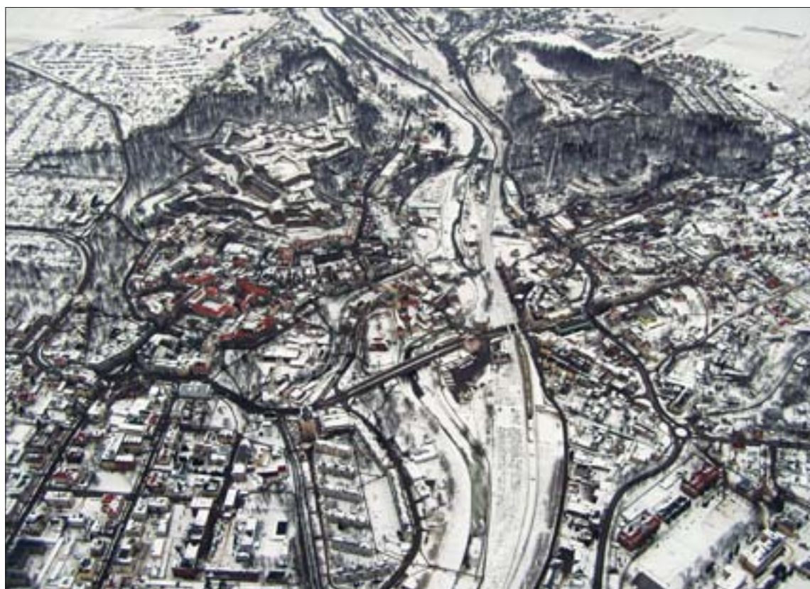
3. Kłodzko z lotu ptaka. Twierdza Główna i fort Owcza Góra. Fot. Urząd Miasta w Kłodzku. 3. Bird's eye view of Kłodzko. Main Fort and Fort Mt. Owcza. Photo: Town Council in Kłodzko.

Do najważniejszych prac w tym zakresie należały: rozbiórka zamków i budowa w ich miejscu wielobocznego Donżonu, budowa bastionów osłaniających Donżon od południa oraz znaczna rozbudowa fortu Owcza Góra (fosa, drogi ukryte, lunety, koszar). Późniejsze projekty, realizowane tylko częściowo, nie wpłynęły na ostateczny kształt fortyfikacji. Na zboczach obu twierdz wzniesiono pochylnie służące