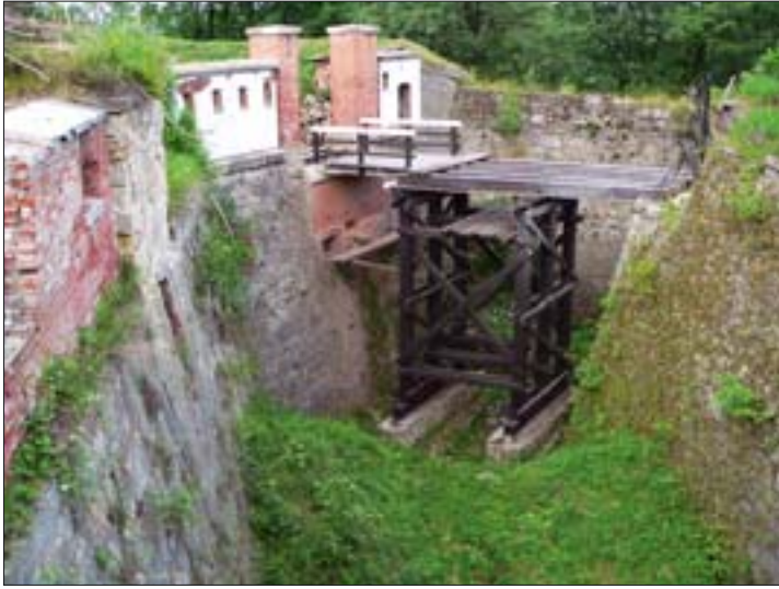
8. Twierdza Główna, most zwodzony rekonstruowany przez stowarzyszenie Akademia Przygody.

8. Main Fort – drawbridge reconstructed by the Adventure Academy Society.