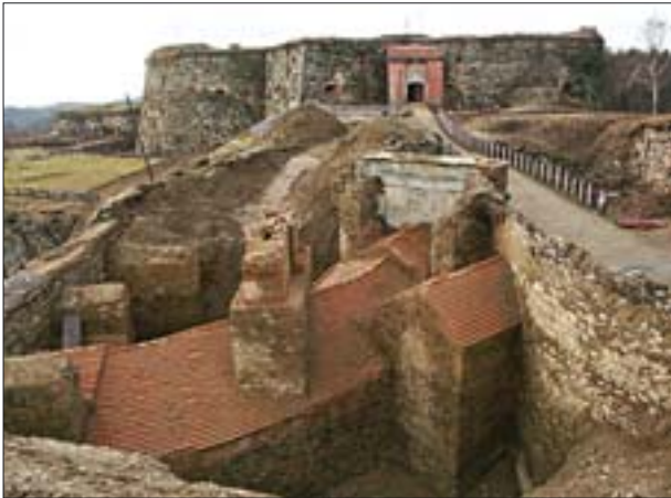
10. Twierdza Srebrna Góra. Donżon i prace konserwatorskie przy bramie i poternie Bastionu Niskiego. 10. Fort Mt. Srebrna. Donjon and conservation of the gate and Niski (Low) Bastion passage.

Main Fort, built after redesigning and partially pulling down the earlier fortifications. An auxiliary fort with the outline of a hexagonal, irregular star was erected on Owcza Hill.