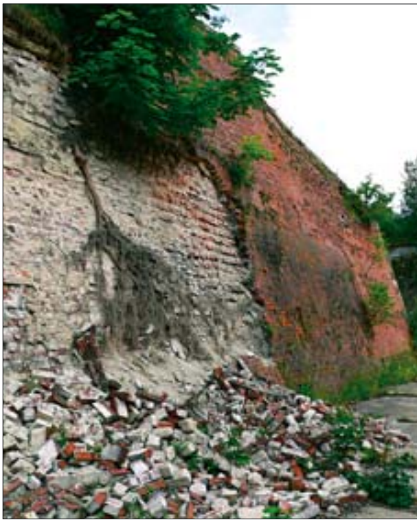
5. Twierdza Główna. Zniszczenie muru rawelinu przez dziką roślinność. 5. Main Fort. Ravelin wall damaged by wild plants.

zarządzał zabytkowym zespołem. Do zadań zarządcy miały zatem należeć ochrona wartości kulturowo-przyrodniczych oraz działalność komercyjna.