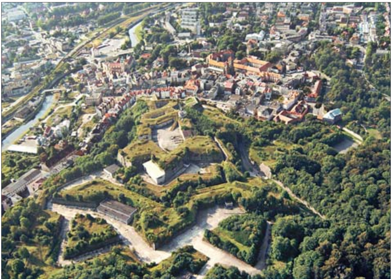
6. Twierdza Główna. Widoczne współczesne obiekty wzniesione przez zakład przemysłowy. 6. Main Fort. Visible contemporary buildings erected by an industrial plant.

Wokół twierdzy rozpoczęto intensywne działania. W mieście powstał Kłodzki Oddział Towarzystwa Przyjaciół Fortyfikacji, który również propagował utworzenie parku kulturowego. Odbyla się