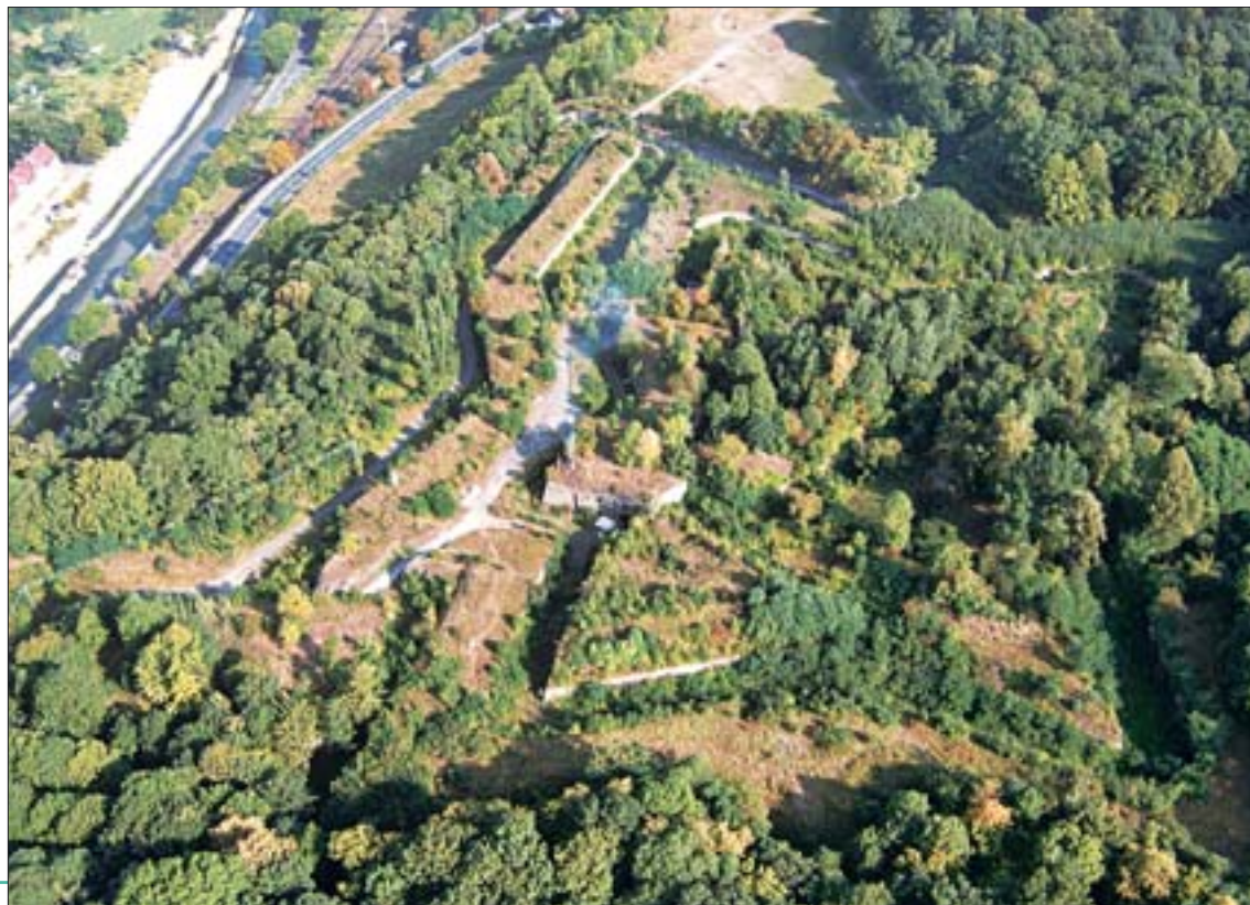
4. Fort Owcza Góra zarośnięty dziką zielenią.

technologicznych bez przestrzegania rygorów konserwatorskich. Taki stan trwał latami. Losem twierdz interesowały się jedynie środowiska naukowe, np. Politechniki Gdańskiej i Wrocławskiej, oraz świadomi ich wartości i potencjału okoliczni mieszkańcy, m.in. przewodnicy sudeccy. Jednak większość mieszkańców Kłodzka i przyjezdni kojarzyli Twierdzę Główną tylko z niewielkim fragmentem udostępnionym turystycznie. Oddalony fort Owcza Góra, pozbawiony gospodarza i zarośnięty dziką roślinnością, zwany był „parkówką”.