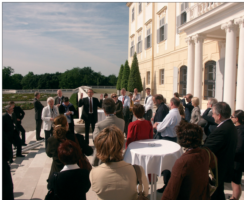
1. Uczestnicy konferencji podczas zwiedzania Pałacu Schloss. 1. Conference participants touring the Schloss Palace.

Podczas towarzyszącego konferencji krótkiego objazdu terenowego organizatorzy zaprezentowali przykłady działań konserwatorskich w najcenniejszych zabytkach regionu. Uczestnicy mieli okazję poznać wnętrza Pałacu Starhemberg – siedziby Ministerstwa Edukacji, Sztuki i Kultury Austrii, w którym król Jan III Sobieski świętował Wiktorię Wiedeńską, Pałac Schloss – odrestaurowany wraz z parkiem i zabudową folwarku z wykorzystaniem środków przyznane przez Unię Europejską, Stare Miasto w Bratysławie oraz zamek Czerwony Kamień, a także Pałac Schönbrunn, na którego terenie zorganizowano wiedeńską część konferencji. Kolejne spotkanie zorganizowane zostanie w przyszłym roku we Francji.