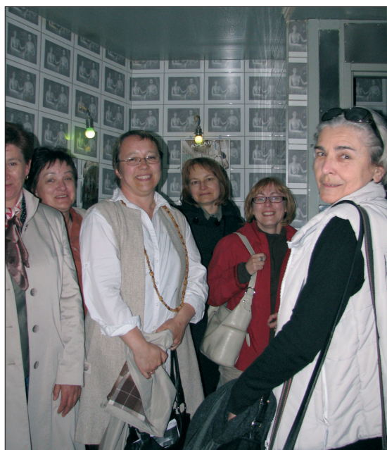
3. Uczestniczki konferencji w Łodzi Kaliskiej – kultowym łódzkim lokalu z wnętrzami (tu: damska toaleta) zaaranżowanymi przez członków legendarnej grupy artystycznej Łódź Kaliska.

The programme of the meeting was enhanced by a tour along the trails of Łódź stained glass and a suitable exhibition featured at the Historical Museum of Łódź. A publication of the post-conference material would be an important summary of the achievements of these remarkable debates.