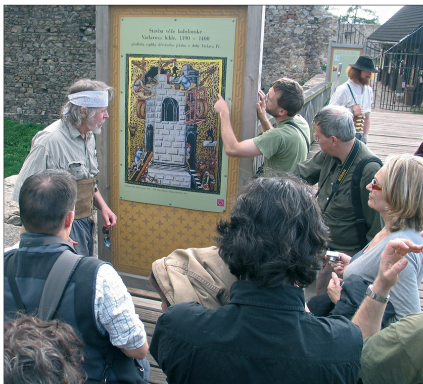
1. Uczestnicy warsztatów w trakcie wyjazdu studialnego przed wizerunkiem miniatury z Biblii Vaclava , na podstawie której zrekonstruowano średniowieczny dźwig deptakowy. Wszystkie fot. D. Mączyński.

Reprezentanci Polski przedstawili uwagi na temat badania i dokumentowania historycznych więźb dachowych na etapie poprzedzającym opracowanie projektu budowlanego. Prezentacja pokazująca w sposób syntetyczny główne zagadnienia związane z tą problematyką została uznana przez kolegów z Czech jako bardzo ważna i wywołała żywą dyskusję. Zaproponowano jej dokładniejsze opracowanie i przetłumaczenie, aby mogła być opublikowana jako wspólne stanowisko międzynarodowe na zakończenie programu „Roofs of Europe”.