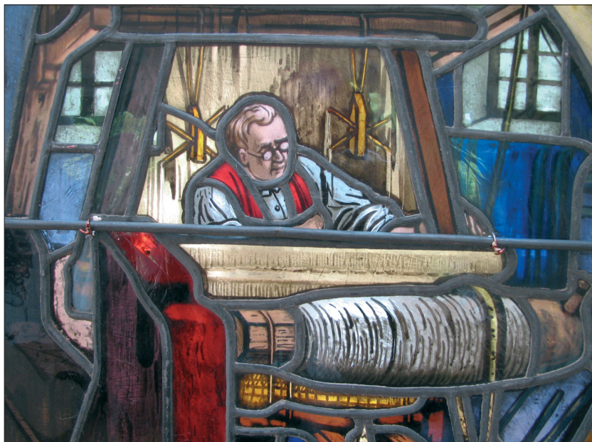
2. Fragment witraża z wizerunkiem tkacza, eksponowanego na towarzyszącej konferencji wystawie w Muzeum Historii Miasta Łodzi.

Tradycyjnie już konferencja organizowana przez Stowarzyszenie Miłośników Witraży stała się okazją do przeprowadzenia zebrania jej członków. Po raz pierwszy w tych okolicznościach wystąpiła w nowej roli wybrana niedawno na prezesa