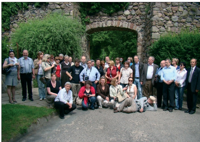
2. Uczestnicy konferencji na tle murów miejskich w Moryniu. 2. Conference participants against the backdrop of the town walls in Moryń.