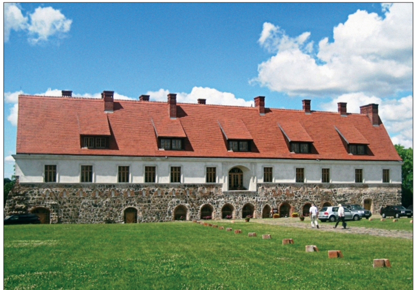
1. Zachodnie skrzydło klasztoru cysterek w Cedyni – odbudowane i zaadaptowane na cele hotelowe.

Obrady odbywały się w odbudowanym i zaadaptowanym na cele hotelowe gotyckim klasztorze cysterek w Cedyni. Wybór obiektu nie był przypadkowy. Odbudowę zachowanego zachodniego skrzydła