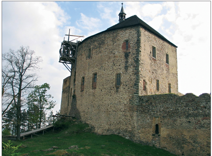
2. Zamek w miejscowości Tocnik z repliką dźwigu deptakowego. 2. Tocnik castle with a replica of a treadmill crane.