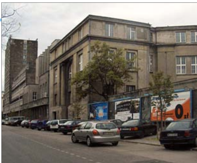
5. Fasada szkoły, stan obecny.

Z treści listu wynika, że A. Gravier zacytował fragment jakiegoś memoriału opracowa-