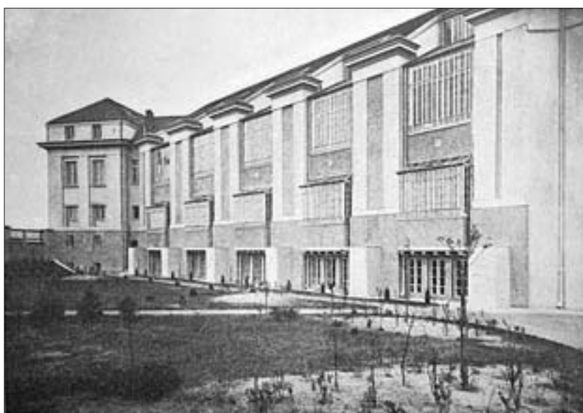
4. Elewacja północna szkoły, 1915 r. A. Gravier, Szkoła Sztuk Pięknych w Warszawie , „Przegląd Techniczny”, 1915, nr 3-4.

Z przytoczonej korespondencji jednoznacznie wynika, że propozycja udostępnienia budowanego gmachu Szkoły Sztuk Pięknych także dla architektów została zaakceptowana przez