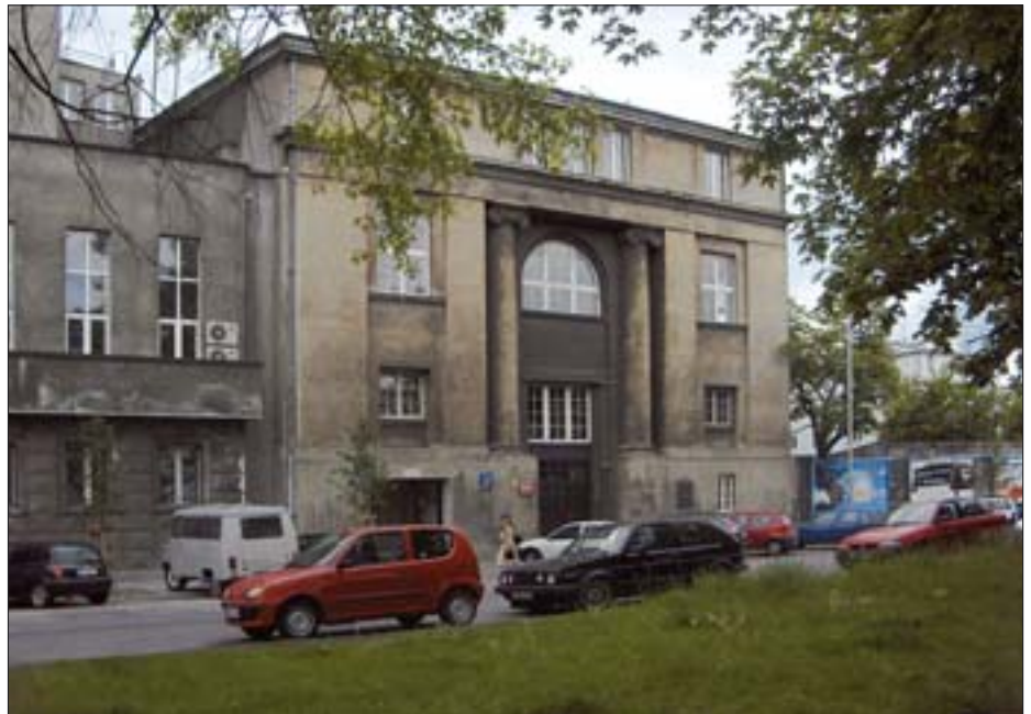
1. Fasada Szkoły Sztuk Pięknych, stan obecny.

W środowisku przeważał pogląd o konieczności utworzenia Wydziału Inżynieryjno-Budowlanego ze specjalizacją architektoniczną. Jedynie architekci skupieni we wspomnianym kole i prowadzący kursy architektoniczne 1 usilnie dążyli do utworzenia samodzielnego wydziału w ramach Politechniki Warszawskiej. W lutym 1915 r. ich starania doprowadziły do powołania komitetu organizacyjnego Wydziału Architektonicznego. W skład komitetu