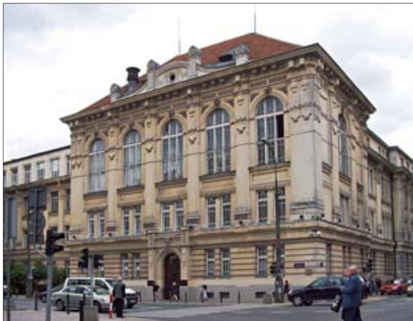
9. Fasada gmachu Wydziału Architektury Politechniki Warszawskiej, stan obecny.

Większość wykładowców wydziału związana była z Towarzystwem Opieki nad Zabytkami Przeszłości. Nie było to bez znaczenia w przyjętym procesie kształcenia. Indywidualne poglądy prowadzących decydowały