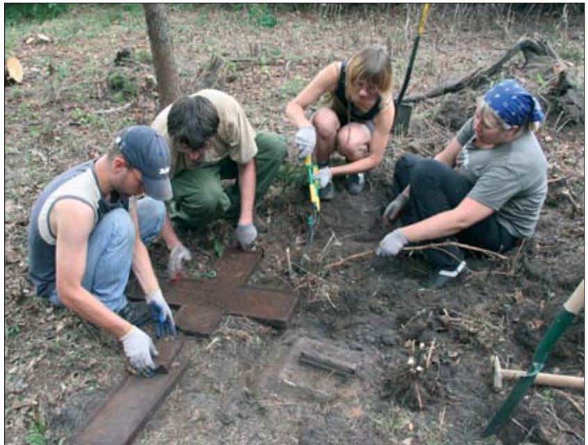
1. Wolontariusze przy pracy na opuszczonym mazurskim cmentarzu w Puszczy Piskiej.

Na ogłoszenie o zapisach na obozy odpowiedziało około 130 osób z całej Polski, z których wybrano dwie dziesiątki, głównie studentów z kierunków nie związanych z archeologią czy historią, a więc pedagogów, polonistów, socjologów, kulturoznawców i innych. W obozie w Puszczy Piskiej udział wzięli także, na zaproszenie Fundacji „Borussia”, wolontariusze z Niemiec oraz Rosji, a w obozie w Koniecpolu studenci archeologii z Uniwersytetu Łódzkiego.