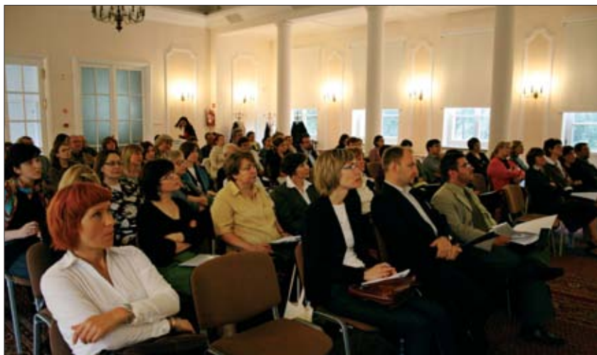
2. Uczestnicy seminarium: pracownicy służb konserwatorskich zajmujący się zielenią zabytkową, przedstawiciele środowisk naukowych oraz specjaliści z KOBiDZ.

2. The seminar participants: conservation services staff dealing with historical vegetation, representatives of scientific circles and National Heritage Board specialists.