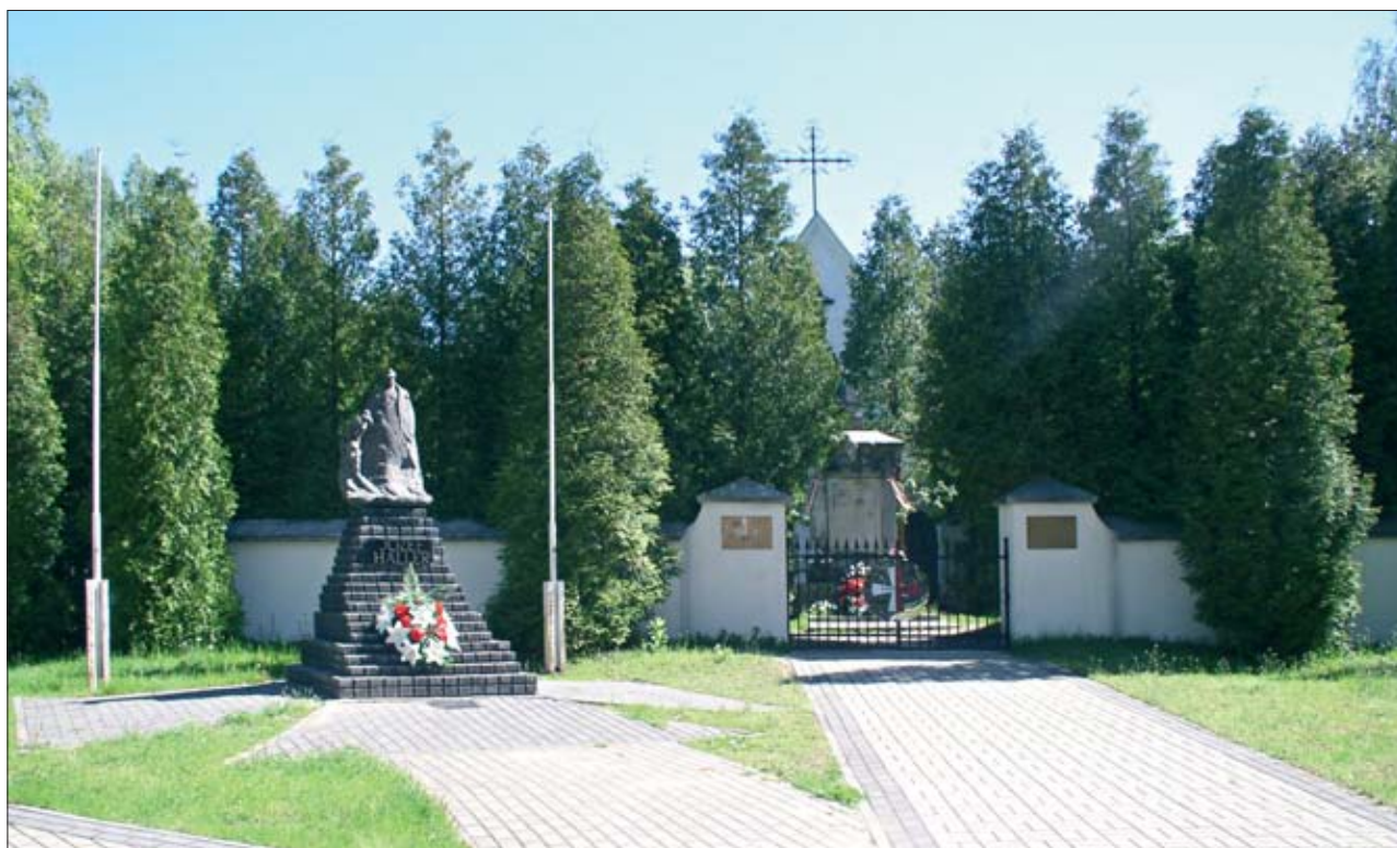
8. Cmentarz wojenny pod Ossowem, pomnik ku czci poległych w bitwie oraz pomnik gen. Józefa Hallera (po lewej), 2008 r.

W Ossowie występują jeszcze inne formy upamiętnienia bitwy. Są to dwa krzyże: jeden,