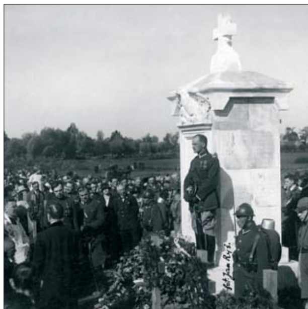
7. Cmentarz wojenny pod Ossowem, odsłonięcie pomnika ku czci poległych w bitwie, 1924 r.

7. War cemetery at Ossów, the unveiling of a monument in honour of those fallen in battle, 1924.