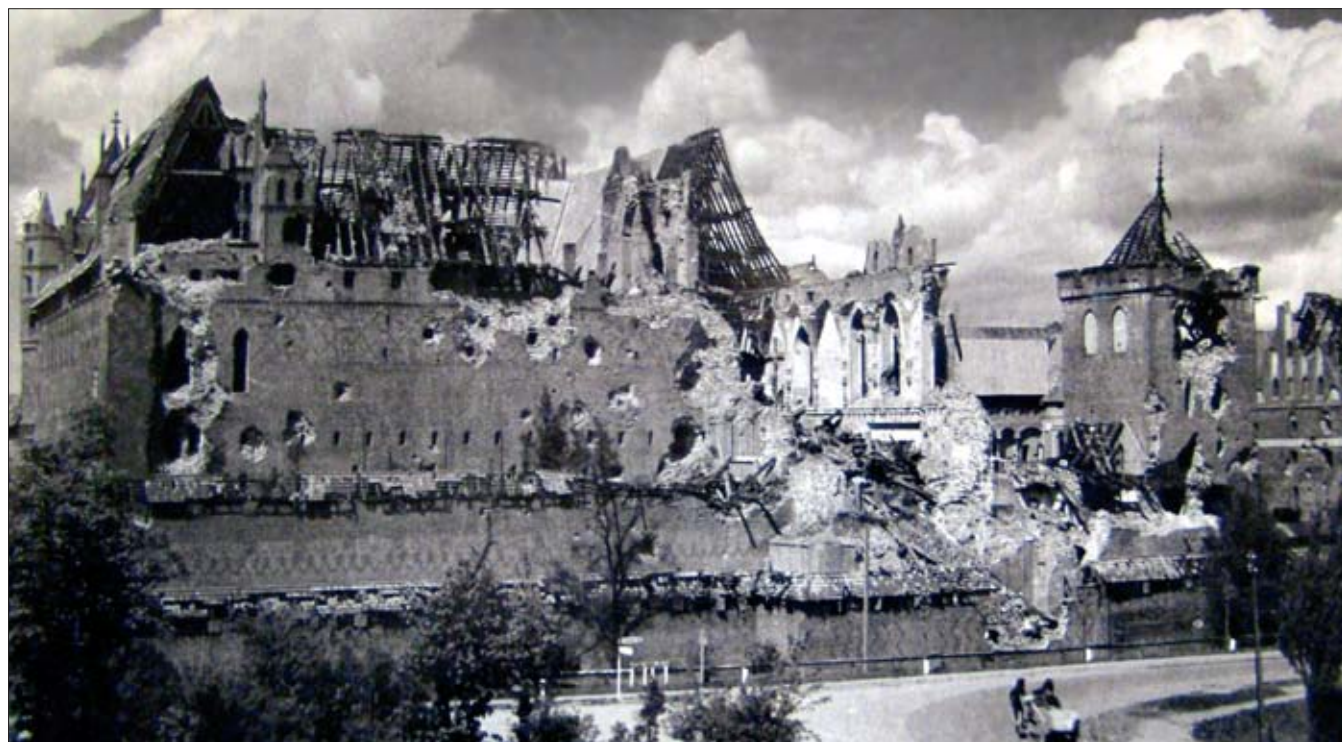
9. Zamek w 1945 r. 9. Castle in 1945.

Jednakże niepostrzeżenie te uzupełnienia, będące rezultatami prac z ostatniego półwiecza, nabierają nowych, niezależnych wartości zabytkowych. I nie ma znaczenia, czy są niedoskonałe, czy niedokończone. Znakomitym przykładem mógłby być tu kościół na Zamku Wysokim, zachowany w obecnym stanie. Jest wspaniałym, niezafalszowanym dokumentem dramatycznej historii zamku malborskiego, ilustrującym i jednocześnie symbolizującym lata jego świetności, klęsk i podnoszenia z upadku. Szkoda byłoby, gdyby wyrazisty, unikatowy przekaz, jaki niesie ten zabytek, został zniszczony przez współczesny architektoniczny neohistoryzm i zbanalizowany przez pseudokonserwatorski kracjonizm. Stanowią one dzisiaj jedno z najpowszechniejszych zagrożeń dla autentyczności zabytków. Inspirowane również