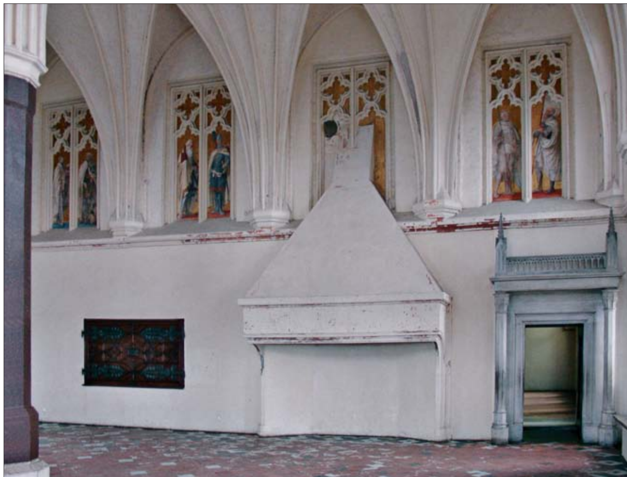
5. Wnętrze Refektarza Letniego w Pałacu Wielkich Mistrzów z wystrojem z 1. poł. XIX w. Fot. G. Bukal, 2005 r.

5. Interior of the Summer Refectory in the Palace of the Grand Masters with outfitting from the first half of the nineteenth century. Photo: G. Bukal, 2005.