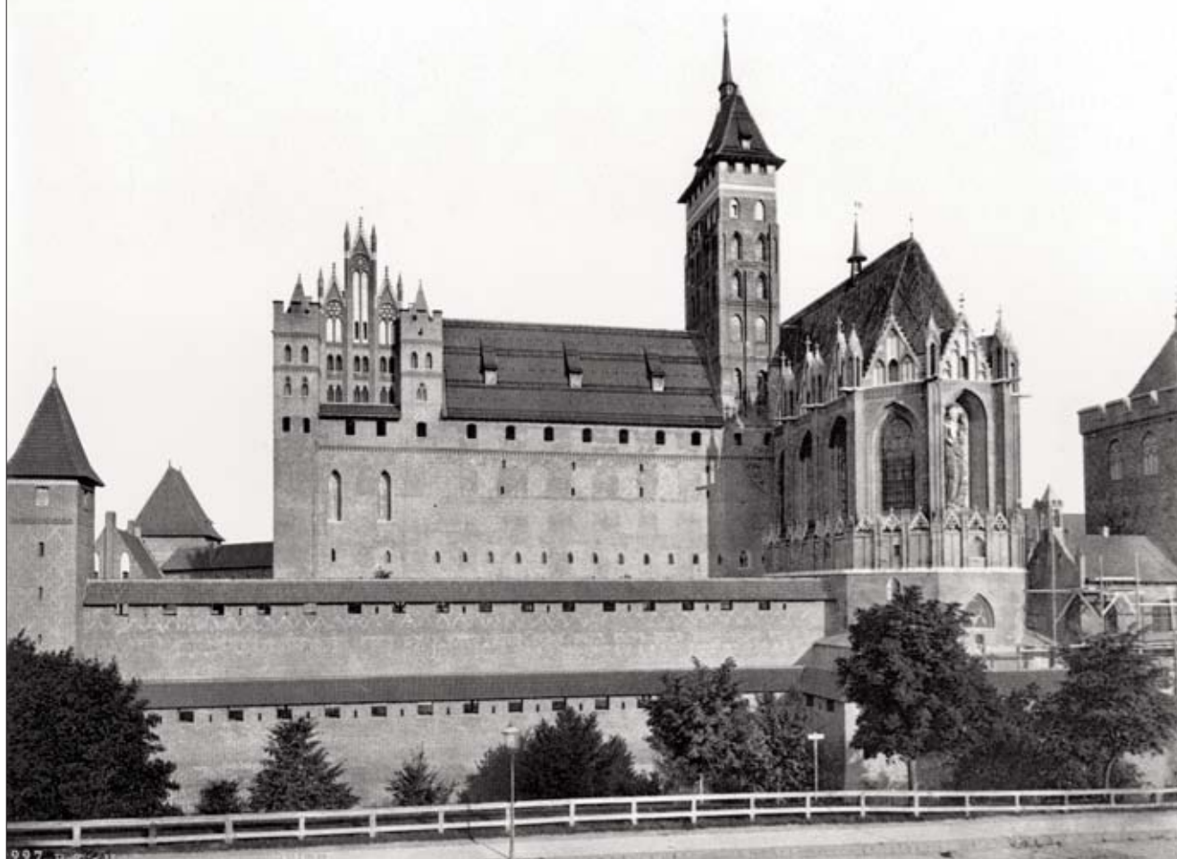
8. Zamek od wschodu, stan po restauracji Steinbrechta. Fot. ok. 1930, autor nieznan.