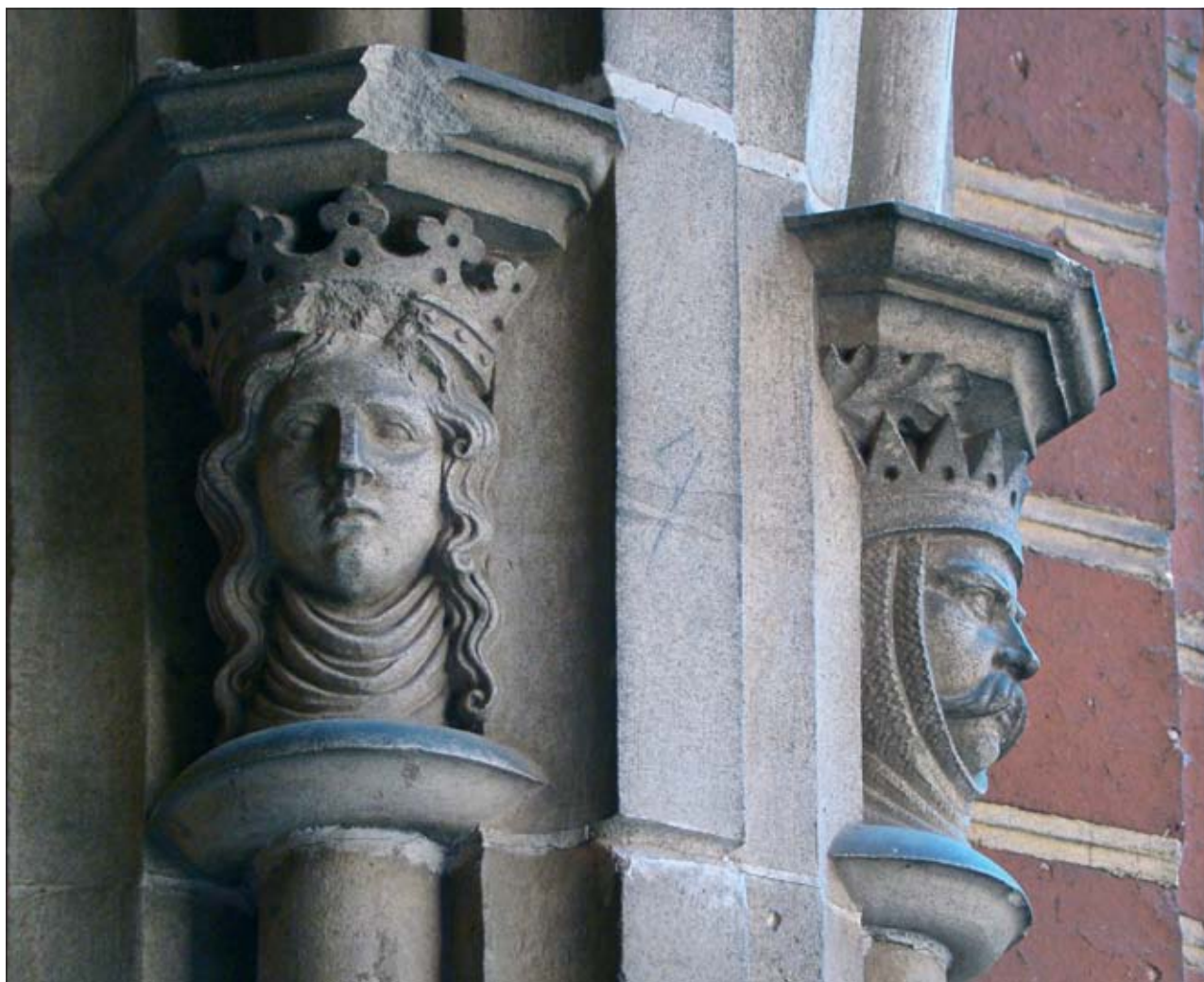
1. Zamek Wysoki, detal krużganku. Fot. G. Bukal, 2009 r.