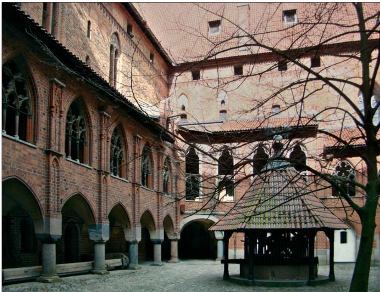
7. Zamek Wysoki, dziedziniec. Fot. G. Bukal, 2009 r. 7. High Castle, courtyard. Photo: G. Bukal, 2009.

Prowadzone przez Steinbrechta działania objęły z początku Zamek Wysoki (1882-1896), a potem Zamek Średni (1895-1922). W przypadku Zamku Wysokiego zadanie stojące przed Steinbrechtem można określić jako przekształcenie zespołu magazynów wojskowych w upaństwowioną, cesarską (i częściowo zmilitaryzowaną), reprezentacyjną siedzibę Zakonu Niemieckiego. Miał więc odwrócić wszystkie zmiany przeprowadzone po 1457 r., a ponadto stworzyć szałfaż życia krzyżackich zakonników w czasach wielkich mistrzów. W Zamku Wysokim w zakresie architektury sprowadzało się to do odtworzenia wszystkich dawnych poziomów pomieszczeń ze sklepieniami, odtworzenia krużganek i wszystkich elewacji zespołu (il. 6, 7). Zamek Średni należało poddać restauracji na nowo, usunąć efekty prac przeprowadzonych w 1. poł. XIX w. (najbardziej widoczne w skrzydle bramnym) oraz