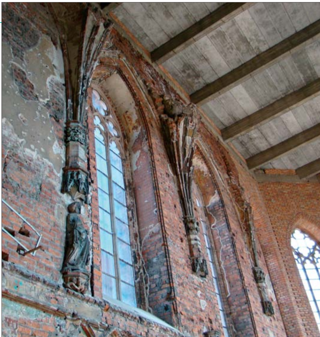
10. Wnętrze kościoła w Zamku Wysokim – autentyczny dokument historii zamku. 10. Interior of a church in the High Castle – an authentic document of the castle's history.

politycznymi koniunkturami, choć częściej chyba ekonomicznym utylityzmem, odbierają zabytkom ich powagę i dewalują je, sprowadzając do poziomu medialnych atrakcji.