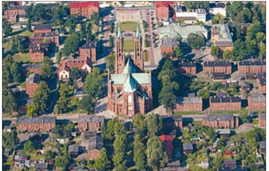
1. Żyrardów, osada fabryczna. Fot. archiwum Urzędu Miasta Żyrardów.

Idea rewitalizacji, wraz z propagowanym przez Unię Europejską wyrównywaniem szans rozwoju zdegradowanych obszarów miast i wsi, staje się coraz bardziej rozpowszechniona. Przeznaczone na te cele fundusze unijne koordynowane są przez urzędy marszałkowskie poszczególnych województw. Informację