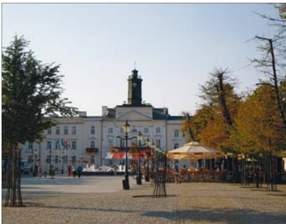
6. Płock, rynek z ratuszem.

Podczas dyskusji prowadzonych na zakończenie każdego z „piątków” pojawiało się wiele zagadnień i wspólnych dla wszystkich spotkań tematów. Były to m.in. sprawy związane z dalszym zachowaniem i użytkowaniem zabytkowych centrów miast. Omawiano przyczyny zagrożeń, wynikających zarówno z wieloletnich zaniedbań w utrzymaniu technicznym miejskiej zabudowy, wyludniania się obszarów historycznych, jak i niewłaściwego