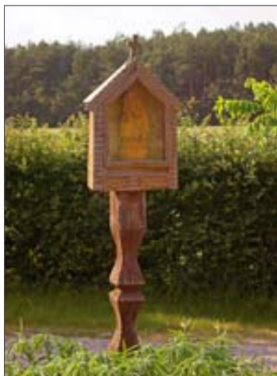
1. Kapliczka w skansenie w Zaborku.

odbytymi w trakcie studiów, w tym minimum ośmiomiesięczna praktyka na stanowiskach o skomplikowanej stratyfikacji. Postulowano także wprowadzenie do Rozporządzenia zapisów prawnych umożliwiających, w określonych sytuacjach, zawieszanie uprawnień do