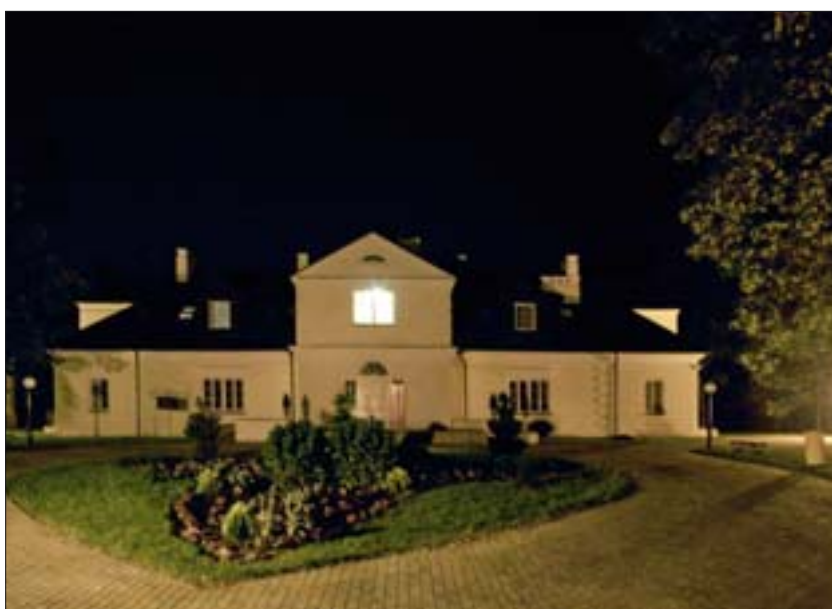
2. Zespół parkowo-palacowy w Roskoszy.

1. Chapel in a Skansen in Zaborek.