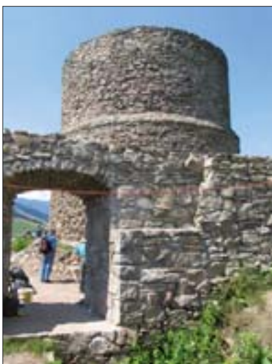
1. Rytro. Fot. I. Malawska, 2008 r. 1. Rytro. Photo: I. Malawska, 2008.

Zmiana ustrojowa w Polsce i dokonujące się zmiany własnościowe w tej grupie zabytków w sposób bardzo dobitny uwiaryściły słabość dotychczas istniejących procedur, zasad postępowania konserwatorskiego, a być może i rozwiązań legislacyjnych. Podjęte działania przy zamkach w Tykocinie, Bobolicach, Wytrzystce, a ostatnio w Ciechanowie stały się okazją do dyskusji wykraczającej daleko poza środowisko fachowców. Próbą odpowiedzi na wiele ważnych pytań miała być konferencja „Ochrona zabytków architektury obronnej – teoria a praktyka”, zorganizowana w Dziadkowie 18-20 października 2007 r. przez Polski Komitet Narodowy Międzynarodowej Rady Ochrony Zabytków ICOMOS,