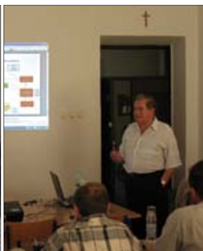
1. Obrady seminaryjne. 1. Seminar debates.

W dniach 30 czerwca - 3 lipca 2008 r. w Żółkwi i w Zamościu odbyło się polsko-ukraińskie seminarium zatytułowane „Ochrona dziedzictwa kulturowego – podstawa tożsamości narodu”. Wzięli w nim udział słuchacze z ukraińskich instytucji, głównie zastępcy starostów powiatów obwodu lwowskiego oraz pracownicy oddziałów ochrony dziedzictwa kulturowego urzędów powiatowych. Seminarium jest wynikiem międzysąsiedzkiej współpracy w dziedzinie szeroko pojętego zagadnienia opieki nad dziedzictwem kulturowym. Zorganizowane zostało przez Centrum Konserwacji w Żółkwi, instytucję powstałą z inicjatywy współpracującego z KOBiDZ dyrektora