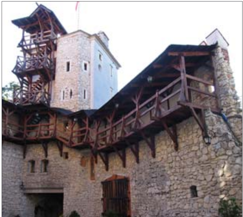
2. Korzkiew. Fot. I. Malawska, 2008 r. 2. Korzkiew. Photo: I. Malawska, 2008.

Stwierdzono, że największy napór inwestycyjny skierowany jest na ruiny zamków. Do dalszych prac przyjęto więc założenia wypracowane przez środowisko konserwatorskie na konferencji w Działdowie: ruina zabytkowa, powstała w procesie długotrwałego niszczenia, jest równoprawnym zabytkiem; nie każda ruina nadaje się do utrwalenia; nie wszystkie ruiny są równie cenne.