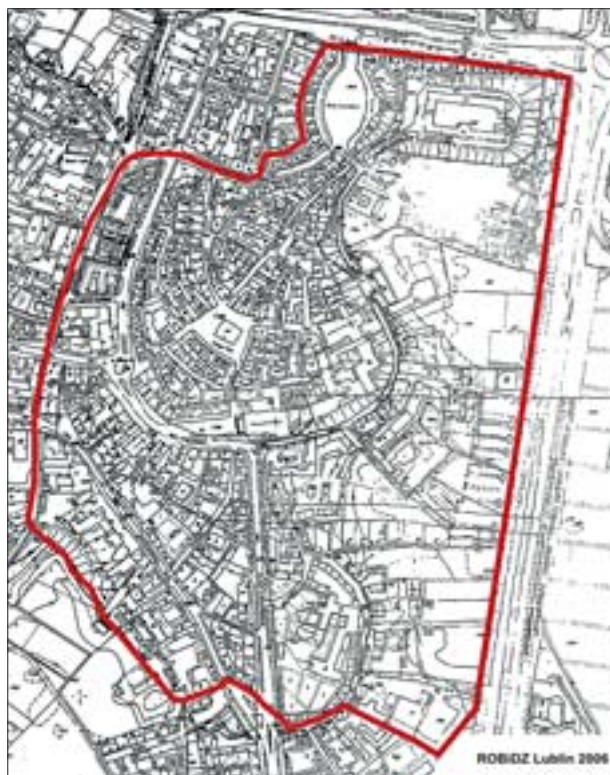
3. Lubelski Park Kulturowy Wschodni, granice parku na mapie syt. wys. b. s. Opr. ROBiDZ 2006 r.