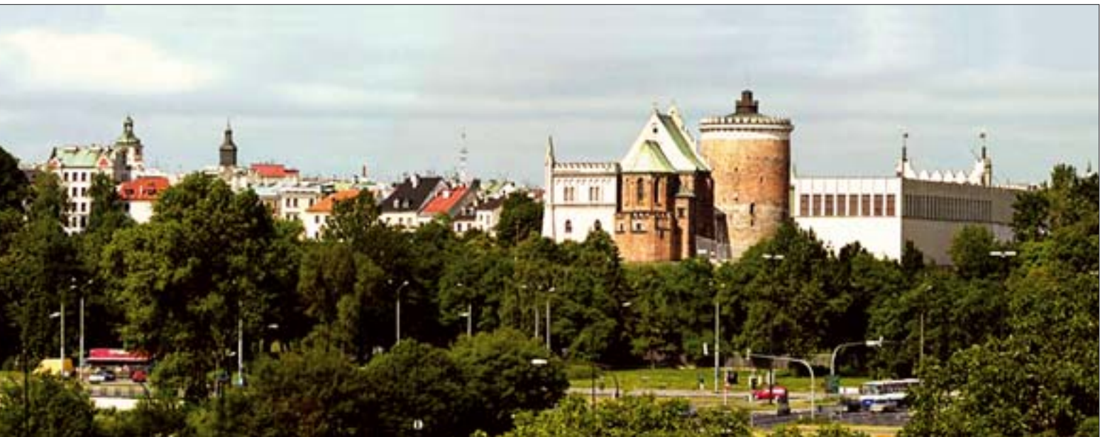
4. Lubelski Park Kulturowy Wschodni, Lublin. Reprezentacyjna panorama wschodnia. Fot. P. Maciuk, 2000 r.

co reguluje pod względem formalnoprawnym ustawa o ochronie zabytków i opiece nad zabytkami z 2003 r. Należy zarazem pamiętać, że już znacznie wcześniej – w latach 70. XX w. – realizowany był w Polsce V program rządowy „Ochrona i konserwacja zabytkowego krajobrazu kulturowego” wg idei