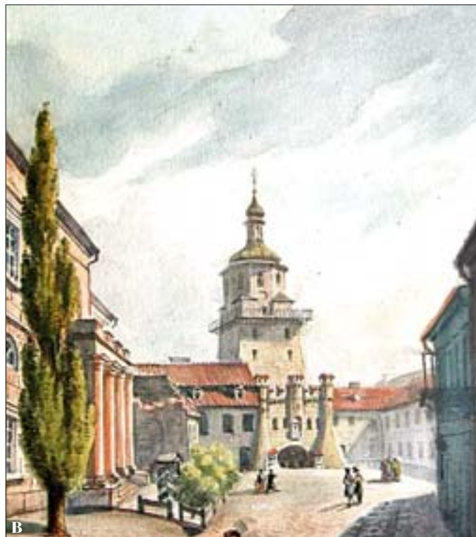
7. Lubelski Park Kulturowy Wschodni, Lublin. Brama Krakowska, XIV w., XVIII w. A – fot. G. Michalska, 2006 r.; B – ryc. (w:) K. Stronczyński, Widoki zabytków starożytności, Gub. Lubelska , 1855 r.