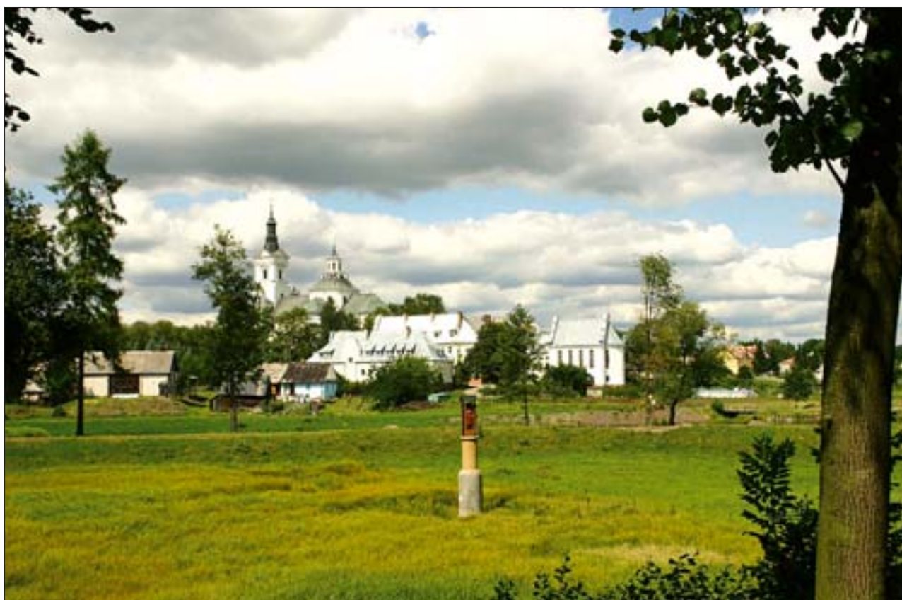
8. Kodeński Park Kulturowy, Kodeń. Widok w kierunku zespołu kościoła św. Anny, XVII-XIX w. Fot. M. Osmulska-Paprotka, 2005 r. 8. The Kodeń Culture Park, Kodeń. View towards the complex of the church of St. Anne, seventeenth-nineteenth century. Photo: M. Osmulska-Paprotka, 2005.

Z problematyką zachowania najcenniejszych obszarów nierozzerwalnie łączy się wielowątkowe zadanie rewitalizacji. Należy ją kojarzyć nie tylko z konserwacją i restauracją krajobrazu, ale również rozwiązaniem wielu zagadnień socjalnych. Dotyczy to nie tylko działań związanych z kształtowaniem świadomości mieszkańców i wzmacnianiem motywacji do tworzenia i utrzymywania parku kulturowego, ale także z szeroko rozumianym wpływem na kwestie bytowe mieszkańców, od czego zależy bezpieczne