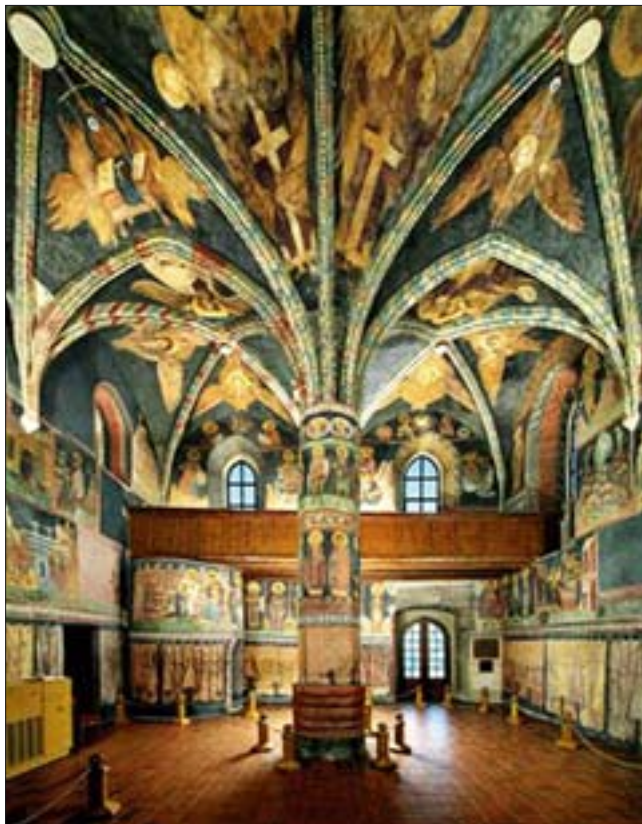
6. Lubelski Park Kulturowy Wschodni, Lublin. Kaplica pw. Św. Trójcy, 2. ćw. XIV w. (polichromia 1418 r.). Fot. P. Maciuk, 2000 r.

Zasady delimitacji parku kulturowego – granice parku stanowią obwód zamknięty i obejmują obszar o szczególnym nasyceniu równomiernie rozłożonymi zasobami substancji zabytkowej (historycznymi układami urbanistycznymi i ruralistycznymi, architekturą i budownictwem, komponowanymi układami wód i zieleni, miejscami pamięci, obiektami archeologicznymi, fortyfikacją, siecią dróg historycznych) oraz niematerialnymi wartościami kulturowymi, w powiązaniu z walorami krajobrazu naturalnego. Do chronionych składników parku kulturowego należą ponadto historycznie ukształtowane związki funkcjonalno-przestrzenne zespołów zabudowy oraz