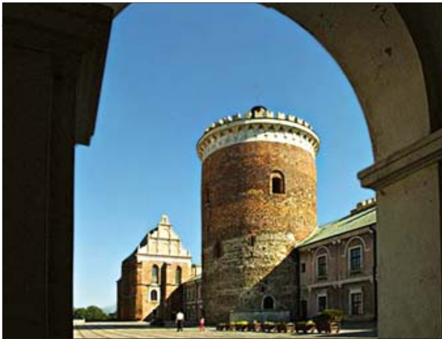
5. Lubelski Park Kulturowy Wschodni, Lublin. Zespół zamkowy – donżon. Fot. P. Maciuk, 2000 r.