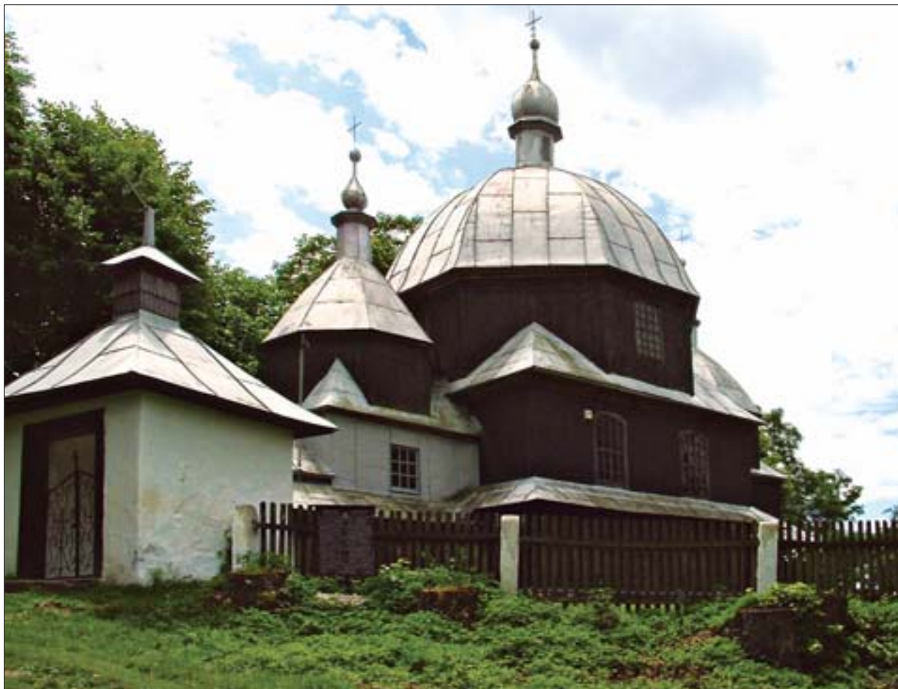
9. Południoworostoczański Park Kulturowy, Hrebenne. Zespół cerkwi grekokat., ob. rzymskokat. 1685 r., przeb. XVIII w. Fot. J. Niedźwiedź, 2005 r.

9. The Southern Restocked Culture Park, Hrebenne. Complex of Uniate churches, today: Roman Catholic, 1685, turn of the eighteenth century. Photo: J. Niedźwiedź, 2005.