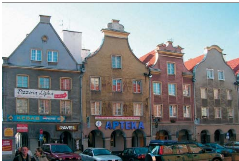
13. Pierzeja południowa – widok sprzed wojny i po odbudowie. 13. Southern row of houses – view from the inter-war period and after reconstruction.