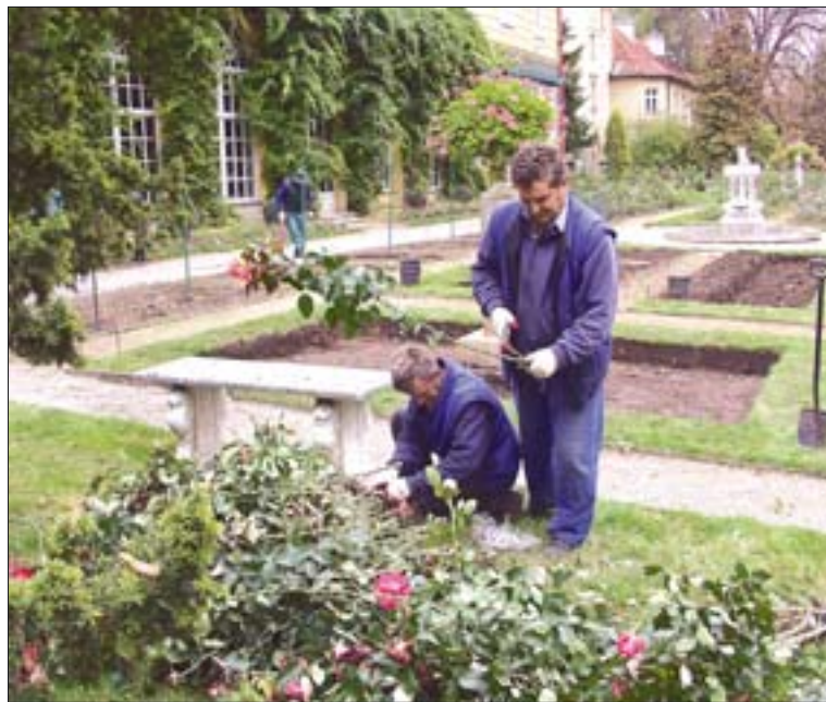
11. Rekonstrukcja nasadzeń w 2003 r. 11. Reconstruction of plantings in 2003.