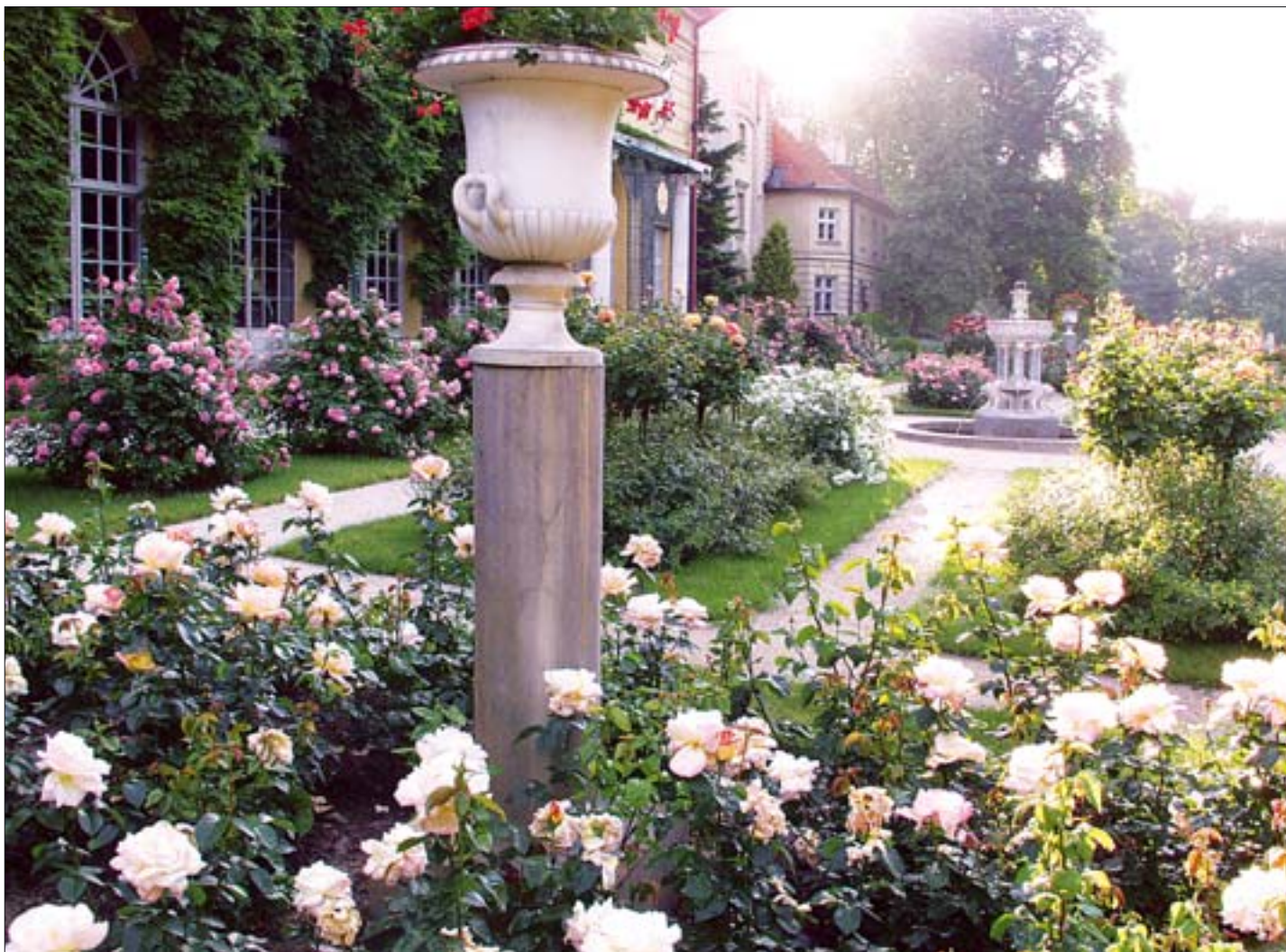
10. Stan obecny rosarium, widok od zachodu. 10. Present-day state of the rosarium, view from the west.

uszkodziła drewnianą altanę, rzeźbę „Dziewczyny wkładającej wianek” oraz sarkofag – żardinierę. Po tym zdarzeniu wymienione rzeźby umieszczono we wnętrzach zamkowych. W efekcie kompozycja ogrodowa została znacznie zubożona.