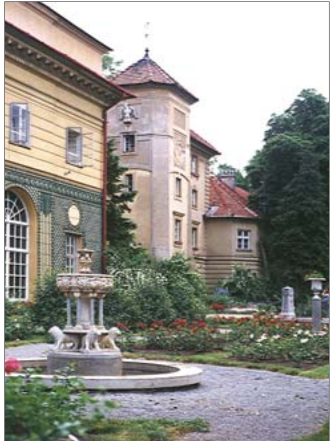
9. Ogród Różany, stan ok. 1990 r. 9. Rose Garden, state in about 1990.

W tym czasie Ogród Różany zachowywał regularny układ kwaterowy, jednak proporcje i rozplanowanie poszczególnych kwater uległy zmianie w stosunku do początków XX w. W 1959 r. burza powaliła jedną z lip w alei poza fosą, która poważnie