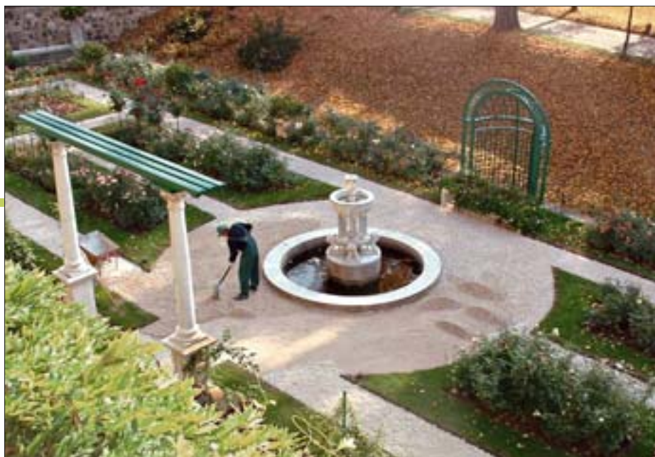
13. Rekonstrukcja alejek w 2004 r. 13. Reconstruction of alleys in 2004.