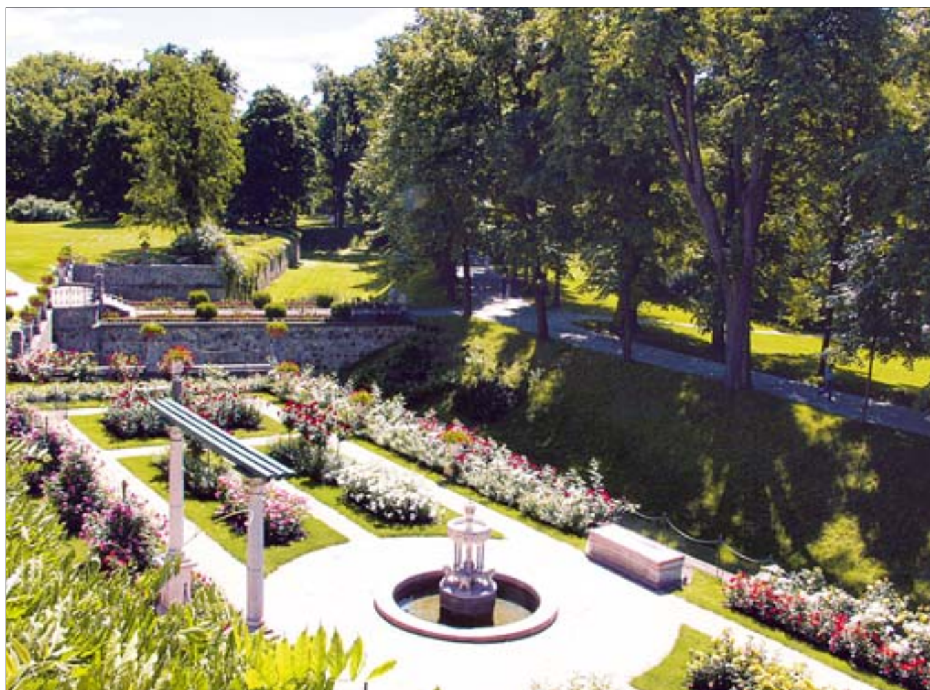
14. Ogród Różany, stan w czerwca 2005 r. w trakcie rekonstrukcji architektury ogrodowej. 14. Rose Garden, state in June 2005 in the course of a reconstruction of the garden architecture.

Ostatnim etapem rekonstrukcji założenia ogrodowego było przywrócenie elementów rzeźbiarskich. W 2005 r. w ogrodzie stanęły rzeźby: „Dziewczyna wkładająca wianek” oraz sarkofag-żardiniera. Są one wiernymi kopiami monumentów zdołanych Ogród Różany na początku XX w., a obecnie pozostających we wnętrzach muzealnych. Kopie zabytkowych