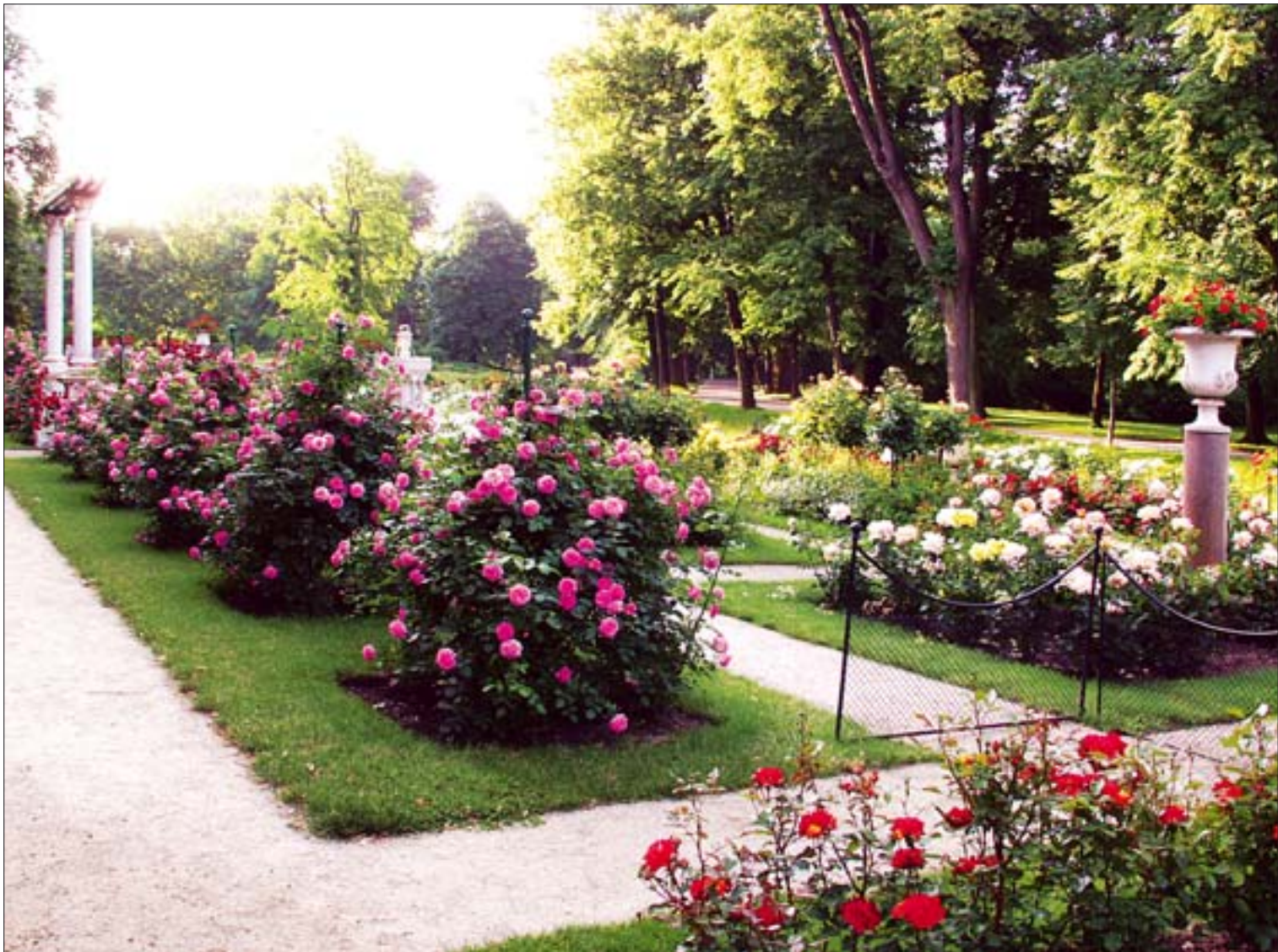
1. Stan obecny ogrodu.

nież o jego otoczenie. Trwające 14 lat prace (od 1890 do 1904 r.) objęły przebudowę ogrodu w jego ówczesnych granicach oraz rozbudowę w kierunku wschodnim poprzez przyłączenie znacznego obszaru. Tym samym powiększono park blisko dwukrotnie. Plan parku opracował ogrodnik i pejzażysta Franz Maxwald.