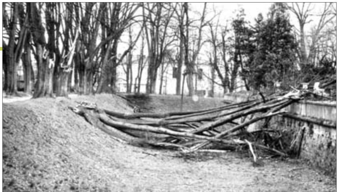
8. Zniszczenia w Ogródku Różanym spowodowane huraganem w 1959 r. 8. Devastation of the Rose Garden caused by a hurricane in 1959.