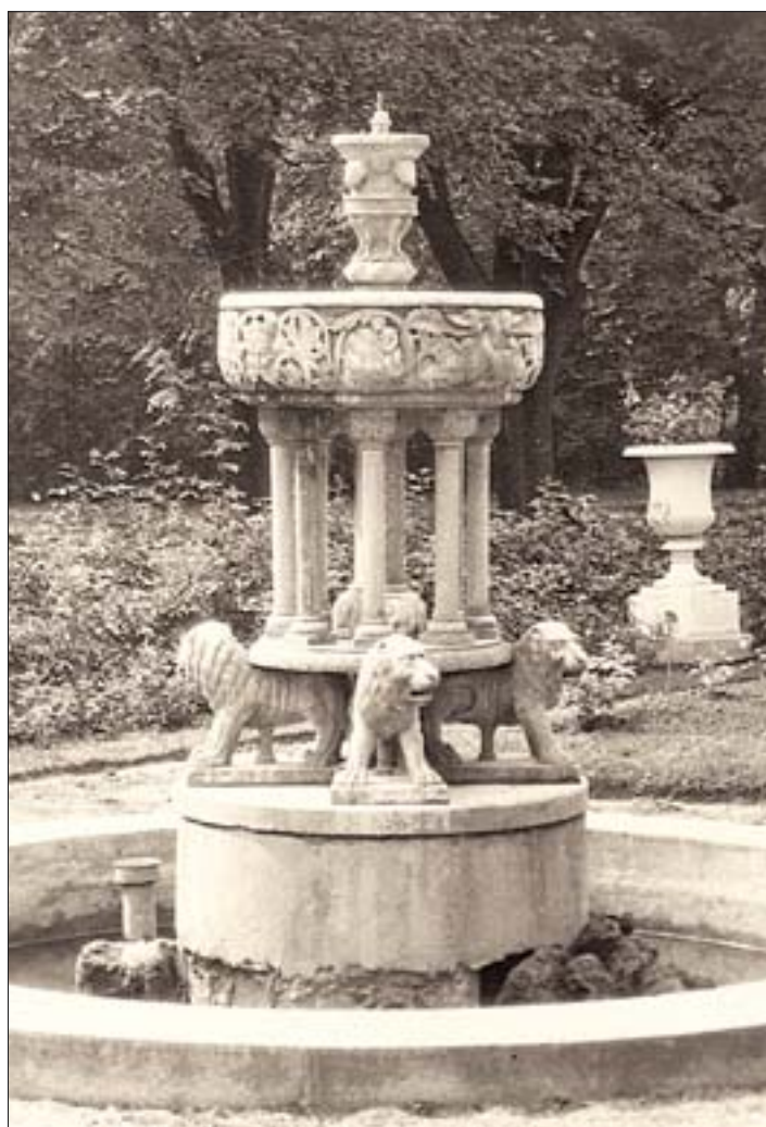
6. Fontanna w Ogrodzie Różanym przed 1939 r. 6. Fountain in the Rose Garden prior to 1939.

Poszczególne kwatery ogrodu obsadzono różnymi krzewami różanymi – pnącymi, rabatowymi, wielokwiatowymi oraz sztamowymi (na pniu). Każda kwatera ujęta była bordiurą trawnika. W okresie międzywojennym nie wprowadzono żadnych istotnych zmian w wyglądzie i układzie kompozycyjnym Ogrodu Różanego.