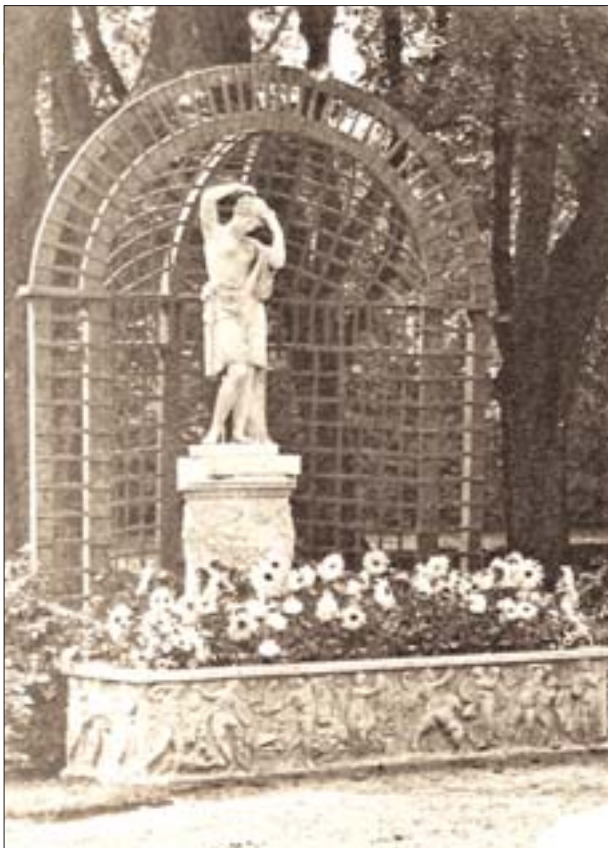
7. Architektura ogrodowa przed 1939 r. 7. Garden architecture prior to 1939 r.