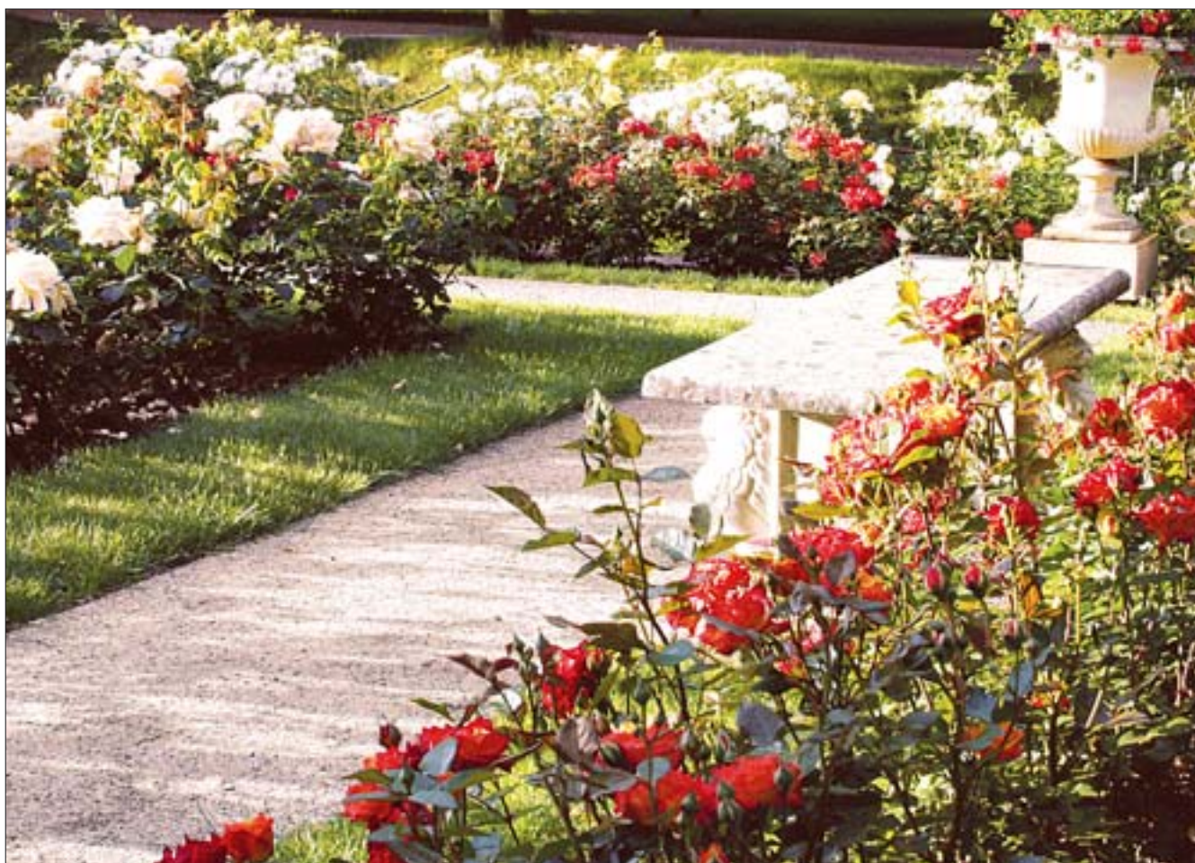
12. Detal architektoniczny, stan obecny. 12. Architectural detail, present-day state.

Wszelkie prace projektowe zostały poprzedzone starannymi studiami zachowanych dokumentów i materiałów ikonograficznych. Fotografie archiwalne pochodzące głównie z albumów autorstwa Józefa Piłtrowskiego, wykonane w 1929 r. i przechowywane w Instytucie Sztuki Polskiej Akademii Nauk w Warszawie oraz w Archiwum Muzeum-Zamku w Łańcucie, posłużyły za podstawę do pomiarów fotogrametrycznych. Dokonał ich Michał Kowalczyk z Politechniki Warszawskiej. Umożliwiły one ustalenie oryginalnych wymiarów poszczególnych kwater