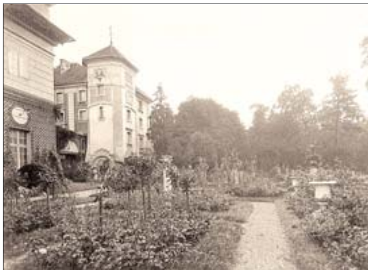
4. Ogród przed 1939 r., widok od zachodu. 4. Garden prior to 1939, view from the west.