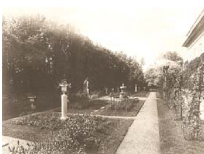
5. Ogród przed 1939 r., widok od wschodu. 5. Garden prior to 1939, view from the east.