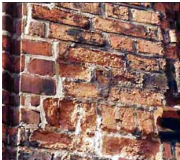
13. Zniszczona powierzchnia muru wskutek działania soli.

sole tworzą plamy, zacieki, mniej lub bardziej puszyste wykwity, matowe i szkliste nawarstwienia. Mogą one przybierać formy dobrze wykształconych dużych lub małych kryształów oraz tworzyć osady zbite lub porowate. Sole krystalizujące w porach materiałów tworzą początkowo zarodki krystalizacyjne, które z czasem powiększają się, przybierając rozmiary zależne od stężenia soli w roztworze wodnym. Jeśli sól wypełni pory całkowicie, to każdemu powiększeniu kryształów towarzyszyć będzie nacisk na otaczające ścianki porów, w których sól jest uwieczniona, prowadząc do zniszczenia materiału. Z tego wynika, że zniszczenia wskutek działania soli występują przede wszystkim w przypadku ich krystalizacji w porach