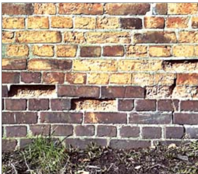
19. Zniszczone cegły wskutek zastosowania do spoinowania szerszej i mocnej zaprawy cementowej. 19. Brick damaged due to the application of dense and strong lime mortar for binding.