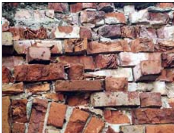
4. Ulegające zniszczeniu źle wyrobione i wypalone cegły.

4. Badly prepared and baked bricks.