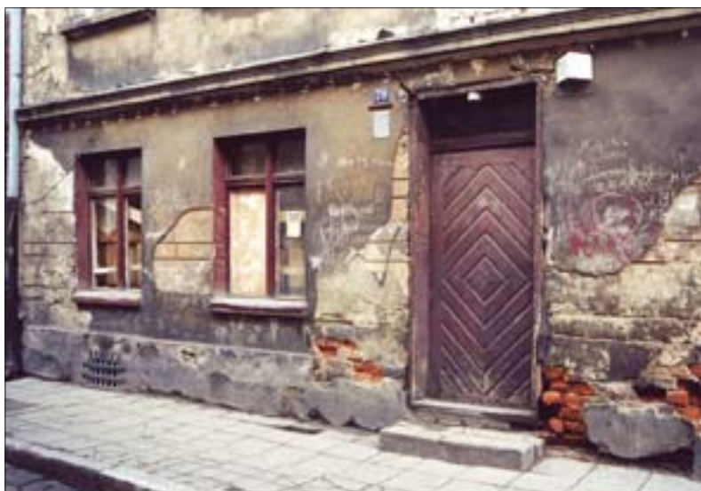
8. Tynk i mur niszczone przez wodę gruntową.

Materiały budowlane są niszczone zarówno przez wody opadowe (deszcz, śnieg, grad), jak i przez wodę kondensacyjną i gruntową (il. 8, 9). Umożliwia