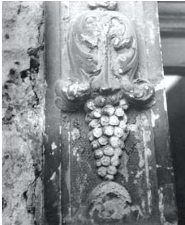
10. Złuszczone nawarstwienia odsłaniają zniszczony kamień.

Pozostałe z wymienionych kwasów, zaliczane do mocnych, działają znacznie energiczniej i powodują rozkład powierzchniowy materiałów budowlanych zawierających głównie węglany. Tak więc, w przeciwieństwie do kwasu węglowego, który działa w całej strefie zawilgocenia materiału, kwasy mocne reagują błyskawicznie, rozkładając węglany występujące na powierzchni materiału, a następnie niszcząc coraz głębsze jego warstwy. W wyniku reakcji silnych kwasów z węglanem wapnia powstają łatwo rozpuszczalne sole (chlorek i azotan wapnia), związki o ograniczonej rozpuszczalności (siarczany wapnia) oraz nierozpuszczalne (fluorek wapnia). W przypadku działania kwasu solnego i azotowego następuje więc nieodwracalny proces niszczenia wapieni (rozkład,