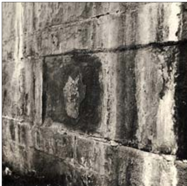
7. Płytkowe rozwarstwienie się kamieni zgodnie z uwarstwieniem.

Tak więc odporność kamiennych detali architektonicznych jest uzależniona od składu mineralogicznego skał, z których je wykonano, oraz od ich struktury i tekstury.