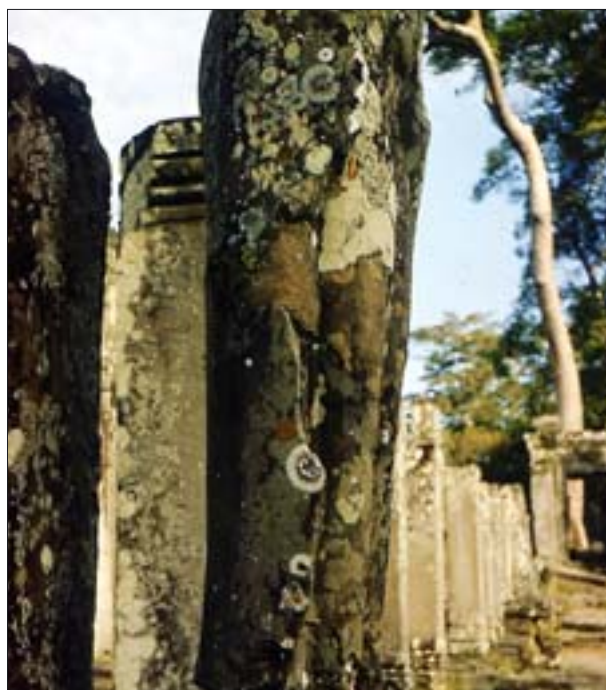
15. Mikroorganizmy niszczące obiekty kamienne.

W naszym klimacie zniszczenia spowodowane zmianami temperatury występują głównie w obecności wody. Przy spadku temperatury poniżej 0^{\circ}\text{C} woda wypełniająca kapilary materiałów oraz ich szczeliny, zamrażając, rozsadza materiały. W temperaturze 0^{\circ}\text{C} lód ma większą objętość od wody o ok. 9 proc., a w temperaturze minus 22^{\circ}\text{C} ok. 13,2 proc. Zmianie objętości towarzyszy wzrost ciśnienia w pierwszym przypadku o 0,6 MPa, a w drugim o 211,5 MPa. Ciśnienie jest wystarczające, aby przy powtarzającym się zamrażaniu wody i topnieniu lodu nastąpiła destrukcja materiałów budowlanych. Najczęściej spotykanym zjawiskiem jest pęknięcie materiałów wskutek