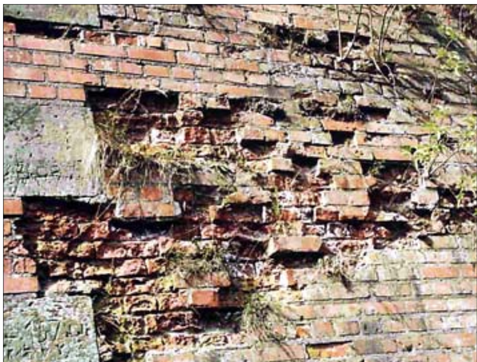
1. Niszczący mur ceglany.

Należy podkreślić, że także komisje konserwatorskie powoływane do odbioru prac nie mogą spełniać pokładanych w nich nadziei. Zwykle nie jest to