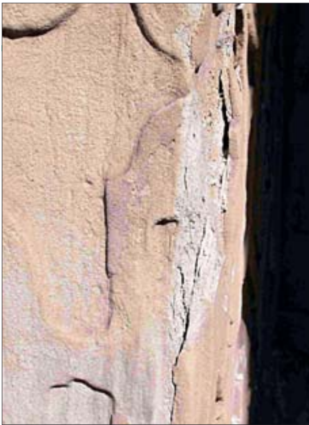
23. Rozwarstwiający się kamień wzmocniony powierzchniowo. 23. Stone undergoing stratification, reinforced on the surface.

Powierzchniom spoin należy nadać taki kształt, jak w zaprawach autentycznych. Gdy brakuje wzorca, wskazane jest nadanie spoinom charakteru właściwego dla epoki historycznej, z której pochodzi obiekt (np. w gotyku spoiny najczęściej wypełniano równo z licem cegły, a następnie nadawano im kształt jednostronnie skośny lub dwustronnie skośny).