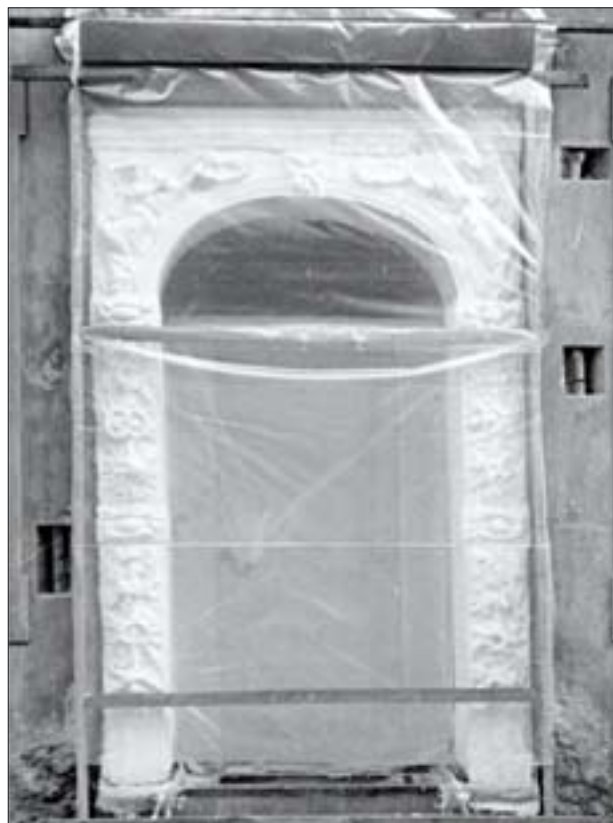
21. Portal przygotowany do strukturalnego nasycenia metoda ciągłego przepływu.

22. Flaking layer of stone reinforced on the surface.