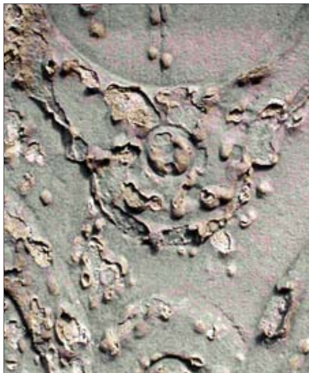
22. Zluszczająca się warstewka kamienia wzmocnionego powierzchniowo.

Istotnym problemem jest dobór nowych cegieł. Powinniśmy kierować się zasadą, że muszą być one zbliżone do „starych” wymiarami, barwą i jej intensywnością oraz właściwościami fizycznymi (zdolność kapilarnego podciągania wody i schnięcia, nasiąkliwość wodą) i mechanicznymi (wytrzymałość na ściskanie). W praktyce jednak konserwatorzy rzadko badają właściwości cegieł, a tym bardziej cegieł nowych. Innymi słowy, stosuje się najczęściej cegły przypadkowe o nieznanach parametrach. Zwykle mają one niską nasiąkliwość, źle podciągają wodę i mają wytrzymałość na ściskanie kilkakrotnie przekraczającą wytrzymałość cegieł gotyckich. Wykonawcy tłumaczą się najczęściej, że nie można kupić w Polsce