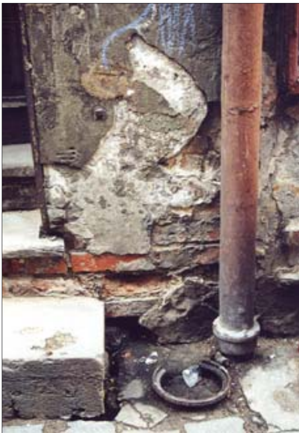
9. Tynk i mur niszczone przez wodę gruntową.