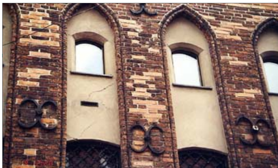
18. Fasada domu ze wstawkami nowych cegieł.

18. Facade of house with inserts of new bricks.