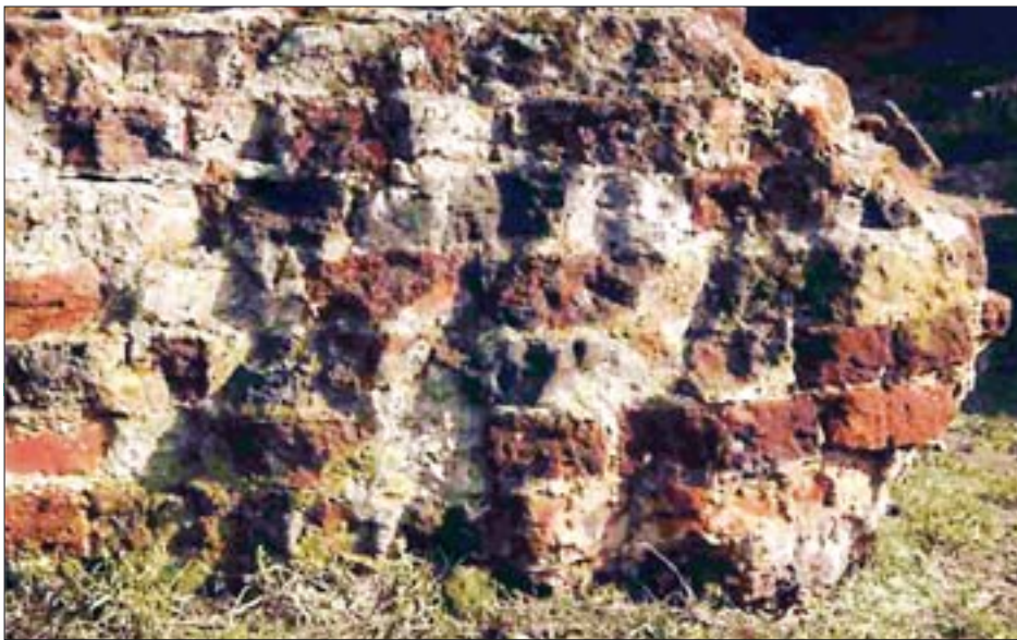
6. Fragment średniowiecznego muru z doskonale zachowaną zaprawą wapienną.

6. Fragment of a mediaeval wall with excellently preserved lime mortar.