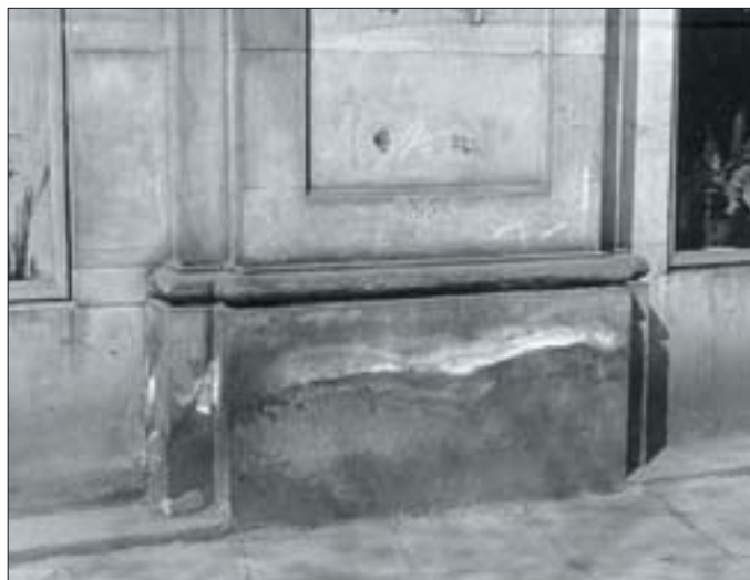
12. Sole wykrystalizowane w górnej partii strefy podciągania wody z ziemi.

12. Salt crystallised in the upper sphere of drawing water from the ground.