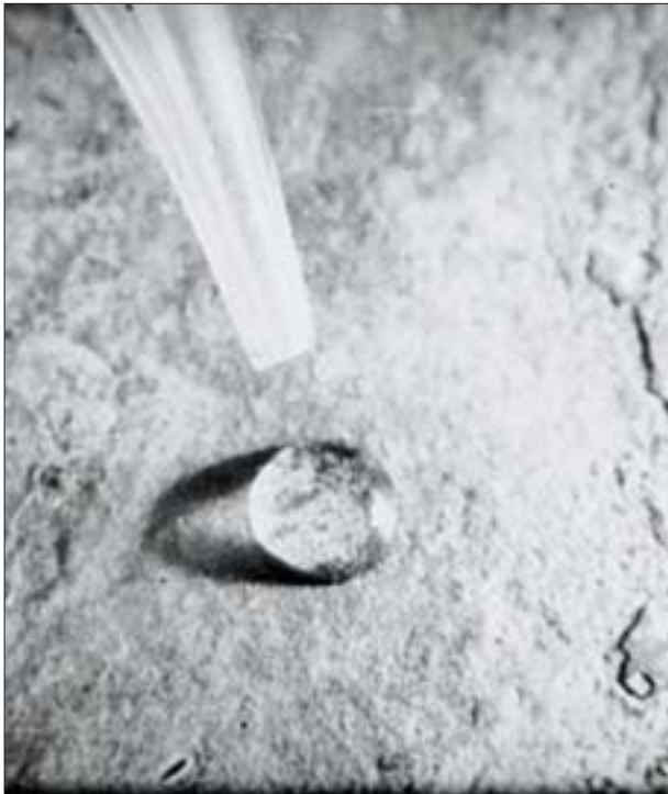
27. Kropla wody nie zwilża i nie wsiąka w zhydrofobizowany piaskowiec, zachowując kulisty kształt. 27. A drop of water does not moisten or seep into sandstone treated with water repellent, and preserves its oval shape.

Hydrofobizacji, także głębokiej, nie można zalecać jedynie w przypadkach, gdy w materiałach występują sole rozpuszczalne w wodzie i gdy obiekt nie jest odizolowany od wody gruntowej. W takim przypadku hydrofobizacja głęboka może przyczynić do szybkiego zniszczenia murów. Prawidłowa hydrofobizacja nie tylko chroni przed działaniem czynników niszczących, lecz także zmniejsza podatność materiałów na zabrudzenie i tworzenie się nawarstwień (osiadające pyły są zmywane przez deszcz). Nie należy hydrofobizować obiektów znajdujących się we wnętrzach, ponieważ nie ma ku temu powodu.