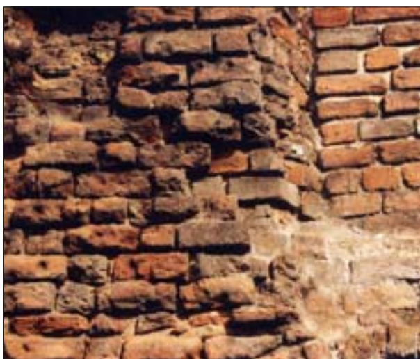
5. Mur z ubytkami w warstwie powierzchniowej rozłożonej i wypłukanej zaprawy wapiennej.

Odpowiedź na pytanie, dlaczego zaprawy wapienne spajające cegły w murach ulegają zniszczeniu, jest stosunkowo prosta – mają one małą wytrzymałość mechaniczną, niedostateczną odporność na wodę i działanie innych czynników atmosferycznych (il. 5). Zgodnie z Polską Normą wytrzymałość na ściskanie zapraw do wznoszenia murów ceglanych powinna wynosić zaledwie 0,2-0,4 MPa (maksymalna 0,8 MPa), przy dużej zarazem nasiąkliwości wodą (15-20% – bad. własne) i dobrych właściwościach kapilarnych (podciągają do wys. 5 cm w czasie 20-30 min – bad. własne).