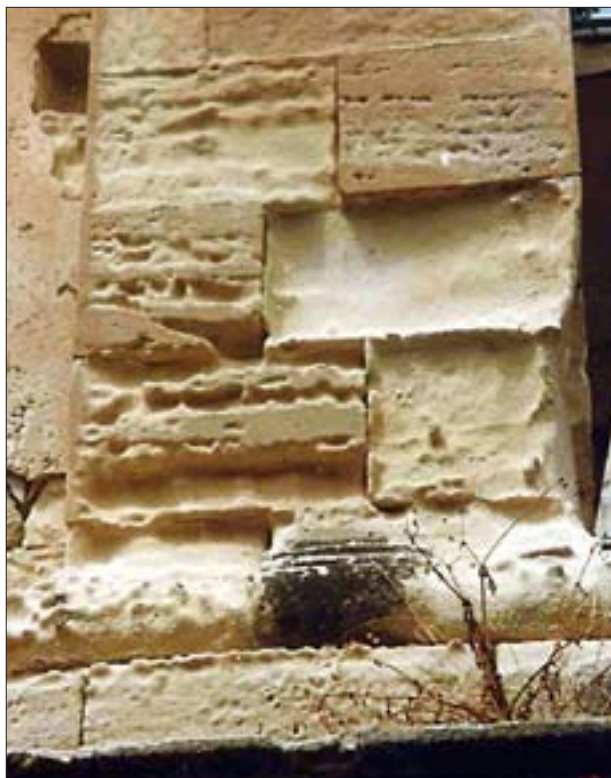
17. Niszczenie elementów kamiennych przez wiatr.

17. Stone elements damaged by wind.