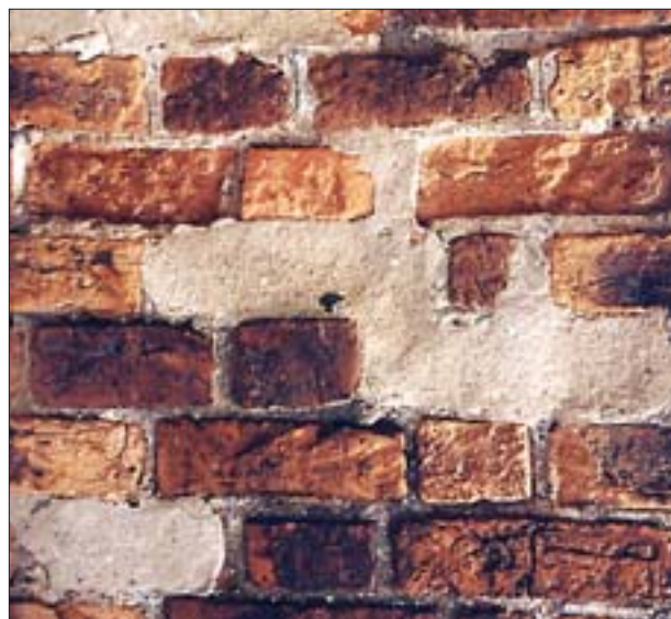
24. Niechlujnie wykonane uzupełnienie ubytków w ceglach. 24. Careless supplementation of gaps in bricks.

W przypadku dezintegracji bądź osłabienia cegły dekoracyjnej lub detalu kamiennego należy poddać je wzmocnianiu strukturalnemu (głębokiemu) za pomocą metod umożliwiających nasycenie obiektu roztworami. Pod tym terminem rozumiemy całkowite przesylenie i całkowite wzmocnienie elementów cienkościennych, a w przypadku grubszych – wzmocnienie co najmniej warstwy osłabionej oraz ok. 2 centymetrowej warstwy zdrowego kamienia czy cegły. Nie należy natomiast wzmocniać cegieł i kamieni powierzchniowo, gdyż zmniejszenie porowatości lub uszczelnienie powierzchni prowadzi do niszczenia warstw wewnętrznych i złuszczenia się utwardzonej warstewki powierzchniowej (il. 22, 23). Do wzmocniania należy stosować roztwory w odpowiednio dobranych rozpuszczalnikach uniemożliwiających migrację środka wzmocniającego do powierzchni w czasie odparowywania rozpuszczalników, nieulegających rozdziałowi fazowemu, niezawierających soli rozpuszczalnych w wodzie i innych szkodliwych substancji.