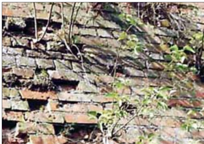
16. Mur niszczoney przez rośliny. 16. Wall damaged by plants.

zamarzania wody w ich szczelinach. Nie zawsze wszystkie pory materiałów wypełniają się wodą i w przypadku spadku temperatury poniżej 0°C zamarzająca woda może przemieszczać się do porów sąsiadujących, niewypełnionych wodą, co osłabia niszczące działanie lodu. Innym pozytywnym zjawiskiem jest przechładzanie wody w kapilarach o małych średnicach, tzn. że ulega ona zamarzaniu poniżej 0°C. I tak na przykład w rurkach o średnicy 1,5 mm woda zamarza w temperaturze -5,5°C, o średnicy 0,25 mm w temperaturze -14°C, a w rurkach o średnicy 0,1 mm w temperaturze -18°C.