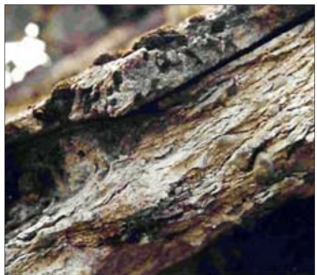
3. Niszczący beton. 3. Concrete undergoing damage.

Cegły różnią się właściwościami mechanicznymi i fizycznymi oraz odpornością na działanie wody i czynników chemicznych. Tak było w wiekach średnich, tak jest i obecnie. Właściwości cegieł zależą od jakości gliny, sposobu jej przygotowania, stosowanych celowo domieszek lub obecności gruboziarnistych domieszek naturalnych (żwir, kamienie) zawartych w glinie, od formowania plastycznego, warunków suszenia i gamowania (magazynowania surówki przeznaczonej do wypalania), temperatury i czasu suszenia, wypalania w odpowiednich temperaturach,