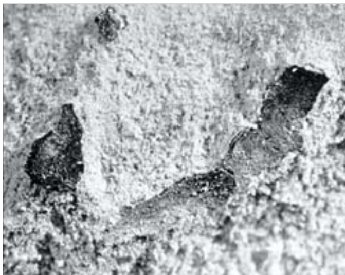
14. Zdezintegrowany wapień wskutek krystalizacji soli.

14. Lime disintegrated due to salt crystallisation.