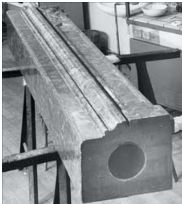
26. Element portalu zrekonstruowany w sztucznym kamieniu.

Zazwyczaj stosuje się dwie metody hydrofobizacji: powierzchniową i głęboką. Hydrofobizacja powierzchniowa jest stosowana najczęściej ze względu na prostotę wykonania i niskie koszty. Jest