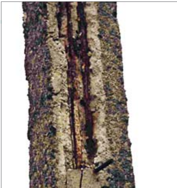
2. Korodujące pręty stalowe niszczą słupy betonowe. 2. Corroding steel rods damage concrete pillars.

Nieprawidłowemu wykonaniu prac konserwatorskich sprzyja łatwy dostęp do różnorodnych materiałów i preparatów konserwatorskich, o których producenci piszą i mówią, że są rewelacyjne, skuteczne i niezastąpione. Reklama tych materiałów działa podobnie jak reklama cudownych środków farmaceutycznych – gdyby im wierzyć, powinniśmy żyć w zdrowiu co najmniej kilkadziesiąt lat dłużej. Niestety, wiara w skuteczność owych środków jest wśród konserwatorów dość powszechna. Jakże wygodnie jest kupić i zastosować polecany przez producentów preparat, zamiast łamać sobie głowę nad doborem określonych materiałów, a następnie trudzić się nad ich przyrządzaniem. Konserwatorzy przyjmują na wiarę opinie wytwórców i nie trudzą się sprawdzaniem jakości i przydatności ich wytworów.