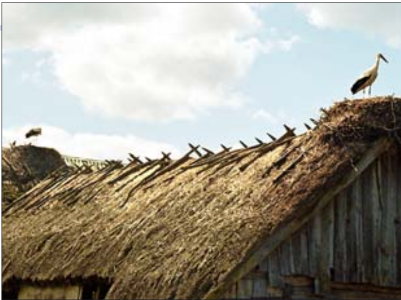
2. Podlaski Szlak Bociani, strzecha w Nawykach, ze zbiorów ROBiDZ w Białymstoku, agencja ELKAM.

2. The Podlasie Stork Trail, thatched roof in Zawyki, from the collections of ROBiDZ in Białystok, the ELKAM agency.