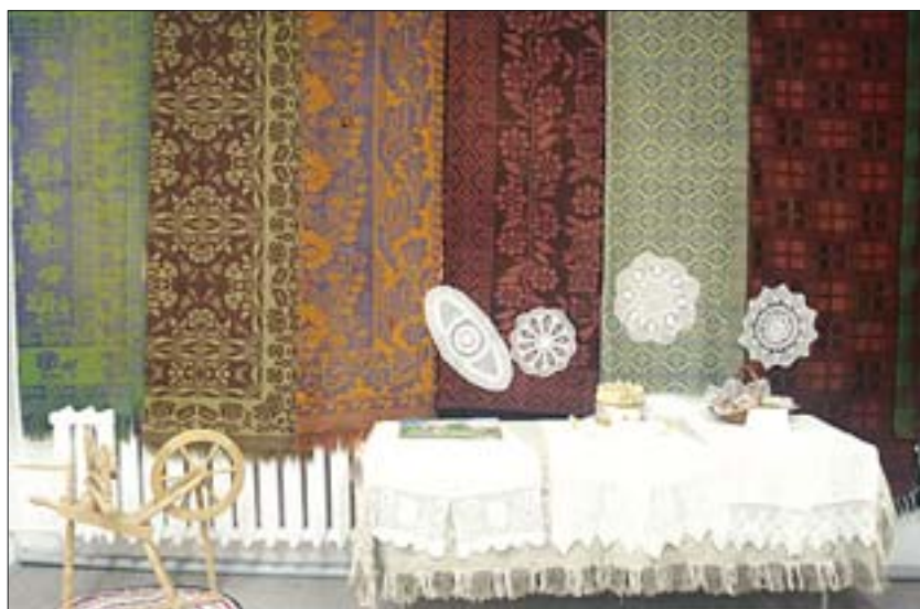
4. Podlaski Szlak Rękodzieła Ludowego, Muzeum Regionalne w Lipsku, ze zbiorów ROBiDZ w Białymstoku, agencja ELKAM.

Kolejne wydawnictwo, którego zleceńodawcą była Podlaska Regionalna Organizacja Turystyczna, to multimedialny