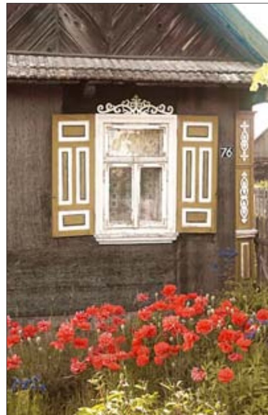
3. Kraina Otwartych Okiennic, Trześcianka, ze zbiorów ROBiDZ w Białymstoku.

Meczety w Bohonikach i Kruszynianach stanowią – nie mający w Polsce analogii – przykład drewnianego budownictwa sakralnego; to dwie główne miejscowości na terenie województwa