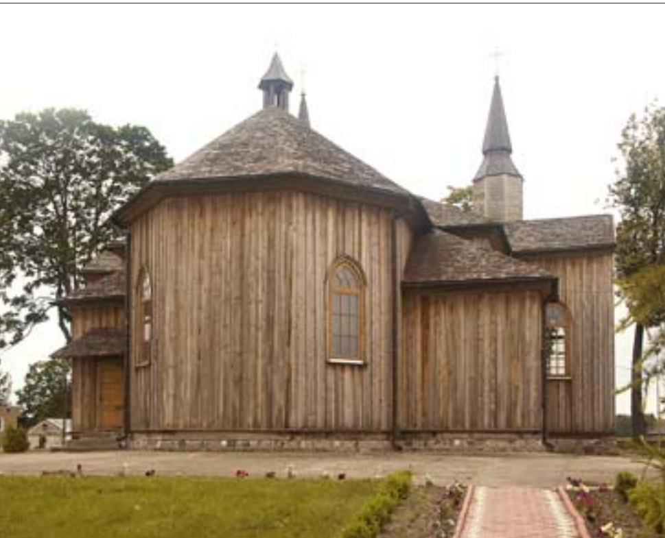
1. Zabytki architektury drewnianej, kościół p.w. Najświętszego Serca Jezusowego w Jeleniewie. Zdjęcie ze zbiorów ROBiDZ w Białymstoku, 2004 r.

Połączenie tych elementów – dziedzictwa kulturowego i piękna krajobrazu – służy skutecznej i atrakcyjnej promocji. Wytyczane szlaki tematyczne i ścieżki kulturowe powstają z myślą o wytrawnym turyście – miłośniku zabytków, krajobrazu, fauny i flory. Uczą, informują i dostarczają wielu wrażeń. Nie sposób wymienić wszystkich, ale warto poznać chociaż kilka z nich.