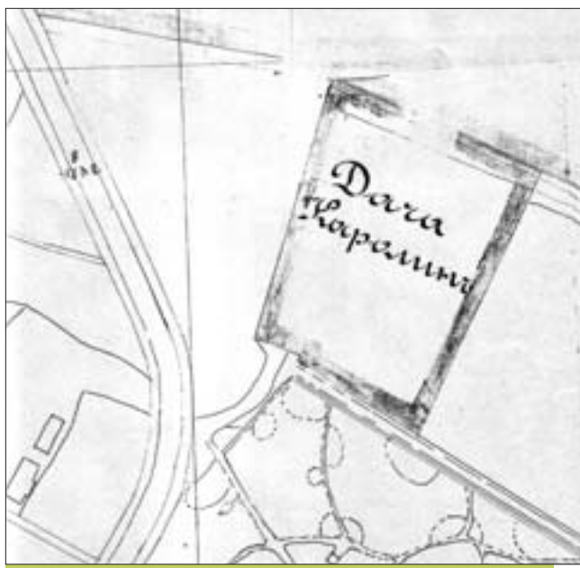
3. Plan z 1902 r. Sąd Rejonowy w Otwocku, KW Mieczysławów A nr 3052. 3. Plan from 1902. Regional Court in Otwock, KW Mieczysławów A no. 3052.