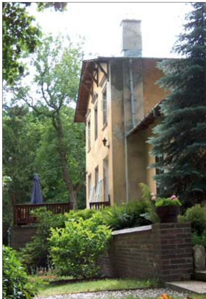
7. Willa Karolin-Marianów. Elewacja wschodnia. Fot. E. Popławska-Bukała, 2005 r.

W zachowanej części pierwotnego założenia, zaprojektowanego dla Karola Jana Szlenkiera przez Waleriana Kronenberga, ograniczonej od zachodu łąką (pierwotnie stawem), od północy rowem