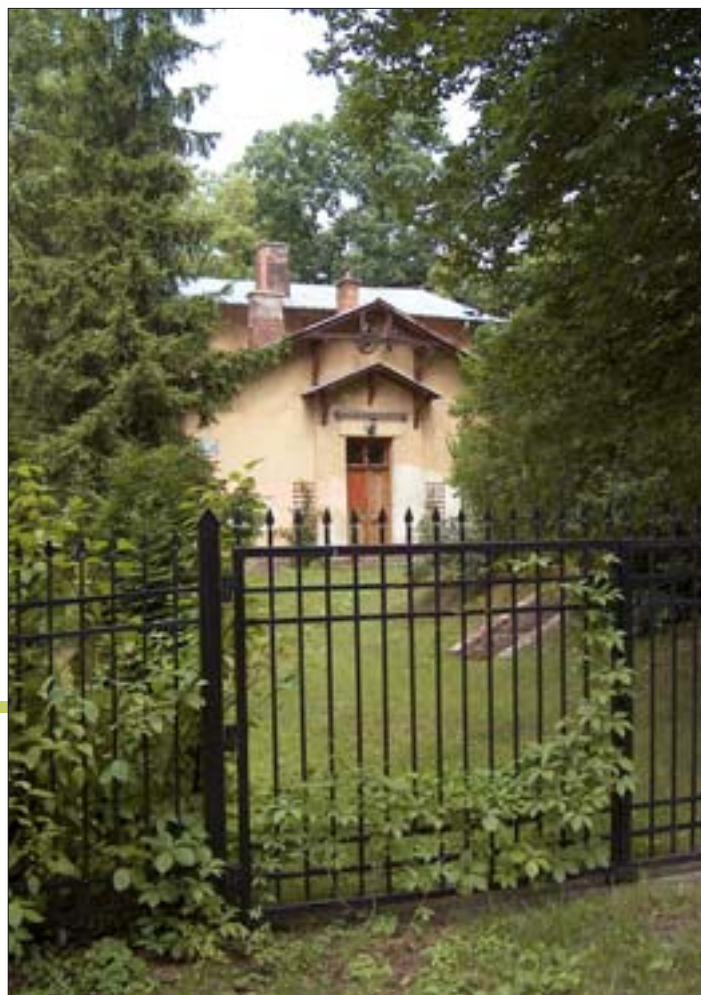
6. Widok założenia od ul. Parkowej. 2005 r.

Roślinność parku skomponowana była z myślą o wykorzystaniu walorów dekoracyjnych poszczególnych gatunków roślin. M. Niklewiczowa pisała: „Ogród dziadków był tak zwany ogrodem angielskim, urządzonym parkowo, tylko przy domu posiadał bardziej geometryczne rozplanowanie właściwe ogrodowi francuskim. Drzewa i krzewy rosły swobodnie, usuwano jedynie dziczki, martwe gałęzie lub