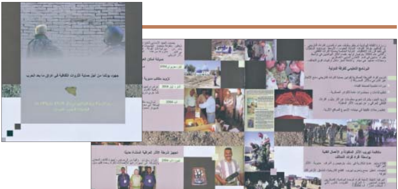
27. Arabska wersja folderu „Działania Polski na rzecz ochrony dóbr kultury w powojennym Iraku”. 27. Arabic version of the leaflet “Polish Activity for the Protection of Cultural Property in Postwar Iraq”.

odpowiednie przygotowanie personelu cywilno-wojskowego do odprawy celnej towarzyszącej wyjazdom z Iraku oraz uświadomienie żołnierzom odpowiedzialności karnej za udowodnione naruszenia obowiązujących w tej materii przepisów. Zgodnie z sugestią dowództwa żandarmerii, specjaliści organizowali również regularne, cotygodniowe dyżury, w ramach których udzielano wszystkim zainteresowanym bezpłatnych konsultacji dotyczących wartości historycznej konkretnych przedmiotów, a także wyjaśniano wątpliwości związane z zasadami kontroli bagażu i rodzajami obiektów objętych zakazem wywozu.