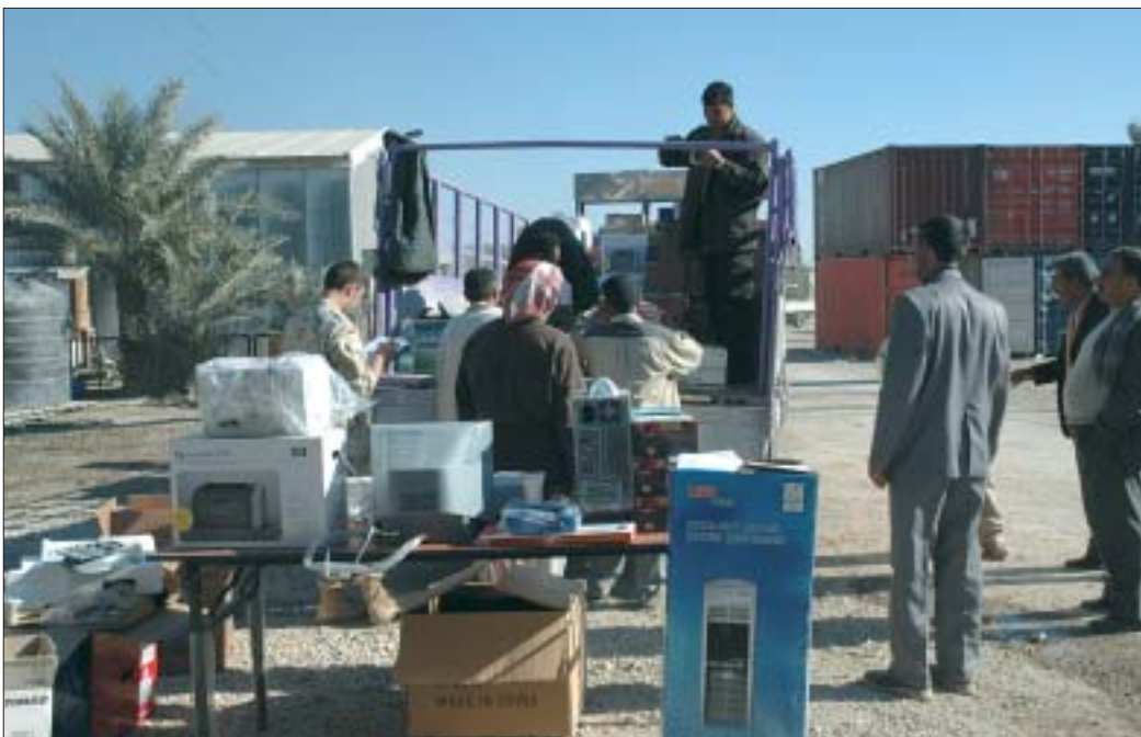
23. Wsparcie dla Instytutu Archeologii na Uniwersytecie Babilońskim w Al-Hilla.

Wyposażenie inspektoratów starożytności w sprzęt komputerowy było jedną z potrzeb najczęściej sygnalizowanych przez stronę iracką. Wiosną 2004 r. zakupiono kilkanaście dobrej klasy zestawów komputerowych wraz z oprogramowaniem, a także drukarki, skanery i aparaty cyfrowe. Sprzęt trafił do muzeum Babilonu oraz inspektoratów w Babilonie, Karbali i Nadżafie. Informatycy, zatrudnieni przez