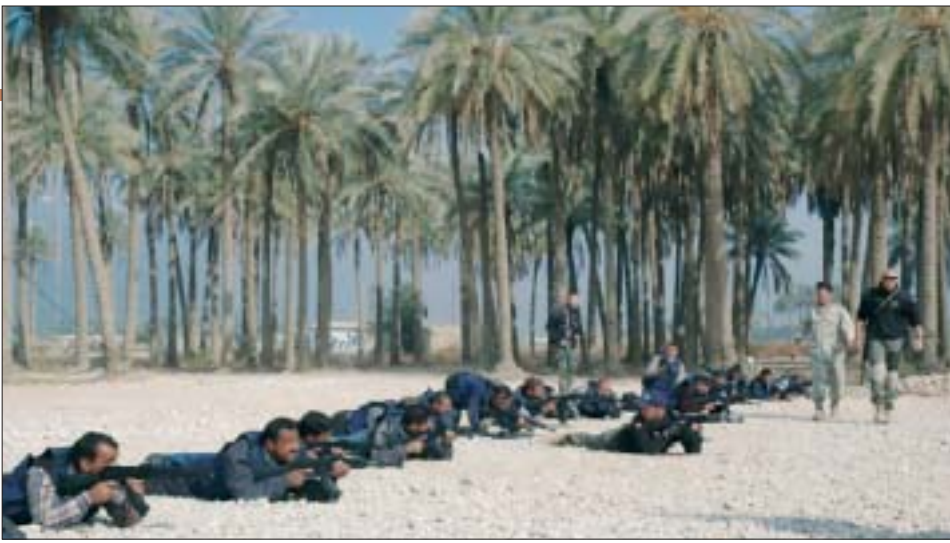
24. Szkolenie irackiej policji archeologicznej. 24. Training the Iraqi Archaeological Police.

dostarczające sprzęt irackie firmy, przeprowadzili, objęty warunkami kontraktu, podstawowy kurs obsługi komputerów dla 20 członków personelu biur starożytności. Najlichniesz placówka w prowincji Babil otrzymała dodatkowo profesjonalny teodolit oraz zestaw multimedialny (laptop, rzutnik i kamera cyfrowa), przydatny w pracach inwentaryzacyjnych i działalności dydaktycznej.