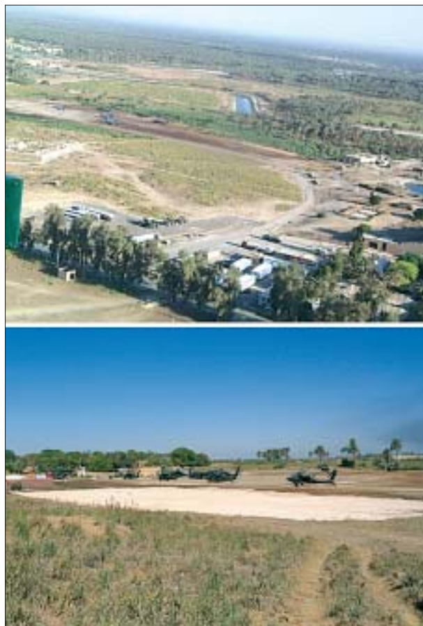
15. Lądowisko dla helikopterów. 15. Helicopter landing field.

Temu celowi przysłużyło się nawiązanie regularnej współpracy z miejscową placówką Służby Starożytności oraz irackimi inspektorami i archeologami