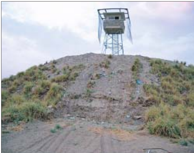
13. Wieża obserwacyjna ustawiona na częściowo zniwelowanych strukturach archeologicznych.

13. Observation tower placed on partially levelled archaeological structures.