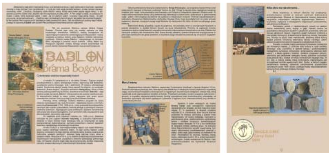
28. Broszury informacyjne dla personelu wojskowego PKW. 28. Information brochures for the PKW military personnel.

W tym czasie Minister Kultury RP skierował listy do Dyrektora Generalnego UNESCO i Ministra Kultury Tymczasowej Rady Zarządzającej Iraku,