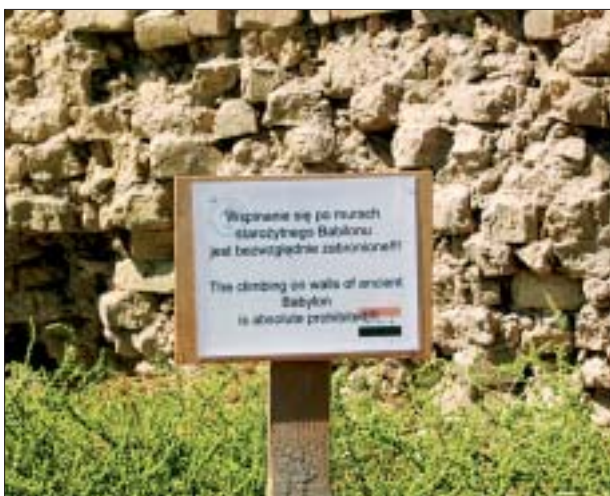
14. Tablica informacyjna przy ogrodzeniu terenu wykopalisk archeologicznych (pałace Centralny i Południowy).

14. Information plaque on the fencing around the archaeological excavations site (Central and Southern Palace).