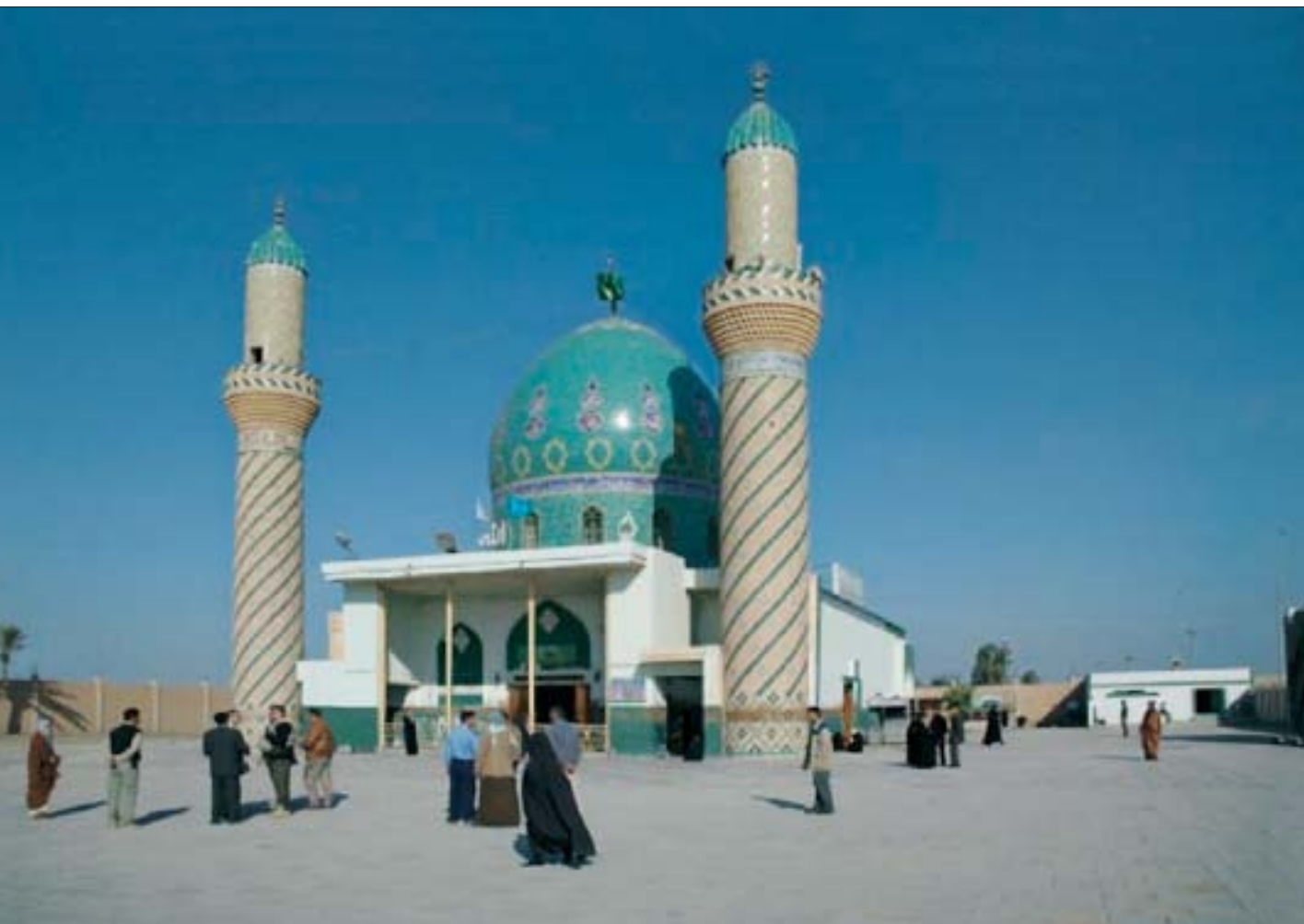
7. Zabytkowy zespół z grobem szahida Abu al-Fathal'a w Diwanija (prowincja Kadisiya) po renowacji.