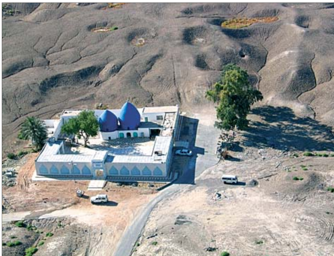
10. Renowacja współczesnego meczetu imama Hadż Omrana ibn Alego. 10. Renovation of the contemporary Imam Hadth Omran ibn Ali mosque.

Merytoryczną koordynacją działań w zakresie ochrony dziedzictwa kulturowego w Iraku zajmowało się Biuro Spraw Obronnych Ministerstwa Kultury RP, pozostając w stałym kontakcie zarówno z przebywającymi tam specjalistami, jak i przedstawicielami innych komórek Ministerstwa Kultury oraz resortów obrony narodowej i spraw zagranicznych. Na podstawie meldunków i sprawozdań z Iraku, po konsultacjach, biuro podejmowało decyzje dotyczące działań na ziemi irackiej. Ten tryb postępowania sprawdził się m.in. podczas odbudowy zniszczonego