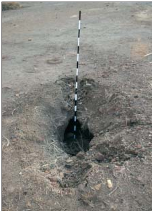
8. Podkop rabunkowy w pobliżu bramy Pałacu Północnego. 8. Robbers' tunnel near the Northern Palace gate.

Zanim scharakteryzujemy specyfikę Centralno-Południowej Strefy Stabilizacyjnej, która stała się domeną polskiej odpowiedzialności i działań naszych archeologów, należy przypomnieć okoliczności kulturowe i zjawiska kryminalne wywołane wojną, które występowały w Iraku w momencie pojawienia się w nim Polskiego Kontyngentu Wojskowego i polskich archeologów.