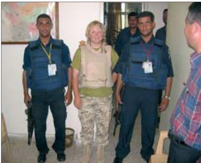
25. Wyposażanie irackiej policji archeologicznej w sprzęt i uzbrojenie.

Powstanie irackiej policji archeologicznej stworzyło konieczność zapewnienia funkcjonariuszom odpowiedniego wyposażenia i ekwipunku. Specjaliści ds. ochrony dziedzictwa kulturalnego wspólnie z komendantami jednostek policji archeologicznej w prowincjach Babil i Nadżaf ustalili listę podstawowych potrzeb, obejmującą m.in.: środki łączności (krótkofalówki, telefony komórkowe), samochody terenowe i motocykle, umundurowanie, a także uzbrojenie. Wyposażenie indywidualne (kamizelki kuloodporne, hełmy kompozytowe, detektory metalu, lornetki polowe) otrzymali iraccy policjanci z Babilonu i Al-Hilla. Przeprowadzono także remont budynku przeznaczony na siedzibę jednostki odpowiedzialnej za obiekty historyczne w rejonie Babilonu i w całej prowincji. Łączna wartość projektów służących przygotowaniu i wyekwipowaniu irackiej policji archeologicznej wyniosła blisko 200 tys. USD.