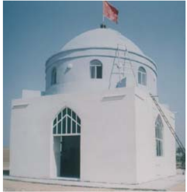
20. Renowacja zespołu zabytkowego Amama Abraheema bin Abd Allah al Aahth w Al-Qassim. 20. Renovation of the Amam Abraheem bin Abd Allah al Aahth complex in Al-Qassim.