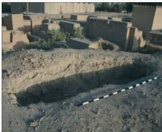
4. Stanowiska ogniowe, schrony i punkty obserwacyjne wojsk irackich z okresu działań wojennych marzec-kwiecień 2003.