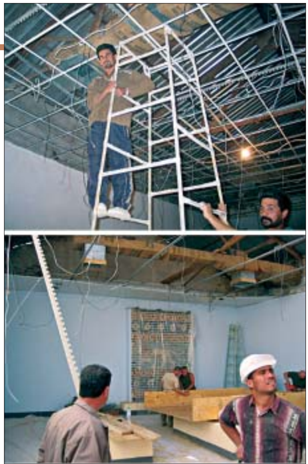
22. Przebudowa konstrukcji dachu nad główną halą ekspozycyjną muzeum Babilonu.