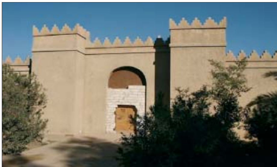
16. Muzeum Hammurabiego. 16. The Hammurabi Museum.

Propozycje działań prewencyjno-konserwatorskich uzyskały akceptację dowództwa dywizji (15 grudnia 2003 r.). We współpracy z dywizyjnymi komórkami inżynieryjnymi i infrastrukturalnymi zdecydowano: