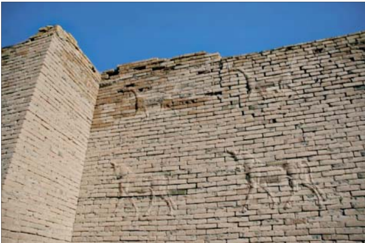
11. Wschodnia ściana Bramy Isztar. 11. Eastern wall of the Ishtar Gate.

Zabytkom zagrażała i zagraża nadal codzienna działalność miejscowej ludności. Nagminne jest zakładanie niewielkich cegielni, wykorzystywanie zabytkowego gruzu do produkcji materiału budowlanego (np. na obszarze miasta starożytnego w Borsippa). Często są przypadki rozbiórki relikwów architektonicznych w celu pozyskania budulca (Hanaruba), samowolnego wznoszenia budynków mieszkalnych na obrzeżach stanowisk archeologicznych (Kufa), demontaże zabytkowych ogrodzeń (Tell el-Ochajmir – Kisz).