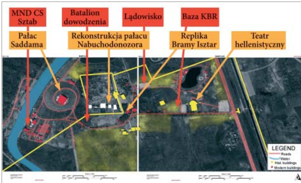
2. Schemat rozmieszczenia obiektów wojskowych bazy Alpha na planie stanowiska archeologicznego w Babilonie. 2. Schemes of distribution of military objects in Alpha base on a plan of the archaeological site in Babylon.

W tym kontekście znaczenia nabiera fakt, że prace nad inwentaryzacją zabytków Babilonu oraz opracowaniem harmonogramu i procedury przekazania terenu obozu wojskowego, trwające od czerwca do listopada 2004 r., prowadziła specjalna komisja robocza ( Babylon Working Group ), powołana przez główne dowództwo sił koalicyjnych w Bagdadzie. W jej pracach, oprócz Polaków i Amerykanów, brali udział przedstawiciele irackiego Ministerstwa Kultury oraz Służby Starożytności. Nie zgłaszano wówczas zastrzeżeń do przedstawionego w raporcie stanu