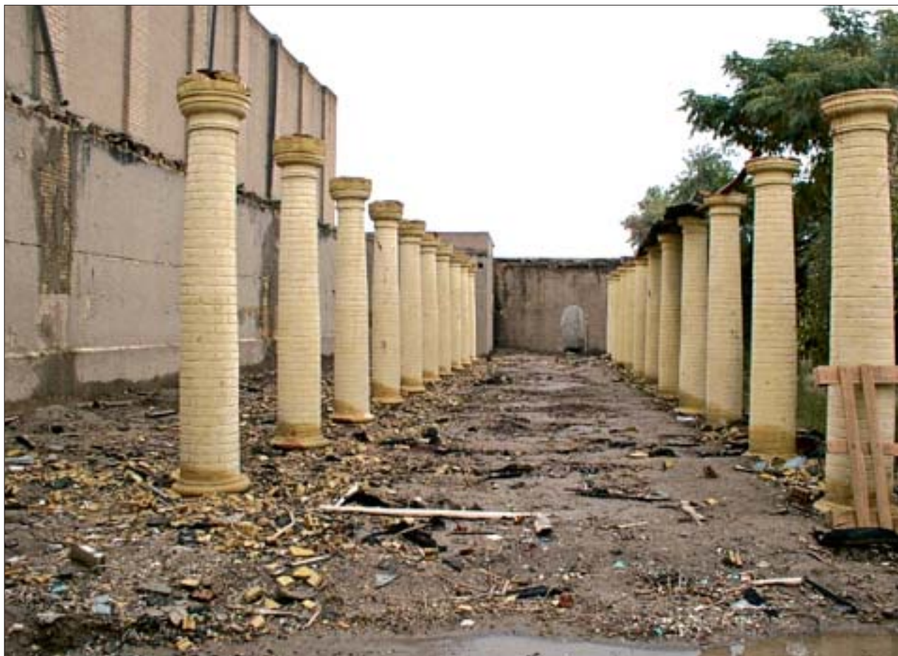
3. Patio teatru hellenistycznego. Zniszczenia pod wpływem czynników atmosferycznych. 3. Patio of a Hellenistic theatre. Damage caused under the impact of atmospheric factors.