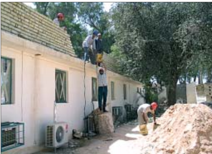
21. Remont pomieszczeń biurowych muzeum Babilonu, bocznych sal wystawienniczych, odnowienie dziedzińca muzealnego, instalacja bram i drzwi oraz tablic informacyjnych.

Działania specjalistów ochrony dziedzictwa kulturowego pozostawały w ścisłym związku z planami i poczynaniami lokalnych służb. Od początku misji trwały kontakty z przedstawicielami irackiej Służby Starożytności na wszystkich jej poziomach: od prowincjonalnych inspektoratów, przez Państwową Radę