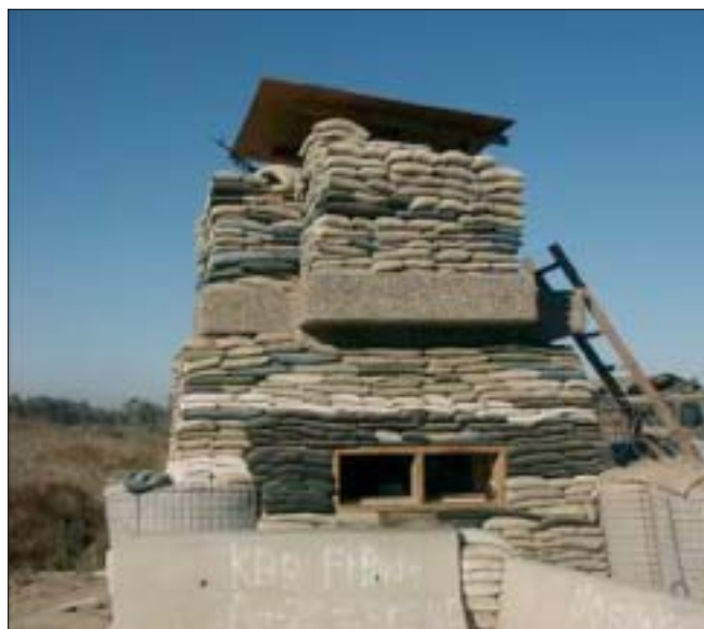
5. Umocnienia bazy Alpha. Piasek na potrzeby konstrukcji obronnych nie był pozyskiwany ze struktur antropogenicznych.