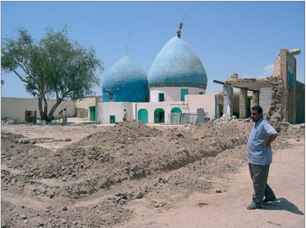
9. Renowacja współczesnego meczetu imama Hadż Omrana ibn Alego. 9. Renovation of the contemporary Imam Hadth Omran ibn Ali mosque.

Cywilizacje Sumerów, Asyryjczyków, Babilończyków czy Partów pozostawiły na irackiej ziemi materialne ślady w postaci ruin miast, świątyń, pałaców oraz cmentarzyisk. Współczesny Irak jest dla archeologów ważnym, choć mało poznanym, regionem Bliskiego Wschodu. Według oficjalnego rejestru Państwowej Rady Starożytności i Dziedzictwa w Bagdadzie, w Iraku znajduje się 10 tys. zinventaryzowanych stanowisk archeologicznych i innych obiektów zabytkowych. Są wśród nich tak znane miejsca historyczne, jak: Ur, Niniwa, Samarra, Ktezyfon, Nimrud, Babilon czy Uruk. Do dziś zaledwie dwa stanowiska, Hatra i Aszur, położone w północnym Iraku, wpisane zostały na Listę Światowego Dziedzictwa UNESCO.