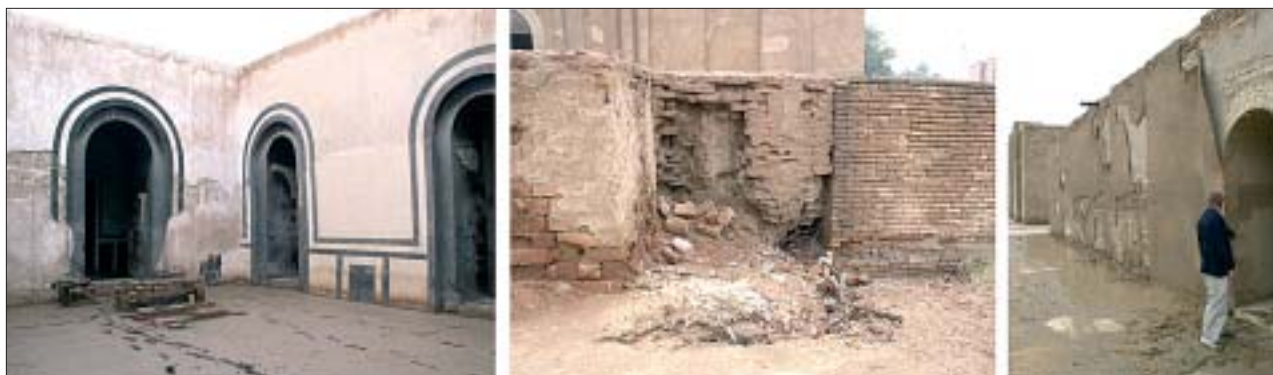
12. Zniszczenia będące efektem działania czynników atmosferycznych. 12. Damage caused by atmospheric factors.

Wiele prowincjonalnych muzeów straciło w wyniku kradzieży całe wyposażenie. Placówka w Karbali np. nie może podjąć działalności z powodu niejasnej sytuacji lokalowej, a budynek muzeum regionalnego w Kufa został zajęty przez bojowników milicji szyickiej. Skutek jest taki, że pracownicy miejscowego inspektoratu starożytności zmuszeni byli – wraz z pochodzącymi z prac wykopaliskowych zbiorami – przenieść się do prowizorycznych baraków.