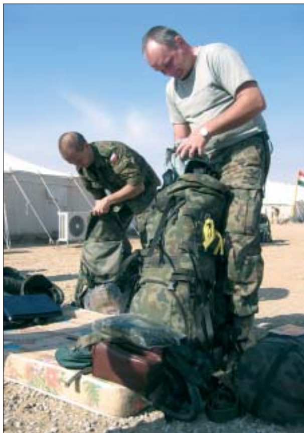
26. Działania prewencyjne (przeгляд bagażu) podczas zmiany PKW prowadzone pod nadzorem archeologów-specjalistów i żandarmerii.

W czasie odbywania służby przez II zmianę PKW cyklicznych pogadarek wysłuchała większość polskich pododdziałów stacjonujących w głównych bazach strefy stabilizacyjnej. Celem spotkań było