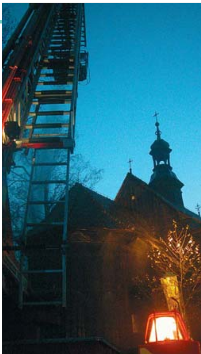
9. Ćwiczenia jednostek Państwowej Straży Pożarnej w zabytkowym kościele w Wieliczce.

9. State Fire Brigade units practising in the historical church in Wieliczka.