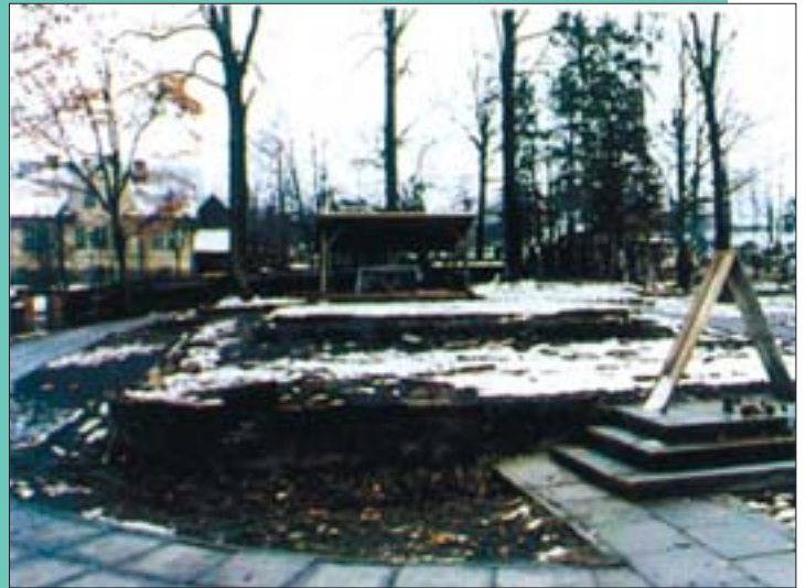
2. Kościół w Łęknicy przed pożarem i to, co po nim pozostało. 2. The church in Leknica prior to fire and remnants of the building.

jest to, że wśród zaistniałych zdarzeń zdecydowanie przeważały pożary małe, którym nie towarzyszyły znaczne straty. W latach 1999-2002 odnotowano łącznie 646 pożarów w obiektach użyteczności publicznej (szczegóły przedstawiono w tab. 1). Niezwykle ciekawa jest analiza przyczyn powstawania pożarów w 2002 r. Wynika z niej, że dwie podstawowe przyczyny powstawania pożarów, to nieostrożność osób dorosłych (60 przypadków) oraz umyślne podpalenie (45 przypadków). O powstaniu pożaru „czynnik ludzki” decydował w 105 na 155 przypadków. Nad tym zestawieniem przyczyn należy się bardzo poważnie zastanowić. W większości analiz i ocen dotyczących przyczyn powstania pożarów zawsze wysoko oceniano niebezpieczeństwo umyślnych podpałów. W następnej kolejności jako przyczyny powstania pożarów wymieniano zwykle wady instalacji elektrycznych, grzewczych oraz ich nieprawidłową eksploatację. Tymczasem okazuje się, że 2/3 przypadków pożarów związanych jest z działaniem (lub zaniechaniem działania) człowieka. Można dalej wnioskować, że zdecydowane ograniczenie wpływu „czynnika ludzkiego” jako przyczyny powstania pożaru może przynieść zdecydowaną poprawę stanu bezpieczeństwa pożarowego zabytków. Z takiego rozumowania nie można wyciągnąć wniosku, że w bieżącej profilaktyce przeciwpożarowej nie należy zwracać uwagi na stan instalacji technicznych. Tak nie jest. Ich prawidłowe wykonanie i właściwa eksploatacja są niezbędnym elementem bezpiecznego obiektu.