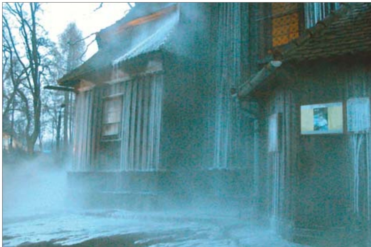
4. Zastosowanie systemu gaszenia mgłą wodną w praktyce. Pierwszy krok w ochronie zabytków drewnianych został zrobiony.

Minęło kilka lat. W 2002 r. – po analizie powyższych przedstawionych doświadczeń – prace nad przygotowaniem własnego rozwiązania technicznego z zastosowaniem mgły wodnej do gaszenia pożarów podjęła krakowska firma SUPO-CERBER. Szczególną uwagę trzeba zwrócić na założenia, które towarzyszyły powstaniu systemu gaszenia mgłą wodną. Po pierwsze, użycie taniego czynnika gaszącego, jakim jest woda, rozpylona do minimalnych cząsteczek, tłumi pożar, nie wyrządzając jednocześnie szkód w ratowanym obiekcie. Zgodnie z normą NFPA 750 1 , mgła wodna to rozpylona woda, której średnice kropeł w 99% całkowitej jej masy są mniejsze od 1 mm. Woda, zdaniem specjalistów z Centrum Naukowo-Badawczego Ochrony Przeciwożarowej w Józefowie, jest zdecydowanie jednym z najlepszych mediów gaśniczych 2 . Technika mgły wodnej, w porównaniu do innych systemów wykorzystujących wodę pozwala znacznie skuteczniej wykorzystać jej zalety. W stosunku do innych wodnych instalacji gaszących (zraszacze czy tryskacze) efektywność wykorzystania mgły wodnej wzrasta kilkudziesięciokrotnie.