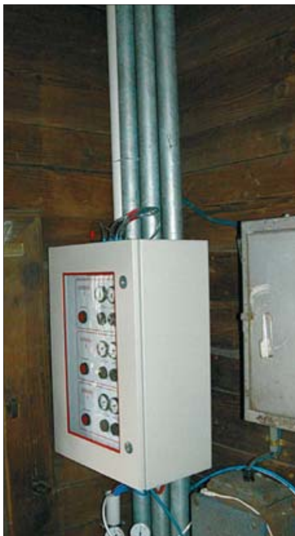
8. Centralka systemu została umieszczona w zakrystii.

Oprócz prezentacji działania systemu na makiecie kościoła (model spalonego kościoła w Woli Justowskiej wykonany w skali 1:10) uczestnicy mogli zobaczyć działanie systemu zainstalowanego w zabytkowym kościele św. Sebastiana w Wieliczce. Tego dnia pierwszy system gaszenia mgłą wodną został oddany do eksploatacji. Nie będzie chyba przesadą, jeśli powiem, że działanie systemu zrobiło na wszystkich uczestnikach spotkania ogromne wrażenie. Kościół w Wieliczce nie należy do najmniejszych zabytków drewnianych. To właśnie jego wielkość, w połączeniu z możliwością gaszenia ewentualnego pożaru powstałego na zewnątrz, była pewnego rodzaju zaskoczeniem. W pokazie brali udział strażacy, którzy wykorzystali tę sytuację do przeprowadzenia ćwiczeń w ratowaniu zagrożonego zabytku.