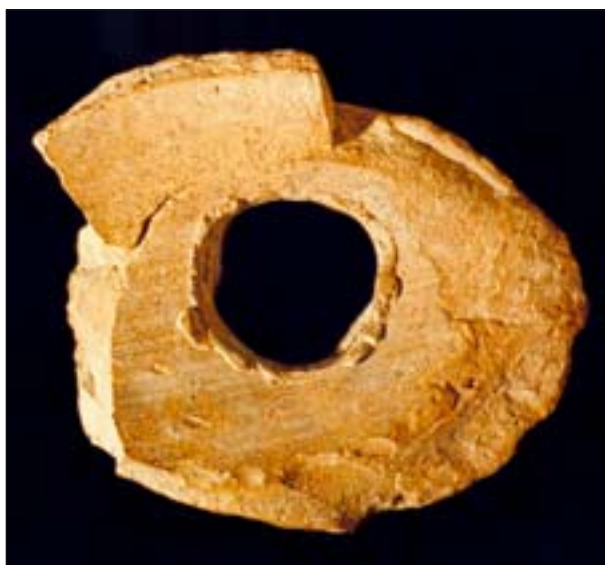
17. Fragment brzuśca askosu. Otwór przebito w brzuścu naczynia w miejscu łączenia z hippokampem. MNW 142264/A.

W literaturze historycznej podnoszone jest wielokrotnie znaczenie attyckich lektyów białogruntowych, jako naczyń poprzedzających omawiane w tej pracy grobowe naczynia apulijskie. Uwagę zwracają wspólne dla tych naczyń cechy. Są to naczynia przeznaczone na potrzeby kultu zmarłych i wykonane