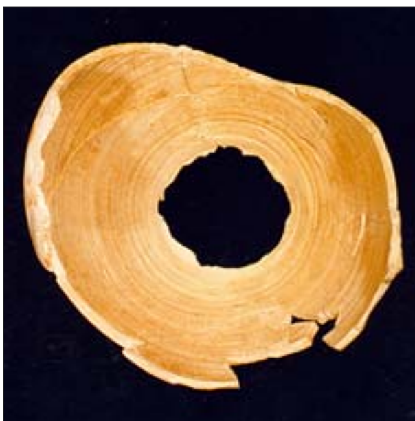
13. Fragment wnętrza askosu. Widoczne ślady toczenia na kole garn- carskim oraz nierówne krawędzie ścianek w miejscu niewykona- nego dna naczynia. MNW 142264/A.

Szeroko otwarte oczy zaznaczają się delikatnie i nie- zbyt wyraźnie. Całą twarz, z wyjątkiem podbródka, otaczają krótkie, gęste włosy. Wymodelowane są nie- starannie w formie masywnych brył o płytkich relie- fowych podziałach sugerujących kosmyki, w których należy dopatrywać się węży. W porównaniu z przed- stawieniem głowy na opisanej wcześniej pokrywie od pyksis ta płaskorzeźba wyraźnie ustępuje jej za- równo pod względem jakości technicznego wykona- nia, jak i artystycznego wyrazu.