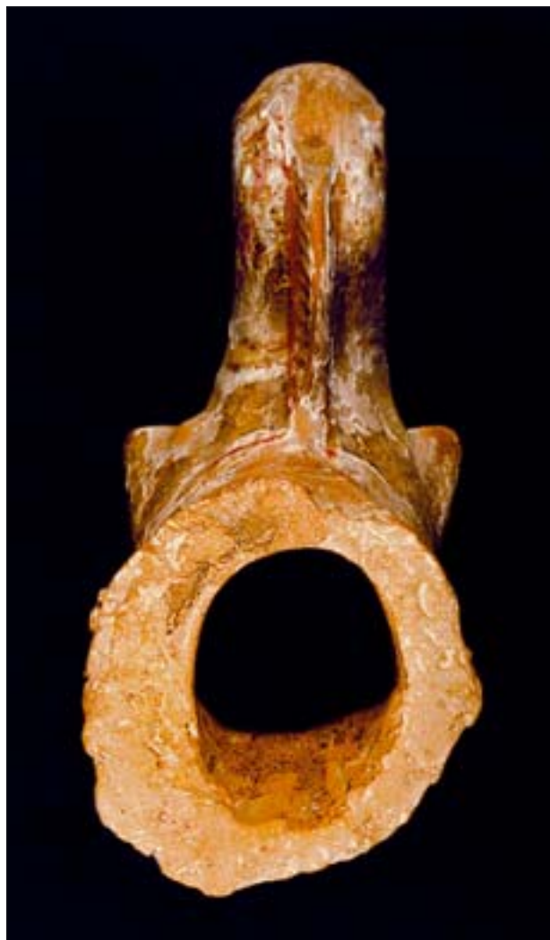
16. Hippokamp z askosu. Element zdemontowany w trakcie konserwacji. MNW 142264/A.

16. Hippocampus from an askos. Element dismantled in the course of conservation. MNW 142264/A.