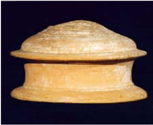
10. Pokrywa od pyksis. MNW, nr inw. 198246. 10. Pyxis lid. MNW, inventory no. 198246.