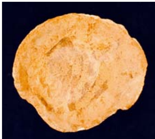
15. Odcisnięta w formie głowa Gorgony z askosu. Odwrocicie. MNW 142264/A. 15. Head of a Gorgon from an askos. Reverse. MNW 142264/A.

Przy formowaniu gliny ceramicznej wykorzystano równolegle dwie techniki – toczenia na kole garncarskim (il. 13) oraz wyciskania elementów dekoracji rzeźbiarskiej w formach. W zależności od stopnia skomplikowania elementów zastosowano formy jednoelementowe lub złożone z dwóch części. W pierwszym typie form wykonano płytkie elementy dekoracji reliefowej, jak np. głowy Gorgony na pokrywach od pyksis (il. 6) i askosie (il. 14, 15). Formy złożone stosowano do modelowania pełnoplastycznych elementów dekoracji rzeźbiarskiej. W ten sposób ukształtowano plastyczny brzusiec oinochoe oraz protomy hippokampów zdobiących frontalną część askosu (il. 16).