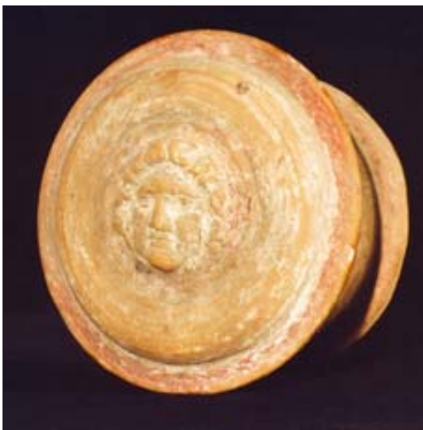
11. Pokrywa od pyksis. MNW, nr inw. 148068. 11. Pyxis lid. MNW, inventory no. 148068.