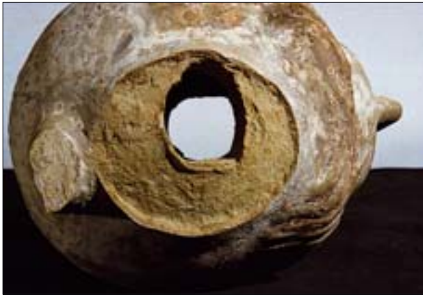
18. Otwór w brzuchu oinochoe w miejscu połączenia z szyjką naczynia. MNW 139605.

18. Opening in the belly of a wine container in the place of a link with the vessel's neck. MNW 139605.