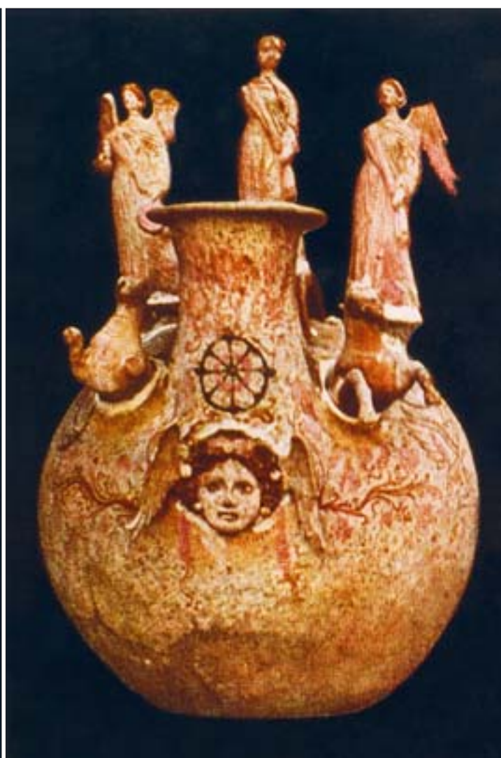
3. Askos z Canosy. 3. Askos from Canosa.