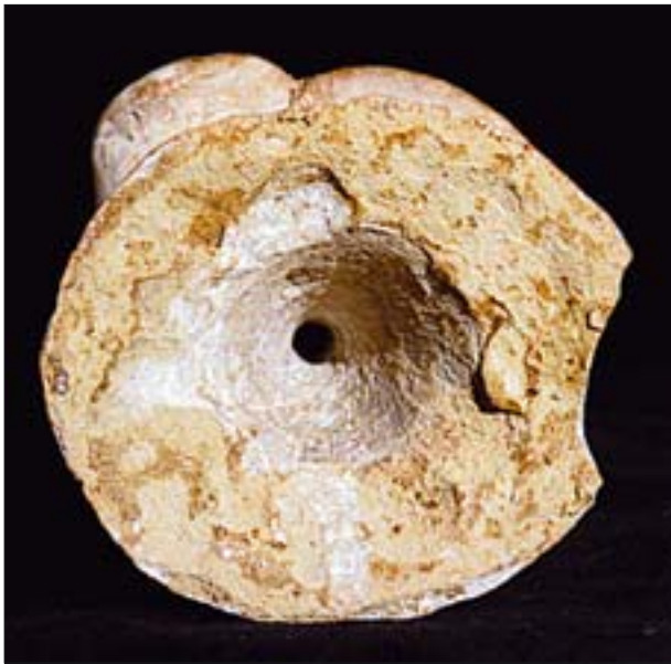
19. Otwór w szyjce oinochoe w miejscu połączenia z brzusem. Jego niewielka średnica nie ma znaczenia funkcjonalnego, umożliwia natomiast przepływ gorącego powietrza w trakcie wypału. MNW 139605.

Porównanie technologii attyckich lekytów biało-gruntowanych i omawianych naczyń hellenistycznych wskazuje na bardzo wyraźne różnice. Niestety, założenia powyższego artykułu nie pozwalają na szersze omówienie tego zagadnienia. Dlatego sygnalizujemy