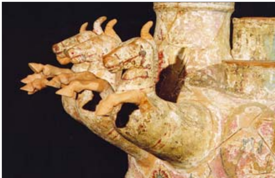
8. Galopująca kwadryga, fragment dekoracji rzeźbiarskiej askosu. MNW, nr inw. 142264/A.

Przedmiotem realizowanego przez autora artykułu programu badawczego jest grupa południowoitalskich hellenistycznych zabytków ceramicznych. Są to sepulkralne naczynia wytworzone w okresie od IV do II w. p.n.e. Stanowią one charakterystyczną i unikalną zarazem grupę, zarówno w bogatej warstwie przekazu ikonograficznego, jak i pod względem technologii wykonania łączącej rzeźbę pełnoplastyczną, płaskorzeźbę i malarstwo. Sepulkralny charakter tej ceramiki przyczynił się do powstania wielowarstwowej i skomplikowanej w swej warstwie znaczeniowej dekoracji. Jednocześnie świadome wykonywanie przedmiotów kultowych, przeznaczonych do obrzędów pogrzebowych i składania ich w grobach, w istotny sposób wpływało na technologię produkcji.