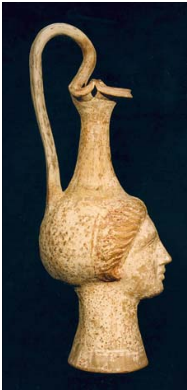
9. Oinochoe. MNW, nr inw. 139605.

Dolną krawędź wazy zdobią ornamenty biegnących fal i umieszczony nad nim jajownik. Znajduje się on również na powierzchni przy krawędziach wszystkich wylewów oraz w tylnej części wazy. Rysunek ornamentu wykonano czarną kreską, a poszczególne elementy (tzw. wole oczka) wypełniono przemiennie kolorami niebieskim i różowym na obrzeżach, środek pozostawiono biały.