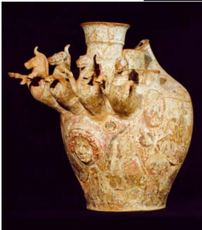
7. Askos. MNW, nr inw. 142264/A.