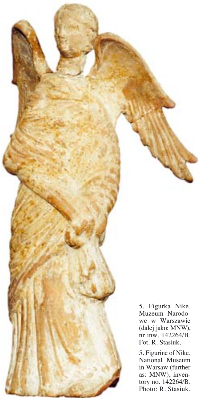
5. Figurka Nike. Muzeum Narodowe w Warszawie (dalej jako: MNW), nr inw. 142264/B.

Polichromia na tych naczyniach wykonywana była na białym gruncie nałożonym bezpośrednio na czerep. Grunt ten, niepokryty farbą w niektórych miejscach, pełnił także rolę warstwy barwnej, np. w partiach karnacji płaskorzeźbionych głów kobiecych, w udrapowanych szatach terakotowych figurek, w rzeźbionych wyobrażeniach zwierząt. Tło dla przedstawień malarskich stanowiły zazwyczaj gładkie płaszczyzny różu pokrywające brzuśce naczyń, niekiedy fragmenty mogą być też pokryte czerwienią. Same sceny, a właściwie kompozycje złożone z poszczególnych postaci, głównie fantastycznych stworów morskich, delfinów, stylizowanych rozet, palmet, kreślone były czarną lub brązową linią, wypełnianą następnie płaskimi