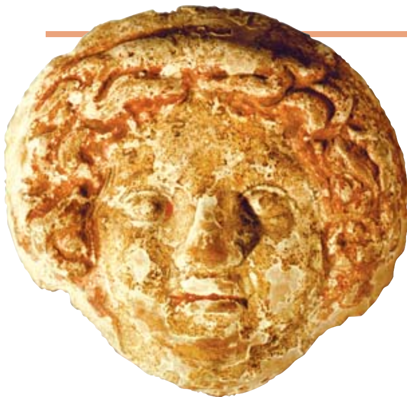
14. Odcisnięta w formie głowa Gorgony z askosu, po zdemontowaniu w trakcie konserwacji. MNW 142264/A. 14. Head of a Gorgon from an askos after dismantling in the course of conservation. MNW 142264/A.