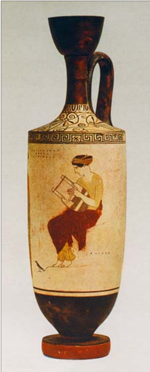
2. Lekyt białogruntowy. 2. White-ground lecythus.

Najczęściej spotykanymi darami grobowymi była ceramika. Naczynia codziennego użytku, dekorowane w stylu epoki, składali w grobach zarówno bogaci, jak i najubożsi. Niektóre typy waz cieszyły się szczególnym powodzeniem, ale niemal zawsze były to naczynia związane też ze światem żyjących.