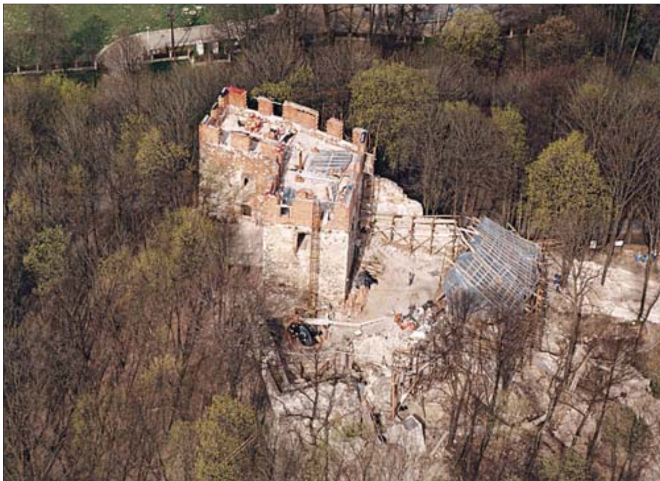
5. Widok zamku od południa, Widok lotniczy. 5. View of castle from the south – bird's eye view.