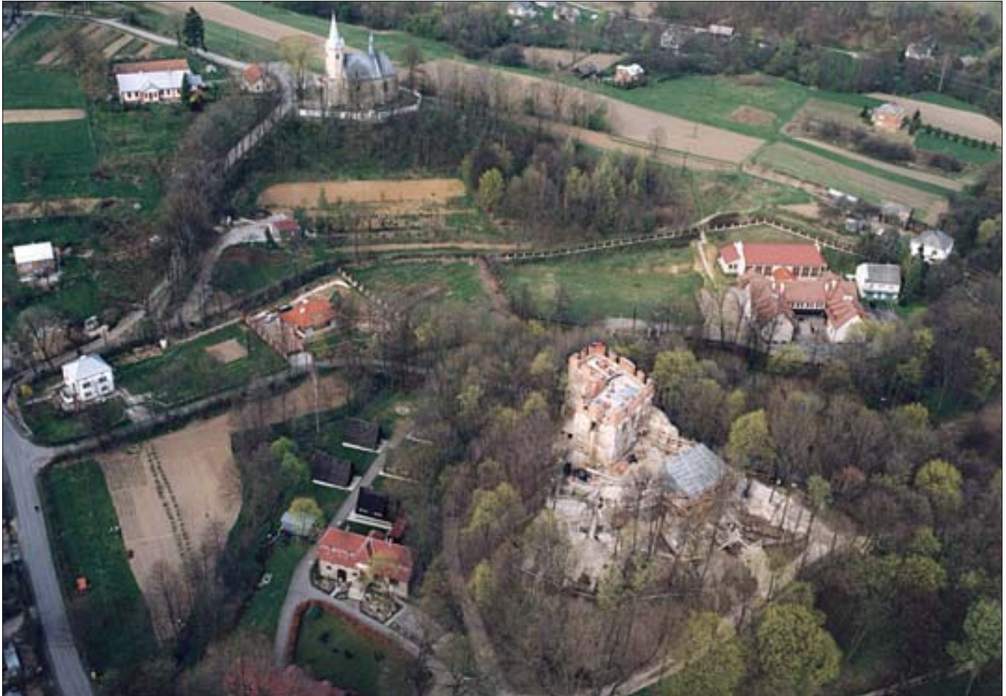
1. Korzkiew, zamek i kościół. Widok lotniczy. Fot. S. Markowski, 1999 r.

BADANIA HISTORYCZNE I IKONOGRAFICZNE, PROJEKT, ETAPY ODBUDOWY