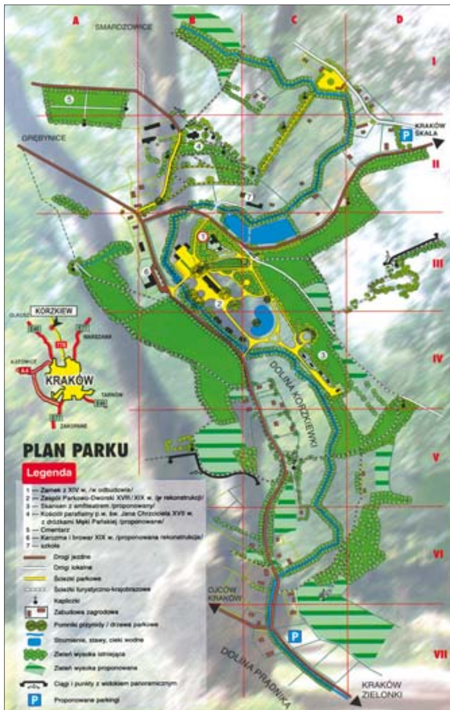
16. Plan parku w dolinie. Oprac. W. Niewalda, 1998 r.