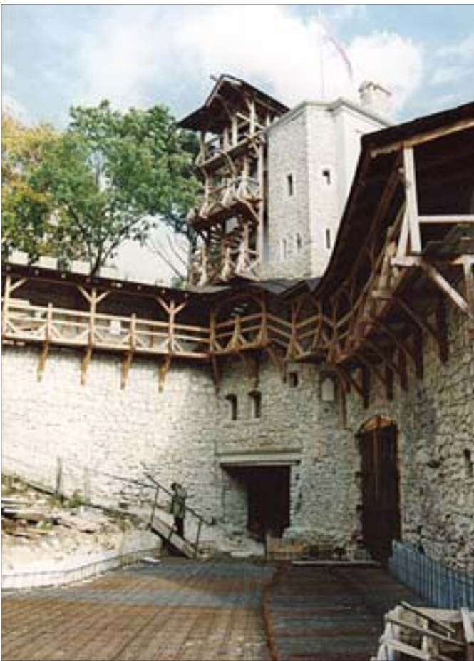
7. Brama wschodnia i południowo-wschodni odcinek murów po odbudowie; widok na ganki straży i dziedzińiec przygotowany do wylania płyty. Fot. autor, 2002 r.