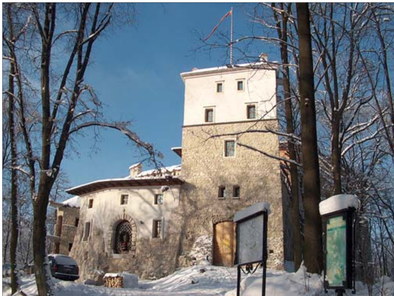
15. Korzkiew, zamek. Widok od południowego-wschodu. Fot. autor, 2003 r. 15. Korzkiew, castle. View from south-east. Photo: author, 2003.

W maju 1999 r., równoległe z pracami prowadzonymi w budynku bramnym, basztach i przy murach obronnych, przystąpiono do rozbiórki zniszczonych partii korony murów, naprawy murów nad