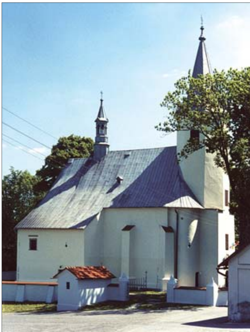
14. Korzkiew, kościół parafialny. 14. Korzkiew, parish church.

Korpus główny zamku miał znaczące ubytki w murach, lecz nie zachodziła obawa zachwiania konstrukcji jego fundamentów i ścian. Konieczne i pilne było jednak zabezpieczenie go przed skutkami opadów atmosferycznych i niskich temperatur sprzyjających zagrzybieniu, zasoleniu i rozwarstwianiu się murów. Niezbędne okazało się podniesienie korony murów pustakami ceramicznymi Porotherm oraz zabezpieczenie ich powierzchni, wykonane już w październiku 1998 r.