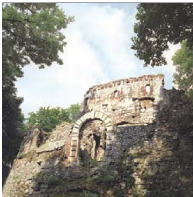
17. Widok bramy zamku w murze obronnym. Fot. S. Michta, 1997 r. 17. View of castle gate in the defence wall. Photo: S. Michta, 1997.

przestrzeń o pow. 114 m 2 planuje się wykorzystać na ekspozycję przedstawiającą historię zamku, a być może także na prezentację twórczości znakomitego rzeźbiarza Ludwika Pugeta 62 . Podobnie przy rekonstrukcji baszty zachodniej wykonano wieniec żelbetowy, spinający obwodowo mury baszty. W sierpniu 2002 r., po ustabilizowaniu się struktur skalnych (powierzchnia wapienia pod wpływem powietrza twardnieje stopniowo), rozpoczęto – zgodnie z projektem dr. inż. Stanisława Karczmarczyka – wykonywanie płaskiej, żelbetowej, zbrojonej prętami, stalowej płyty stropowej o grubości 25 cm z betonu klasy B.30, wspartej na ścianie od dziedzińca, a z drugiej strony na wieńcu żelbetowym, dodatkowo opartym na słupach żelbetowych. Wylewanie betonu na zbrojenia pod płytę rozpoczęto w październiku 2002 r.