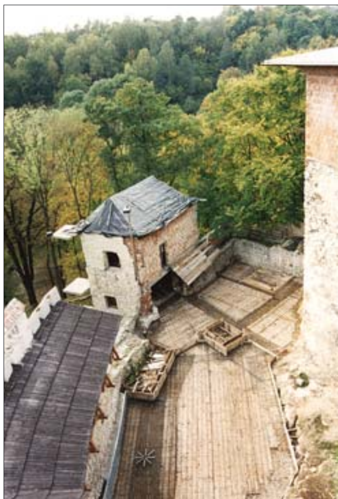
8. Dziedziniec zamku ze zbrojeniem przygotowanym do wylania płyty; od lewej – odbudowany południowy odcinek muru obronnego, baszta zachodnia w trakcie odbudowy, na prawo ściana zamku. Fot. autor, 2002 r.

W ślad za opracowanym projektem zagospodarowania otoczenia zamku i kościoła powinny pójść w przyszłości projekty szczegółowe dotyczące samej wsi Korzkiew i innych wnętrza doliny, określające precyzyjnie zakres rekultywacji stoków wzniesień, form małej architektury np. ogrodzenia, mostki, tablice informacyjne, korekty plastyczne w obiektach o błędach w architekturze. Próbą takiego przedsięwzięcia było opracowanie w 2001 r. koncepcyjnego projektu zagospodarowania przestrzennego Nowej Wsi Korzkiewskiej, który wprowadzał nową zabudowę w rejon Prądnika Korzkiewskiego u wylotu dolin Prądnika i Korzkiewki 30 . Opracowanie, studium autorstwa Niewaldy, winno stać się podstawą dla planu szczegółowego zagospodarowania gmin Zielonki i Skała.