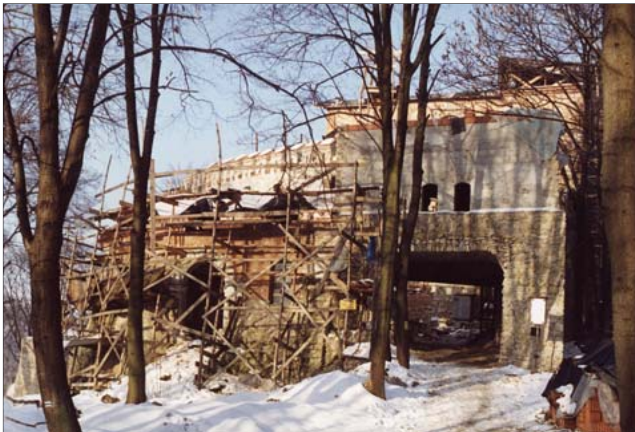
13. Południowy odcinek muru obronnego i baszta wschodnia w trakcie odbudowy. Fot. autor, 1999 r.