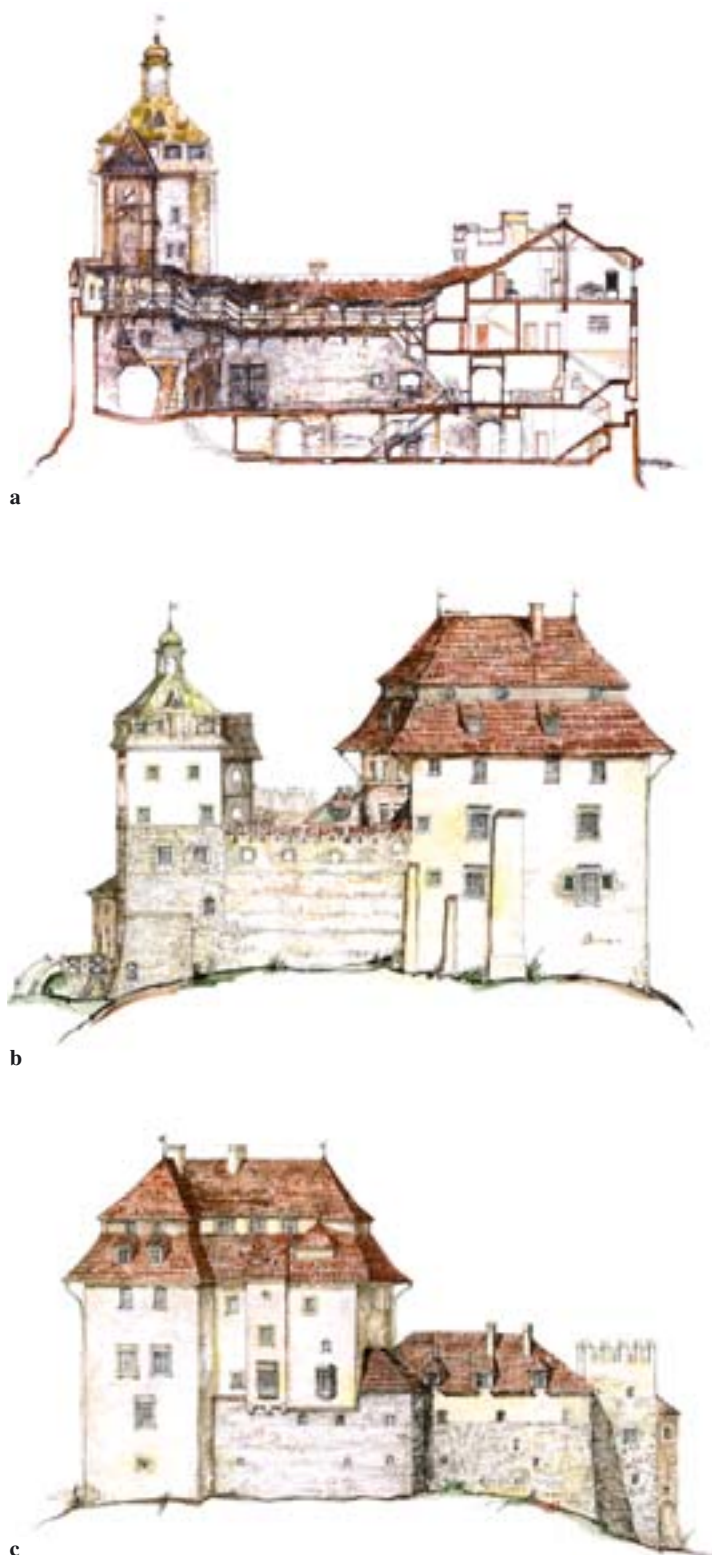
12. Projekt odbudowy zamku: a) przekrój północ-południe; b) widok elewacji wschodniej; c) widok elewacji zachodniej. Oprac. zespół pod kierunkiem arch. J. Wrzaka, 2002 r. Rys. J. Lenda.

Skuteczna donośność używanych w XVI i XVII w. muszkietów i bardziej nowoczesnych flint sięgała 240 m (60 prętów – 222 m) 46 . Znakomity XVII-wieczny holenderski teoretyk fortyfikacji A. Freytag uważał, że w odległości 60-70 prętów (222-333 m) od nieprzyjaciela można już spokojnie wbić łopatę przy kopaniu rowów 47 . Niestety, nie dysponujemy danymi