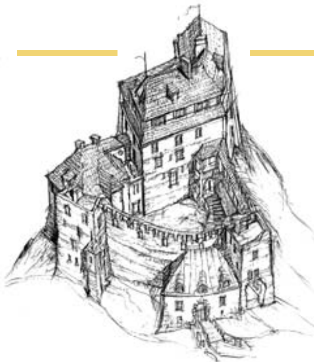
10. Projekt odbudowy zamku w Korzkwi; perspektywa. Oprac. zespół pod kierunkiem arch. J. Wrzaka, 2002 r. Rys. J. Lenda.

10. Project of the reconstruction of Korzkiew Castle, perspective. Prepared by a team headed by architect J. Wrzak, 2002. Drawing: J. Lenda.