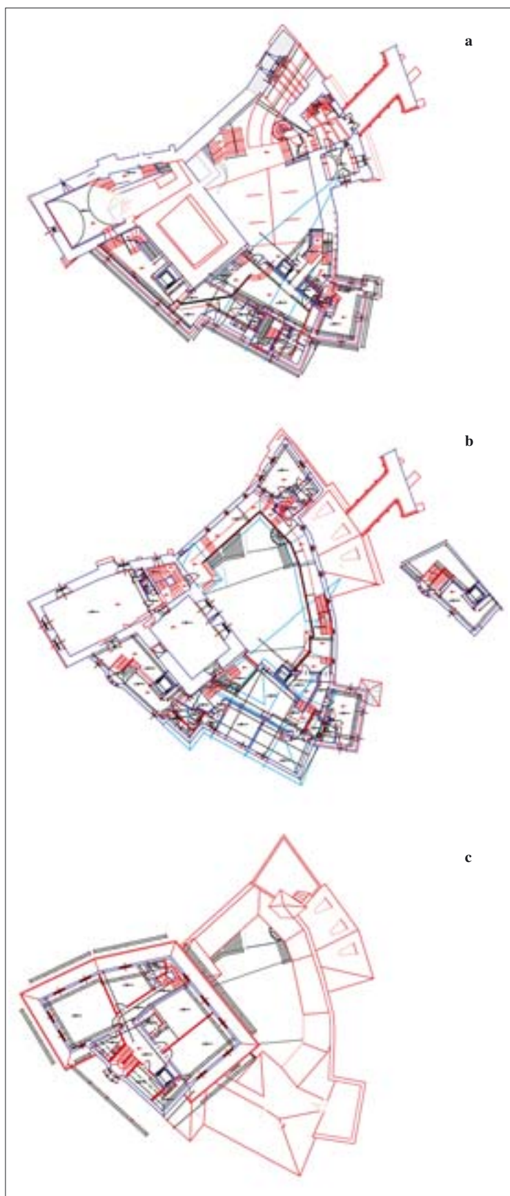
10. Rzuty zamku w Korkkwi: poziom dziedzińca (a), 1 piętra (b), poddasza (c); projekt odbudowy. Oprac. zespół architektów pod kierunkiem J. Wrzaka, 2002 r.