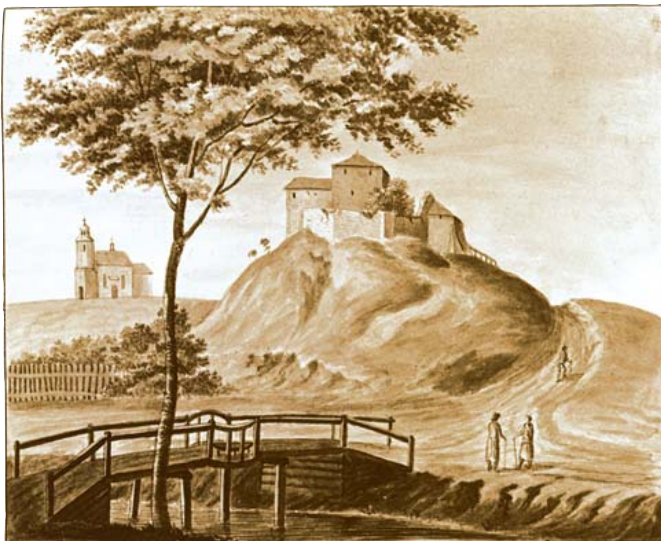
2. Widok kościoła i zamku w 1805 r.: Gorskwia, Dan 14 Julii 1805 De Usener ad naturam . Rysunek sepią autorstwa Filipa Usenera, Muzeum Narodowe w Kielcach.