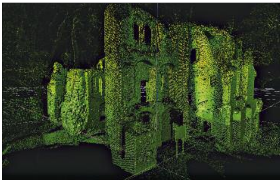
2. Skan 3D ruin zamku rodziny von Dewitz w Dobrej Nowogardzkiej.